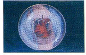
Benek Çiçek Elbistanlı, Serbest Dal Başarı Ödülü, 2001