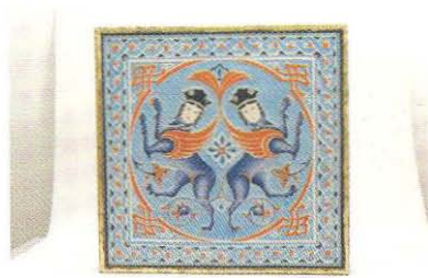
Sezin Erbil, Çini Dalı Başarı Ödülü, 2004