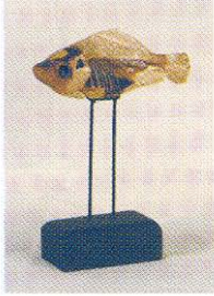
Tuba Korkmaz, Serbest Dal Başarı Ödülü, 2002