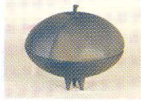
Melahat Öztürk, Serbest Dal Başarı Ödülü, 2002