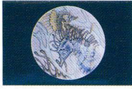
Betül Demirezen, Çini Dalı Başarı Ödülü, 2001