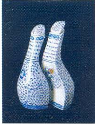
Nadire Ulusal, Çini Dalı Başarı Ödülü, 2002