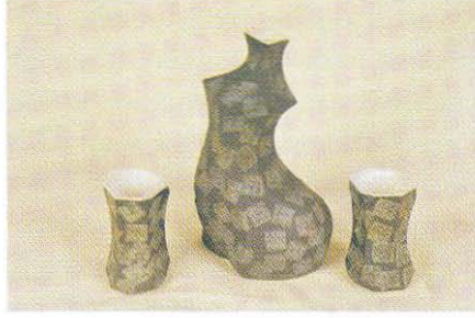
Kei Hoashi, Serbest Dal Başarı Ödülü, 2003