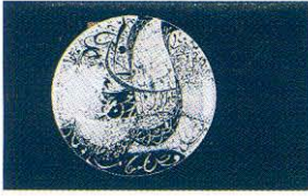
Esra Kokurcan, Çini Dalı Başarı Ödülü, 2001