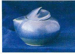
Sıraç Tütüncü, Endüstriyel Dal Başarı Ödülü, 2001