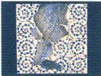
Esra Köseaydın, Çakı Ailesi Özel Ödülü, 2002

ğı sorusuna sürekli açık olmakla birlikte, öğrenci, eğitici, izleyici, toplum, sektör gibi bir çok farklı grup için öğretici sonuçlarıyla çok yararlı ve gerekli etkinliklerdir.