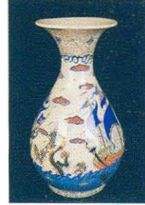
Zübeyde Toraman, Çakı Ailesi Özel Ödülü, 2003

deki elemandan, toplumdaki bireye kadar tüm katmanların yararlanacağı gelişmeleri sağlayabilir.