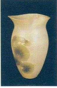
Wataru Nagase, Torna Dalı Başarı Ödülü, 2003