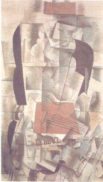
G. Braque, Womanguitar

gerçekleştirdiğini kabul edersek; görünen gerçekliğin de bir 'duyumlar kompleksi' olduğu sonucuna ulaşabiliriz. (Tunalı 1992:21) Görünen gerçekliğin göreceli ve değişken olduğu ve gerçeğin yalnızca belli bir cephesini oluşturduğu kuramı, bilimsel verilerle kanıtlanmış olup (Albert Einstein'ın 'Görecelik Kuramı') ayrıca Platon'un kuramında olduğu gibi felsefede sorgulanan bir olgudur. Sanat tarihi ise farklı gerçeklik algılarının yansımaları ile oluşmuştur diyebiliriz.