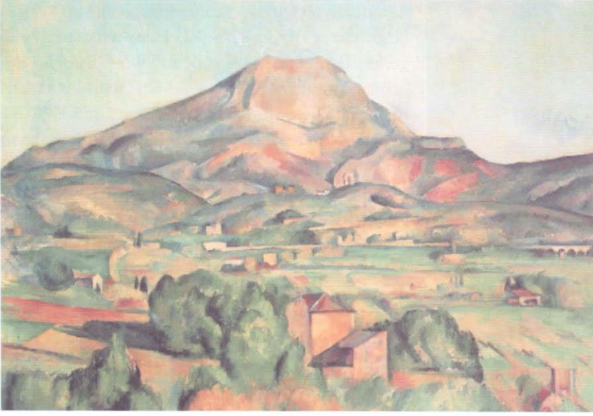
P. Cezanne, Sainte Victorie

çidir. Cezanne, çok sayıda yaptığı peysajlarda (manzara resmi), naturmort (ölüdoğa) veya figürlü kompozisyonlarında kendine has bir üslup geliştirmiş ele aldığı biçimleri geometrikleştirerek tuvale aktarmıştır. Bu yapıtlarda, klasik kompozisyonun nesne (form) ve mekan (derinlik) gibi elemanların, ressam tarafından farklı renk tonlarının uyumu (modülasyonu), fırça hareketlerinin yönü ve çizgi yoluyla çözümlendiği ve öncelikle kübik bir kompozisyon oluşturma amacı ile kullanıldığı görülmektedir. Ressamın amacı yine canlı veya cansız nesneyi resmetmek olsa da resimsel elemanlar; nesneyi gösterme, oluşturma işlevini yerine getirmekle beraber bağımsızlaşmaktadır. Yani Cezanne'in resimlerinde 'nesne' amaç olmaktan çıkıp