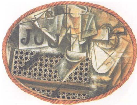
P. Picasso, Still Life With Chair

kan ve nesne bir çağrışım olarak resimde kendilerini hissettirirler. Böylece analitik kübist resim, doğadan soyutlanmış elemanlarla düşünsel soyut bir yapı oluşturur. Bu yapı içinde doğal bir varlık olan nesne, niteliklerini yitirip salt görsel değil farklı duyumları da davet eden düşünsel soyut bir eleman haline dönüşür.