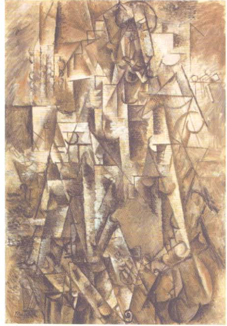
P. Picasso The Poet

Nesnenin birebir taklidi eğitimde alınması gereken vazgeçilmez bir yol, bir adım olmakla birlikte günümüz estetik ölçüleri ile kıyasladığımızda tek başına yeterli bir yöntem olmadığı düşünülmektedir. Sanat tarihi ve geçmişin sanatçıları bu süreci yaşayarak yansıtma yöntemini çeşitlendirdiğine göre eğitimde de bu süreç daha net bir şekilde uygulanabilir. Bu tavır, geleceğe sırtını dönmek anlamında değil, ancak sanat tarihinin diğer açılımlarından daha verimli bir şekilde faydalanma önerisi olmalıdır.