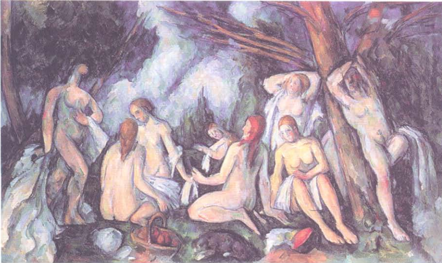
P. Cezanne, Yıkananlar

çidir. Cezanne, çok sayıda yaptığı peysajlarda (manzara resmi), naturmort (ölüdoğa) veya figürlü kompozisyonlarında kendine has bir üslup geliştirmiş ele aldığı biçimleri geometrikleştirerek tuvale aktarmıştır. Bu yapıtlarda, klasik kompozisyonun nesne (form) ve mekan (derinlik) gibi elemanların, ressam tarafından farklı renk tonlarının uyumu (modülasyonu), fırça hareketlerinin yönü ve çizgi yoluyla çözümlendiği ve öncelikle kübik bir kompozisyon oluşturma amacı ile kullanıldığı görülmektedir. Ressamın amacı yine canlı veya cansız nesneyi resmetmek olsa da resimsel elemanlar; nesneyi gösterme, oluşturma işlevini yerine getirmekle beraber bağımsızlaşmaktadır. Yani Cezanne'in resimlerinde 'nesne' amaç olmaktan çıkıp