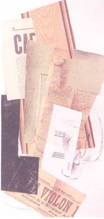
G. Braque, Carafe and Newspaper