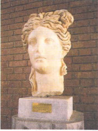
Resim 5: Apollon Heykelinin başı