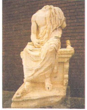
Resim 6: Oturan Ozan Heykeli