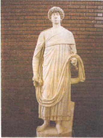
RESİM 7: Flavius Palmatus'un Heykeli İ.S. Geç. 5.yy