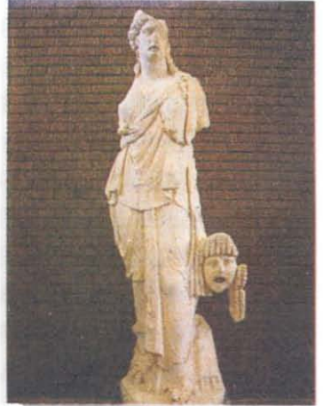
RESİM 8: Melpomene İ.S. 1.yy