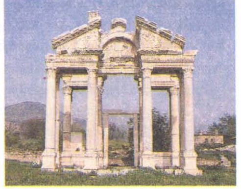
RESİM 2: Kentin Simgesi “Tetrapylon”