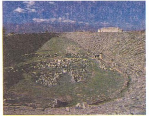
RESİM 4: Afrodisias Stadyumu