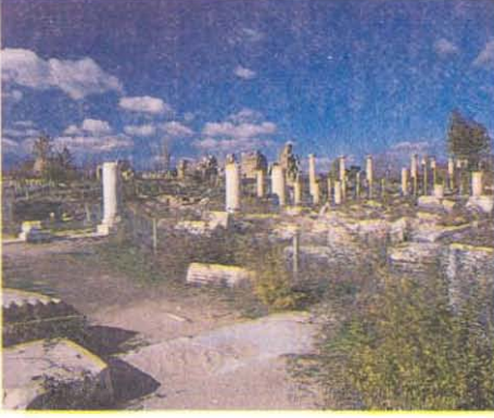
RESİM 1: Afrodisias Genel Görünüm