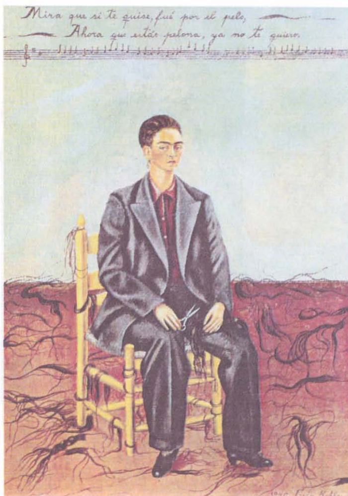
Resim 3: Otoportre 1940.