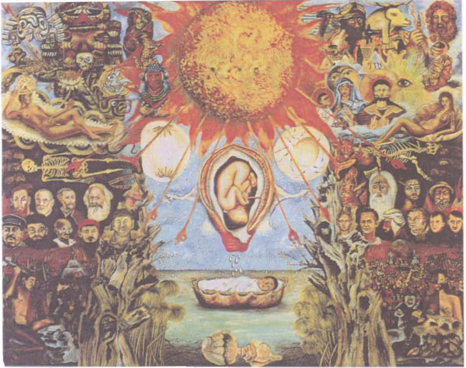
Resim 6: Musa ya da Hücre Çekirdeği (1945).