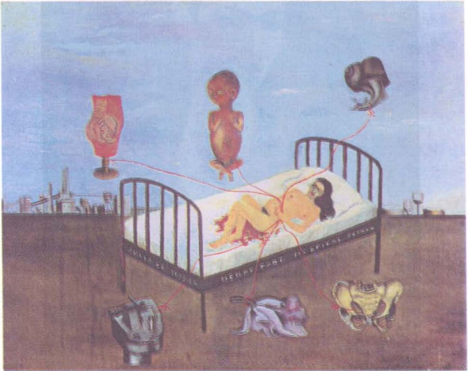
Resim 2: Henry Ford Hastanesi (1932).