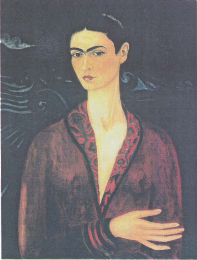
Resim 1: Otoportre (1926) (Frida Kahlo için “Ressam olmanın” başlangıcını oluşturan ondokuz yaşında aynadaki görüntüsünden etkinerek yaptığı ilk Resim).