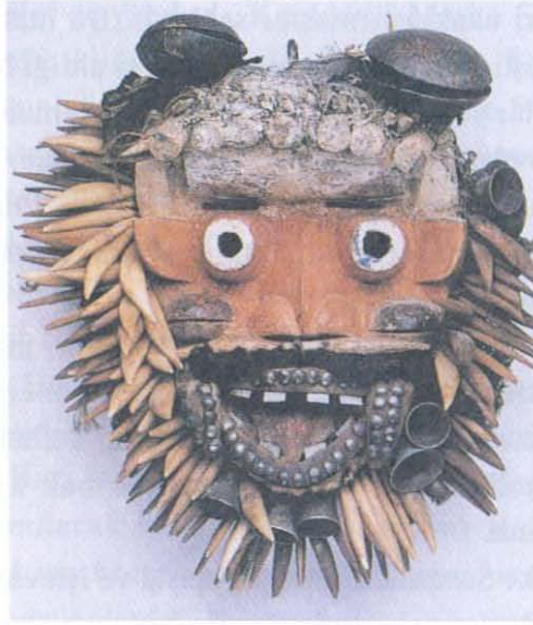
Fotoğraf 2: Afrika Sanatı Çocuk Maskesi; Ahşap, fildişi, kürk, saç, tüy, giysi parçaları, zil, metal, iri başlı çivi. Yükseklik: 38 cm.

Afrika'da Maske Sanatının önemli bir kısmını Mısır oluşturmaktadır. Mısır Maske Sanatı, M.Ö. 3000 dolaylarında, Nil ırmağı ve Deltası çevresinde başlayıp 3000 yıl boyunca sürecektir bir kültür çağının mirasıdır. Mısır sanatında maskelerin tümü dini amaca hizmet etmek için yapılmıştır.