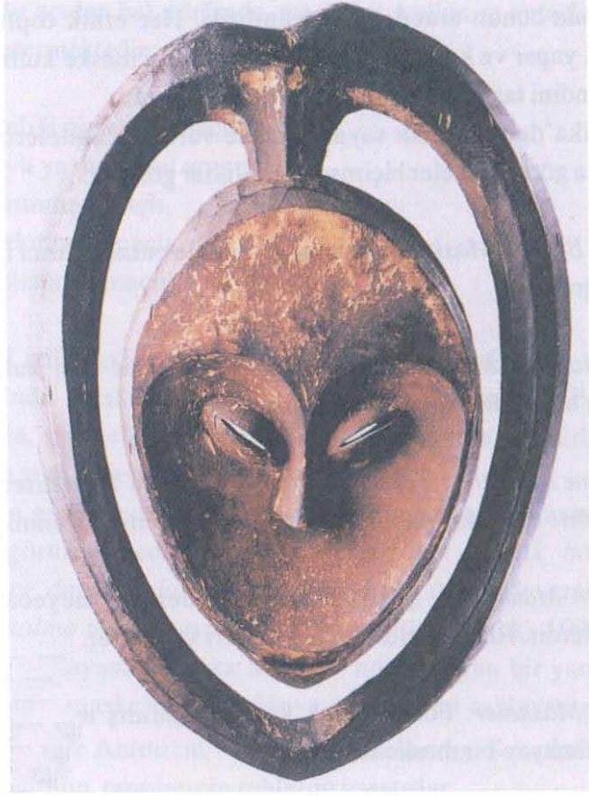
Fotoğraf 1: Yürek Biçimli Maske, Çok renkli ahşap, Yükseklik: 55 cm.

ortaya çıkardı (Fotoğraf 2). Bu maskelerin çocuklar için yapıldığı da varsayılmaktadır.