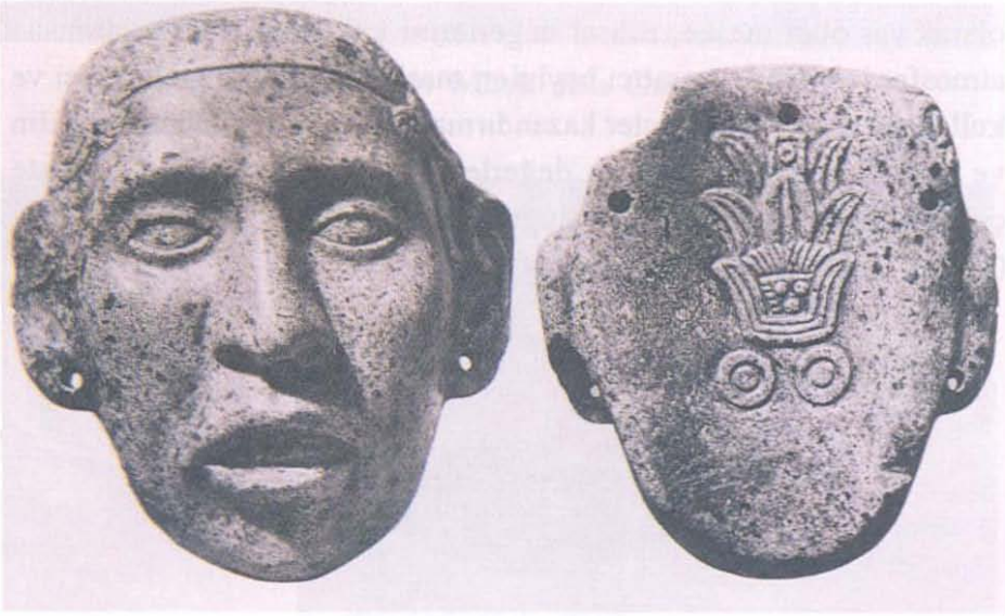
Fotoğraf 4: Duman Amblemlı maske: Green Stone (Yeşil Taş) Yükseklik: 18,5.

Maskelerin yapımında kullanılan malzemeler çok çeşitlidir. Ahşap üstü; sedef ve değerli taşların kombinasyonu mozaik maske, görüntüleri yaratılırdı. “Fakat maskeler arasında en önemlisi “green stone” taşından yapılmış olanlardır (Fotoğraf 4). Bu tür maskeler ilahi kudreti ve tanrıları simgelerdi” (Pasztory, 1983:253). İlahi kudreti simgelemeleri nedeniyle, bu maskeler, insanlar tarafından kullanılamazlardı. Bu nedenle, bu tip maskelerin göz çukurları açılmamıştır.