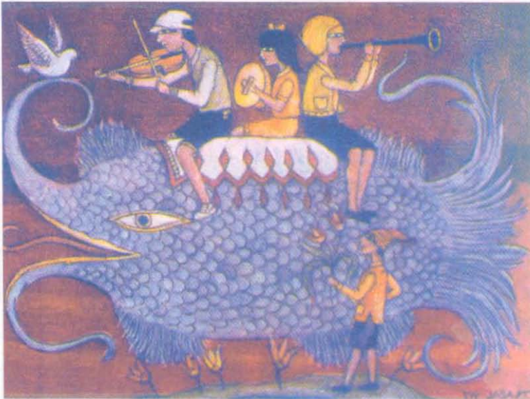
Resim 6: NURİ ABAÇ (1997 Balk 30x40 cm.)