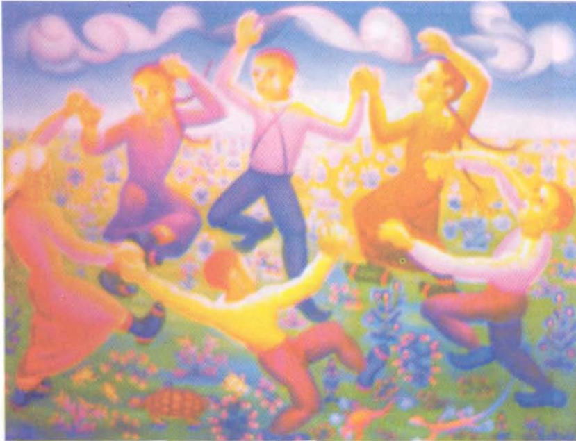
Resim 8: İBRAHİM BALABAN