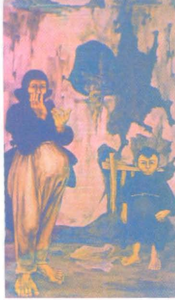
Resim 3: NEŞET GÜNAL