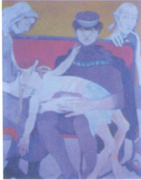
Resim 7: NEŞE ERDOK (Hasta Çocuk)