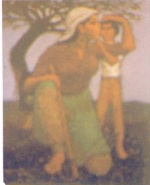
Resim 2: NURİ İYEM (1970 Tarlada Ana ve Çocuk)