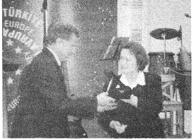
ART-İST 2005 15. İstanbul Sanat Fuarı kapsamında; Koleksiyoner Kurum Onur Ödülü'ne A.Ü. Çağdaş Sanatlar Müzesi değer bulundu.

A.A: Özellikle özel üniversiteler sanatlar eğitiminde farklı disiplinlerin işbirliğine dayalı programları uyguluyorlar. Bunu ben de uygun buluyorum. Fakültemizde farklı bölümler olmakla birlikte uyguladığımız kredili sistem bir ölçüde farklı disiplinlerin işbirliğine olanak tanıyor. Öğrenci ilgi duyduğu, öğrenmek istediği farklı disiplinden bir dersi veya dersleri seçmeli olarak alabiliyor. Anadal, yandal programları da öğrenci için bir fırsat. Öğrencilerimiz, türü ne olursa olsun her etkinliğe katılabiliyorlar, yarışmalarda ödüller alabiliyorlar. Bu da bölüm programının her türlü disipline uygun olduğunun bir göstergesi.