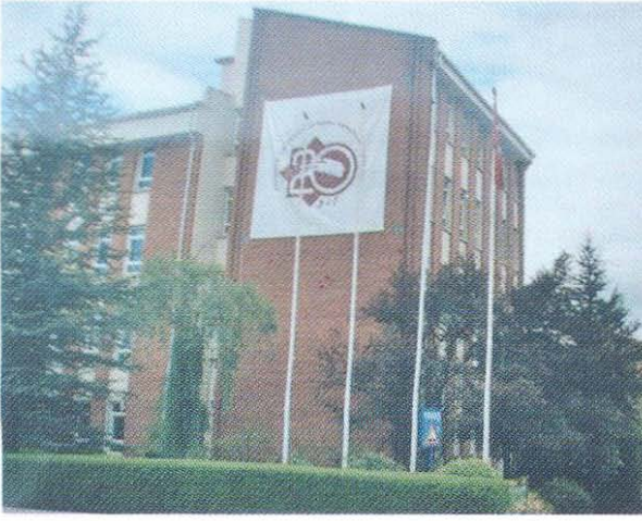
G.S.F. ve 20. Yıl Logosu

H.E: Batıdaki benzer müzelerle kıyasladığımızda gerek yapıt, gerek sergileme şekilleri açısından arada çok önemli farklar görmekteyiz. Bu durumu İstanbul Modern için de söyleyebiliriz. Gerçi o kısmen düzenlediği sergilerle bu eksikliği giderebiliyor. Bu fark sizce bizim bakış açımızın farklılığından mı? Yoksa koşullarımızın bir sonucu mu? Ya da kurum müzelerini farklı bir kategoride mi değerlendirmek gerekir?