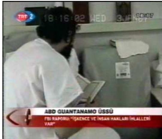
Resim 23. (3 Ocak 2007 TRT 2 Anahaber Bülteni)

Resim 21-22-23'te 3 Ocak 2007 TRT 2'de "ABD Guantanamo Üssü"ne ilişkin sunulan haberde yer alan ayrıntı görüntüleri verilmiştir. Haberde "Raporda ayrıca, Kur-an okuduğu için Guantanamo'daki bir tutuklunun kafasının paket bandı ile sarıldığı"na ilişkin ifadeler kullanılmıştır. Haberle ilgili tüm görüntüler incelendiğinde mahkûmlardan birinin hücrelerinde Kur-an okuduğu, tesbih çektiği ve hücre odasında yerde bulunan seccade detayı dikkat çekmiştir. Haberle arasında bir bağ olabileceğinden hareketle de bu görüntüye yer verilmiştir. Ancak haberde sözü edilen mahkûmun kafasının paket bandıyla sarıldığı detayına ilişkin herhangi bir görüntüye rastlanmamıştır. Aksine haber içeriğinde gizliden bir eleştiri yapılmış gibi görünse