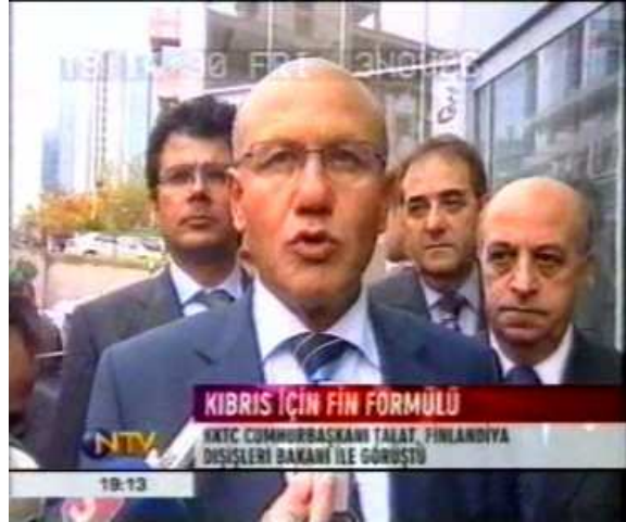
Resim 12. (3 Kasım 2006 NTV Anahaber Bülteni)

Resim 12’de görüntülenen KKTC Cumhurbaşkanı Mehmet Ali Talat’ın yüz ifadesine bakıldığında haber içeriği ile bir bağlantı kurmak mümkündür. Zira haberde “Kıbrıs İçin Fin Formülü” başlığı kullanılırken, içerikte Helsinki’de yapılması planlanan toplantının iptali anlatılmaktadır. Görüntüde Talat’ın Brüksel’de yaptığı açıklama yer almaktadır. Buna göre Talat, “ Helsinki toplantısı iptal olsa da birileri hâlâ masada ” diyerek, konu hakkındaki kararlığını dile getirmektedir. Resim 12’de yer alan görüntü de bu ifadeyi doğrulamakta ve Talat’ın yüz ifadesinden konu hakkındaki kararlığı yakından görülmektedir. Bu anlamda haber içeriği ile anlatılan öykü arasında bir bağlantı ve dolayısıyla bir tutarlılık dikkat çekmektedir. Nitekim aynı haber içeriğinde verilen boy çekiminde içerik ile görüntünün farklı anlamlar taşıdığı dikkat çekmiştir. Bu bağlamda göğüs çekimi ile verilen bu görüntünün, haber içeriğini desteklediği anlaşılmaktadır.