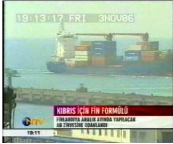
Resim 5. (3 Kasım 2006 NTV Anahaber Bülteni)

Resim 5'te haber içeriğinde Magosa Limanı hakkında bilgi verilirken, ekranda verilen bu görüntü ile Kıbrıs konusunda söz konusu limanın önemine vurgu yapılmıştır. Haberde Fin Dışişleri Bakanı Tuomioja'nın arabuluculuğu ile Kuzey Kıbrıs ve Rum tarafı arasında Türkiye'nin Limalarının Rum gemi ve uçaklarına açılması karşılığında Magosa Limanı'ndan doğrudan ticaret tüzüğünü uygulanması üzerindeki formülden söz edilmektedir. Bu anlamda genel çekim ölçeğinde ekrana yansıtılan liman görüntüsü haberin anlatı öyküsü bakımından ön plana çıkartılan öge olarak dikkat çekmektedir. Haber içeriğinde yer alan “liman” ifadeleri sırasında ekrana yukarıdaki görüntünün getirilmesiyle anlamın güçlendirildiğini söylemek mümkündür.