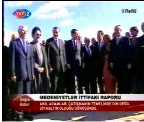
Resim 26. (13 Kasım 2006 TRT 2 Anahaber Bülteni)

13 Kasım 2006 tarihli TRT 2’de verilen “Medeniyetler İttifakı” başlıklı haberde yer alan “akil adamlar” görüntüsü Resim 26’daki şekliyle sunulmuştur. Görüntüde yer alan ve içlerinde Başbakan Recep Tayyip Erdoğan’ın da bulunduğu “akil adamlar” alt açı tekniğinin kullanılmasıyla yüceltilmişlerdir. Böylece görüntüde yer alan kişilerin “üstünlüğüne” vurgu yapılmıştır. Haber içeriğinde “ Çeşitli ülkelerden siyasetçilerin yanı sıra, din adamı ve toplumbilimcilerin de oluşturduğu 20 kişilik ‘akil adamlar grubu’ bir raporla, çalışmalarına son noktayı koydu. BM Genel Sekreteri Kofi Annan’a sunulan raporda Müslüman ve Batı toplumları arasında büyüyen ayrımın nedenleri tespit ediliyor ve somut öneriler ortaya koyuluyor ” denilerek, bu kişilerin önemine dikkat çekilmektedir. Böylelikle haber öyküsünün güçlendirilerek, anlamlı hale