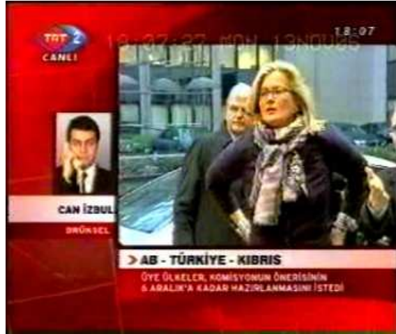
Resim 9. (13 Kasım 2006 TRT 2 Anahaber Bülteni)

13 Kasım 2006 tarihinde TRT 2’de verilen habere konu olan Resim 9’da verilen kişi, haberdeki “ AB Dışişleri Bakanları toplantısı devam ediyor ” ifadesinden anlaşılacağı üzere AB Dışişleri Bakanlarından birisidir. Haberde doğrudan özne konumunda olmamakla birlikte, haberin içeriği ile doğrudan ilgili birisidir.