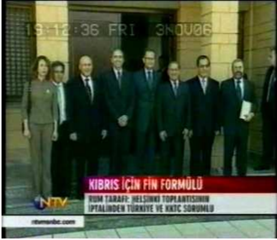
Resim 3. (3 Kasım 2006 NTV Anahaber Bülteni)