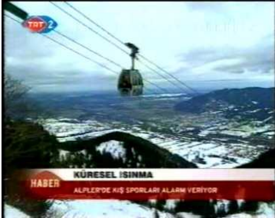
Resim 37. (19 Ocak 2007 TRT 2 Anahaber Bülteni)