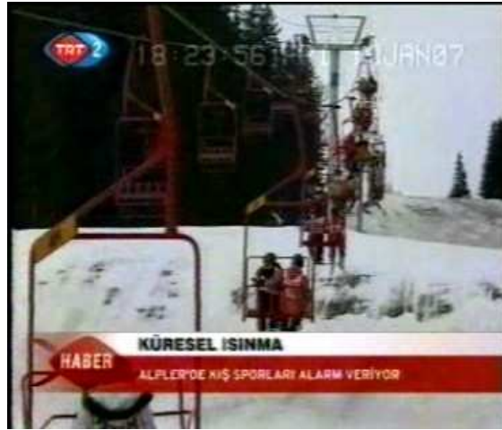
Resim 39. (19 Ocak 2007 TRT 2 Anahaber Bülteni)

Kameranın kendi eksenini etrafında aşağıdan yukarıya ya da yukarıdan aşağıya doğru hareket (tilt) ettirilerek elde edilen görüntüyle haberde daha önceki planlarda gösterilen objelerin detayları hakkında izleyici bilgilendirilmektedir. Buna göre 19 Ocak 2007 tarihinde TRT 2’de sunulan “Küresel Isınma” başlıklı haberde bu tekniğin kullanıldığı görülmüştür. Küresel ısınma sonucunda olumsuz etkilenen dağ sporlarına yapılan vurgunun Resim 37, Resim 38 ve Resim 39’da gösterilen görüntülerle desteklendiği anlaşılmaktadır.