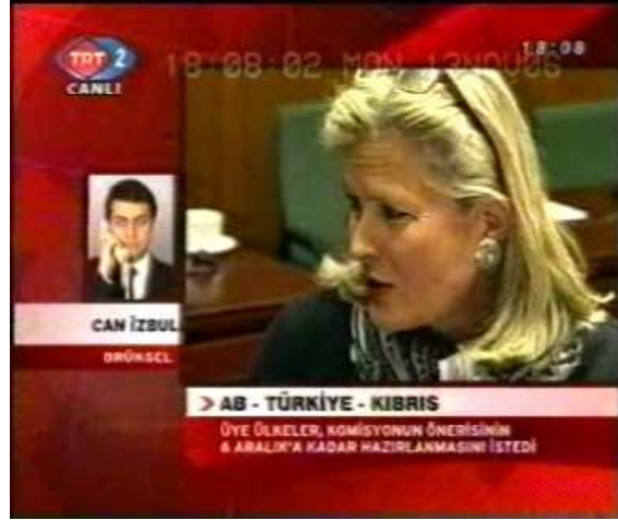
Resim 18. (13 Kasım 2006 TRT 2 Anahaber Bülteni)

Baş çekiminde görüntüde yer alan kişinin tüm mimik, kaş ve göz ifadeleri yakından gözlemlenmektedir. Resim 16-17-18’de yer alan Avrupalı bakanların, haber içeriğinde “.... Komisyondan Türkiye’nin limanlarını açmaması durumunda ne tür yönde bir hareket edilmesi gerektiğine dair önerisini en geç 6 Aralık’ta hazır hale getirmesini istedi” görüşleri yansıtılmaktadır. Kullanılan bu çekim ölçeği ile bakanların yüz ifadeleri arasında bir bağ kurulduğunda, Türkiye konusunda gergin oldukları ve Türkiye’nin bir an evvel hazırlıklarını tamamlaması yönünde istekli oldukları anlaşılmaktadır. Haber içeriğinde sezilen gergin havayı, görüntülerdeki kişilerin yüzlerinde de görmek