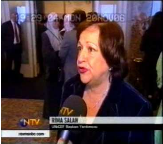
Resim 31. (20 Kasım 2006 NTV Anahaber Bülteni)