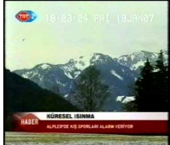
Resim 32. (19 Ocak 2007 TRT 2 Anahaber Bülteni)

Resim 30-31-32’de normal açı ile verilen görüntülerde dikkat çeken nokta, görüntüde gösterilen kişi(ler)nin, nesne(ler)in doğrudan izleyicinin göz seviyesinde sunulmasıyla, izleyiciye izlediği içerik hakkındaki görüntünün önemli olduğu anlatılmaktadır. Buna göre Resim 31’de yer alan UNICEF Başkan Yardımcısı Rima Salah’ın görüntülerinin ekrana normal açı ile yansıtılmasıyla, Salah’ın anlattıklarının önemine vurgu yapılmıştır. Resim 32’in alıntılıandığı haberde ise “Küresel Isınma”nın doğaya etkileri anlatılırken, etkiye maruz kalan doğa görüntüsü verilerek, konu pekiştirilmeye çalışılmıştır. İzlenen haberler içinde en çok kullanılan açı örneğinin normal açı olduğu tespit edilmiştir.