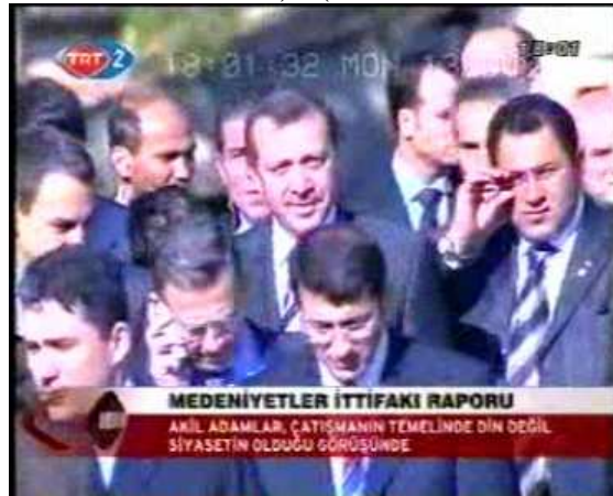
Resim 29. (13 Kasım 2006 TRT 2 Anahaber Bülteni)