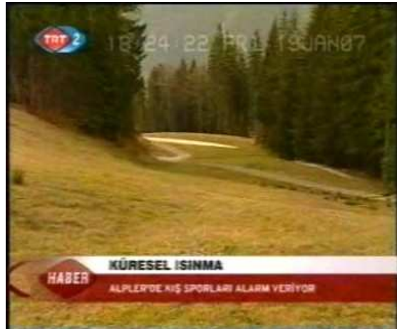
Resim 42. (19 Ocak 2007 TRT 2 Anahaber Bülteni)

19 Ocak 2007 tarihinde TRT 2’de sunulan “Küresel Isınma” başlıklı haberde yakınlaşma-uzaklaşma kamera hareketinin kullandığı saptanmıştır. Görüntüler incelendiğinde aslında küresel ısınma ile doğrudan ilgisi olmayan bir nesneden yakınlaşma-uzaklaşma yapıldığı anlaşılmaktadır. Ancak kullanılan tekniği göstermek bakımından bu görüntülere burada yer verilmesi uygun görülmüştür.