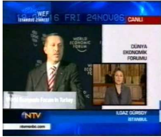
Resim 14. (24 Kasım 2006 NTV Anahaber Bülteni)

Resim 13'te verilen görüntü, 20 Kasım 2006 NTV anahaber bültenine aittir. Haberde 53 ülkeden kadın bakanların bir araya gelerek, kadınların sorunlarına çözüm arandığı bir toplantıdan söz edilmektedir. Buna göre Resim 13'teki verilen görüntünün sahibi Serra Leone Kadın ve Çocuk Bakanı Memurati Korumah'tır. Korumah'ın yüz ifadeleri yapılan göğüs çekim ölçeği nedeniyle yakından takip edilebilmektedir. Buna göre söz konusu kişinin konuyla ilgi olarak ne kadar heyecanlı ve söyleyecek çok sözü olduğu mikrofonu yaptığı açıklama sırasındaki yüz ifadesinden anlaşılmaktadır. NTV kanalının, haberi veriş sırasında özellikle yakın çekim ölçeklerinden göğüs çekimini kullanarak kadın bakanı ön plana çıkarttığı görülmektedir.