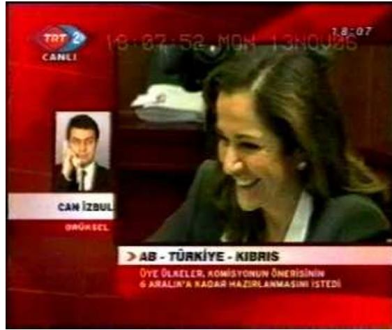
Resim 15. (13 Kasım 2006 TRT 2 Anahaber Bülteni)

Resim 15'te verilen görüntülerde kullanılan omuz çekim ölçeği, aslında göğüs çekim ölçeğine benzemektedir. Nitekim iki ölçekte de kişilerin yüz ifadeleri daha yakından görülebilmektedir. Bu bağlamda yukarıda yer alan görüntüde de kişinin içinde bulunduğu duygusal an hakkında çıkarım yapmak olasıdır. Resim 15'teki kişinin mutluluğu verilen görüntülerden açıkça anlaşılmaktadır. Söz konusu görüntülerde yer alan kişi, haberin doğrudan öznesi olmasa da kullanılan çekim ölçeği tekniğinin yansıtılış biçimini göstermek için görüntüye burada yer verilmiştir. Aslında haberde gergin bir atmosfer sezilmektedir. Bu anlamda görüntüdeki kişinin mutlu olması, haberin özünü yansıtmamaktadır. Ancak denildiği gibi, çekim ölçeğini göstermek adına uygun bir görüntü olarak değerlendirilmiştir. Yoksa anlatılan haber öylküsü ile görüntünün tam anlamıyla uygunluğundan söz etmek mümkün değildir.