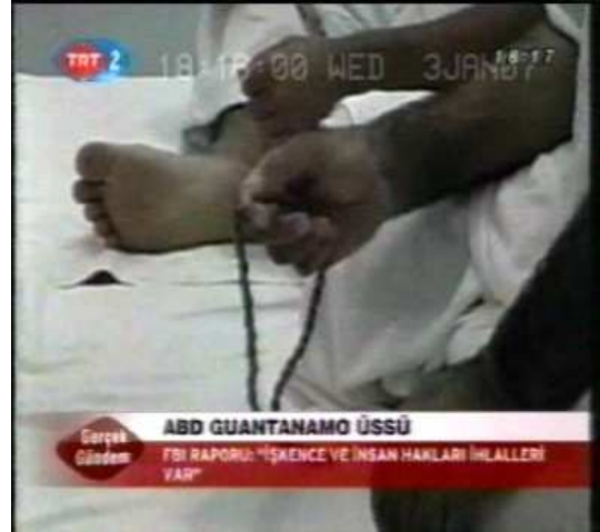
Resim 22. (3 Ocak 2007 TRT 2 Anahaber Bülteni)