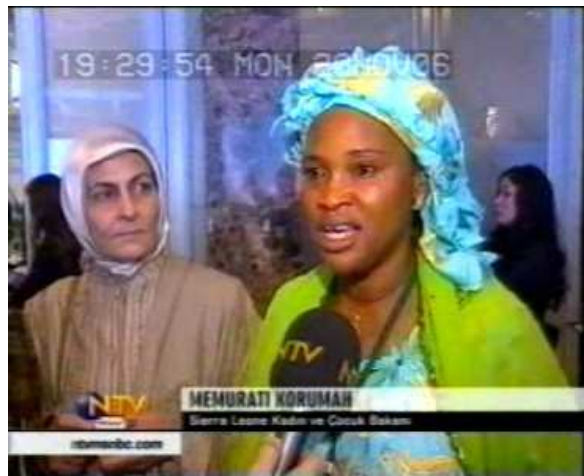
Resim 13. (20 Kasım 2006 NTV Anahaber Bülteni)

Resim 12’de görüntülenen KKTC Cumhurbaşkanı Mehmet Ali Talat’ın yüz ifadesine bakıldığında haber içeriği ile bir bağlantı kurmak mümkündür. Zira haberde “Kıbrıs İçin Fin Formülü” başlığı kullanılırken, içerikte Helsinki’de yapılması planlanan toplantının iptali anlatılmaktadır. Görüntüde Talat’ın Brüksel’de yaptığı açıklama yer almaktadır. Buna göre Talat, “ Helsinki toplantısı iptal olsa da birileri hâlâ masada ” diyerek, konu hakkındaki kararlığını dile getirmektedir. Resim 12’de yer alan görüntü de bu ifadeyi doğrulamakta ve Talat’ın yüz ifadesinden konu hakkındaki kararlığı yakından görülmektedir. Bu anlamda haber içeriği ile anlatılan öykü arasında bir bağlantı ve dolayısıyla bir tutarlılık dikkat çekmektedir. Nitekim aynı haber içeriğinde verilen boy çekiminde içerik ile görüntünün farklı anlamlar taşıdığı dikkat çekmiştir. Bu bağlamda göğüs çekimi ile verilen bu görüntünün, haber içeriğini desteklediği anlaşılmaktadır.