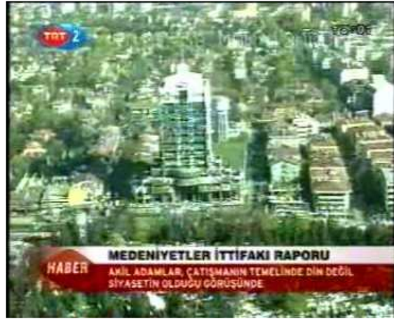
Resim 1. (13 Kasım 2006 TRT 2 Anahaber Bülteni)

Resim 1’de habere konu olan alan, çok uzak bir ölçekle verilmektedir. Böylece konunun kapsayıcı alanının genişliğine dikkat çekilmektedir. Çok uzak çekim ölçeğiyle verilen bu görüntünün dahil olduğu haber, “Medeniyetler İttifakı” başlığıyla verilmiştir. Dolayısıyla bütün medeniyetleri kapsayan ve kucaklayan bir içeriği anlatan haber, görüntünün bu ölçekle verilmesiyle bütünleşmiştir. Habere konu olan Medeniyetler İttifakı toplantısı, İstanbul’da gerçekleşmiştir. Söz konusu çekimin alt yapısı okunduğunda, özellikle görüntülerde İstanbul’un verilmesiyle haber içeriğinde yer alan bütünleştirici öğeye vurgu yapıldığı anlaşılmaktadır. Benzer şekilde İstanbul’un iki kıtayı (Asya-Avrupa) ve üç dini birleştirici özelliğinin ön plana çıkartıldığı algılanmaktadır. Görüntülerde bu tür ölçeğin kullanılmasıyla ayrıca Müslüman dünyanın batıyla bağlantısını sağlayan İstanbul’un Avrupa’ya ve Avrupa Birliği’ne açılan kapısı olduğu da anımsatılmaktadır.