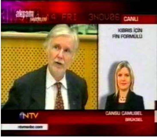
Resim 10. (3 Kasım 2006 NTV Anahaber Bülteni)