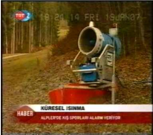
Resim 40. (19 Ocak 2007 TRT 2 Anahaber Bülteni)