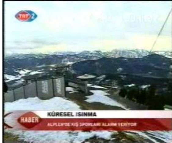
Resim 2. (19 Ocak 2007 TRT 2 Anahaber Bülteni)

Resim 2'deki görüntüde 19 Ocak 2007 tarihli TRT 2'nin "Küresel Isınma" adlı haberinde, Alpler'in uzaktan bir görüntüsüne yer verildiği görülmektedir. Buna göre küresel ısınmanın etki alanının ne kadar geniş olduğuna dikkat çekilmektedir. Haberin söyleminde küresel ısınmanın tehlikeli boyutlara ulaştığı hatırlatılırken, anlatıdaki öykü bu tehditin boyutlarının genişliğine bir gönderme yapmaktadır. Kullanılan çekim ölçeği ile bu durum desteklenmiştir. Buna göre artık küresel ısınma nedeniyle Alpler de tehlike altına girmiştir.