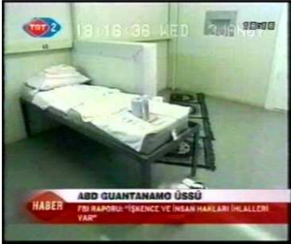
Resim 21. (3 Ocak 2007 TRT 2 Anahaber Bülteni)