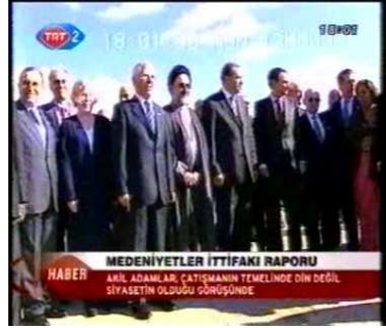
Resim 4. (13 Kasım 2006 TRT2 Anahaber Bülteni)

Toplu çekimin yapıldığı Resim 3 ve Resim 4'teki görüntülerde habere konu olan işe ve mekâna vurgu yapılmaktadır. Bu görüntülerde bireylerden ziyade topluluğun gücüne dikkat çekilmiştir. Özellikle iki haberin de içeriğine bakıldığında bir toplantının yapıldığı anlaşılmaktadır. Söz konusu toplantılarda tek tek bireylerden ziyade bir gruba atıfta bulunmaktadır. NTV'nin haber görüntüsünde AB Dönem Başkanı Finlandiya'da yapılan toplantıya katılan Kıbrıs Cumhurbaşkanı Mehmet Ali Talat ve BM şemsiyesi altında Türkiye ve İspanya'nın eş başkanlığında yürütülen toplantıda Başbakan Recep Tayyip Erdoğan'ın topluluk içinde verilen görüntüleri, onları topluluğun bir parçası olarak işaret etmektedir. Böylece haberde siyasal kimliklerden ziyade grubun üstünlüğünün ön plana çıkartıldığı görülmektedir. Ancak izlenen küresel haber görüntüleri arasında bu ölçeğin çok fazla kullanılmadığı gözlemlenmiştir.