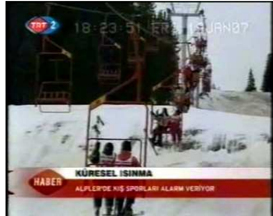
Resim 38. (19 Ocak 2007 TRT 2 Anahaber Bülteni)