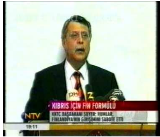
Resim 11. (3 Kasım 2006 NTV Anahaber Bülteni)

Resim 10'da göğüs çekimi kullanılarak verilen görüntüde, ekrana gelen kişinin yüzünü ve dolayısıyla da duygusal ifadelerini detaylı şekilde görmek mümkündür. Nitekim 3 Kasım 2006 NTV anahaber bülteninde yayınlanan "Kıbrıs İçin Fin Formülü" başlıklı haberde, Fin Dışişleri Bakanı Tuomioja'nın yukarıdaki yüz ifadesi incelendiğinde içinde bulunduğu duygusal tutumu anlamak mümkündür. Haberde geçen " Kıbrıs sorununda 8 Kasım'dan önce bir ilerleme sağlanması umudu, ortadan kalktı. Finlandiya, tarafları bir masa etrafında toplamayı başaramadı " ifadesinden de anlaşılacağı üzere yaşanan hayal kırıklığına ilişkin durumu Tuomioja'nın yukarıdaki görüntüsünden anlamak mümkündür. Benzer şekilde aynı haber içinde geçen ve taraflardan biri olan KKTC Başbakanı Ferdi Soyer'in de göğüs çekimi ile verilmesiyle (Resim 11), habere konu olan olay karşısındaki tutumunu daha yakından anlamak olasıdır.