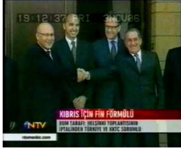
Resim 8. (3 Kasım 2006 NTV Anahaber Bülteni)

Resim 8’de KKTC Cumhurbaşkanı Mehmet Ali Talat ile Rum tarafı yetkilisi Tasos Papadopoulos’un ayakta tokalaşma görüntüleri yer almaktadır. Haber içeriğinde bu görüntüde yer alan kişilerin taraf olarak birbirlerini suçladıkları anlatılırken, görüntüde tam tersi bir ortam yansıtılmaktadır. Haberde Papadopoulos’un adı açık şekilde verilmek yerine “Rum tarafı” olarak geçmektedir. Görüntüde Talat ile Papadopoulos’un tokalaşmasının ekrana yansıtılması ile bir yanılsama ortamı yaratılmaktadır. Nitekim haber içeriğinde Kıbrıs ve Rum kesiminin aralarındaki gerginlik anlatılırken, görüntüde ise adı geçen tarafların mutlu görüntüleri yer almaktadır. Bu bağlamda haberin özellikle söyleminde verilen mesaj ile anlatının verildiği öykü arasındaki anlamın çeliştiği anlaşılmaktadır. Haberin anlatı öyküsünde incelenen görüntülerden yola çıkarak içerikte verilen bilgiler ile görüntüler arasında bir fark olduğunu söylemek mümkündür.