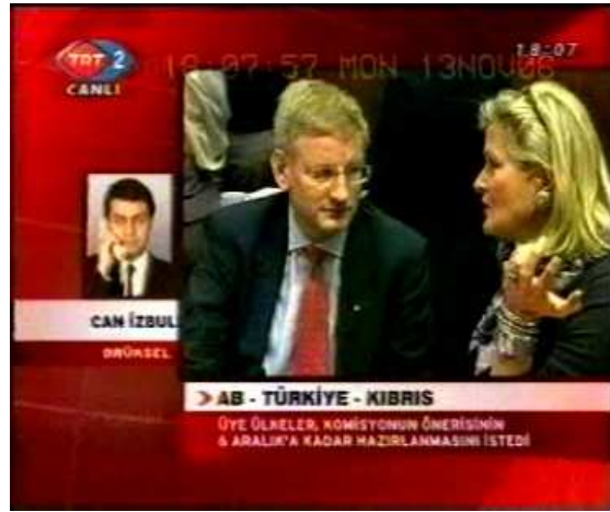
Resim 30. (13 Kasım 2006 TRT 2 Anahaber Bülteni)

13 Kasım 2006 tarihinde TRT 2’de verilen ve Resim 30’da yer alan görüntüye bakıldığında habere konu olan dışişleri bakanlarının karşılıklı konuşmaları hemen bizim yanı başımızda yapılıyormuş gibi sunulmaktadır. Böylece görüntüdeki kişilerin sanki hemen izleyicinin karşısındaymış hissi uyandırılmış ve izleyicinin görüntünün gerçekliğini kabul etmesi sağlanmıştır. Dolayısıyla izleyici haberin içine çekilmekte ve habere dahil edilmektedir. Normal açının kullanılması ile de izleyici ve habere konu olan görüntü arasındaki etkileşim güçlendirilmektedir.