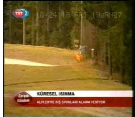
Resim 41. (19 Ocak 2007 TRT 2 Anahaber Bülteni)