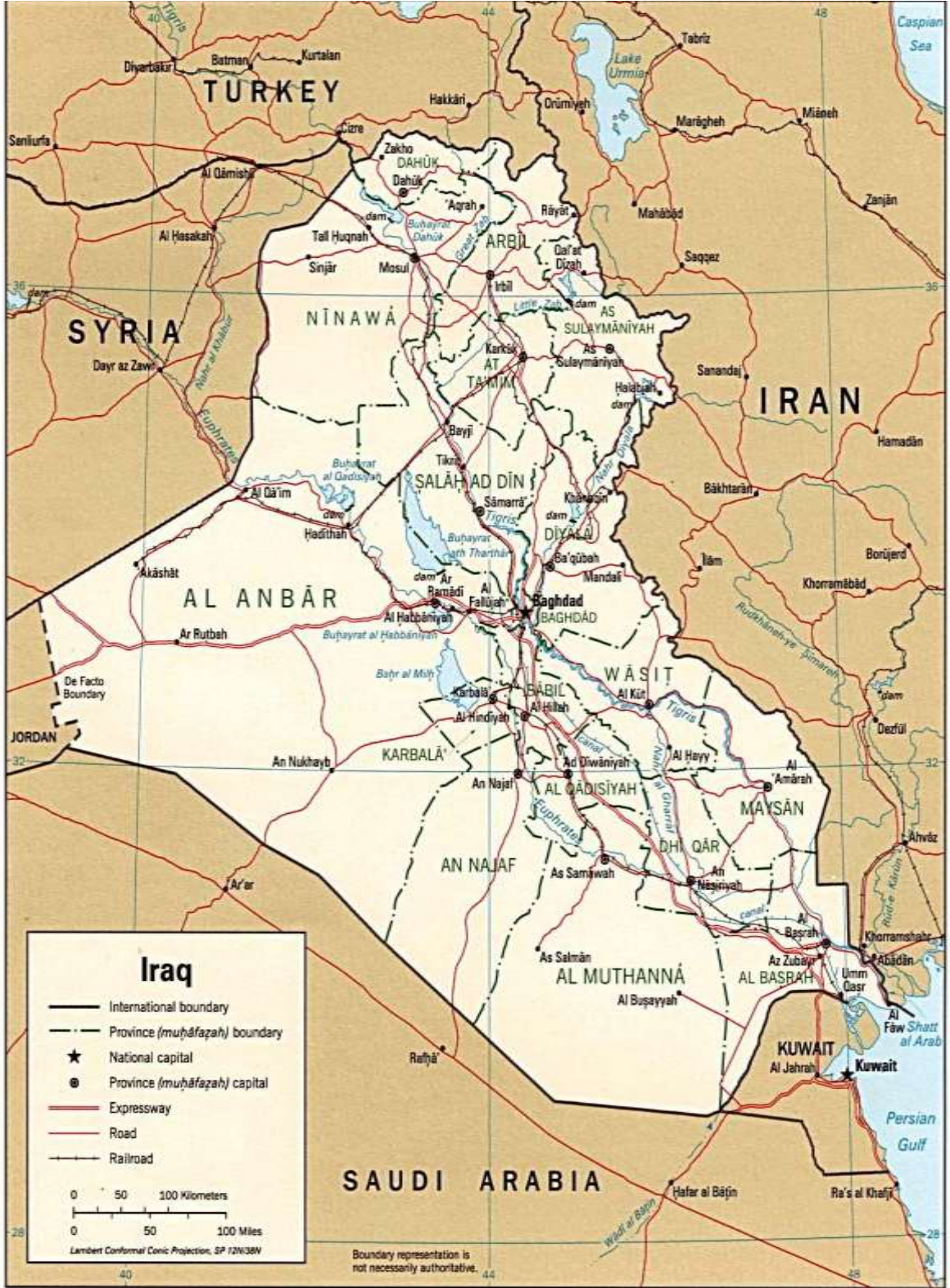
Şekil 1. Ortadoğu Ülkeleri