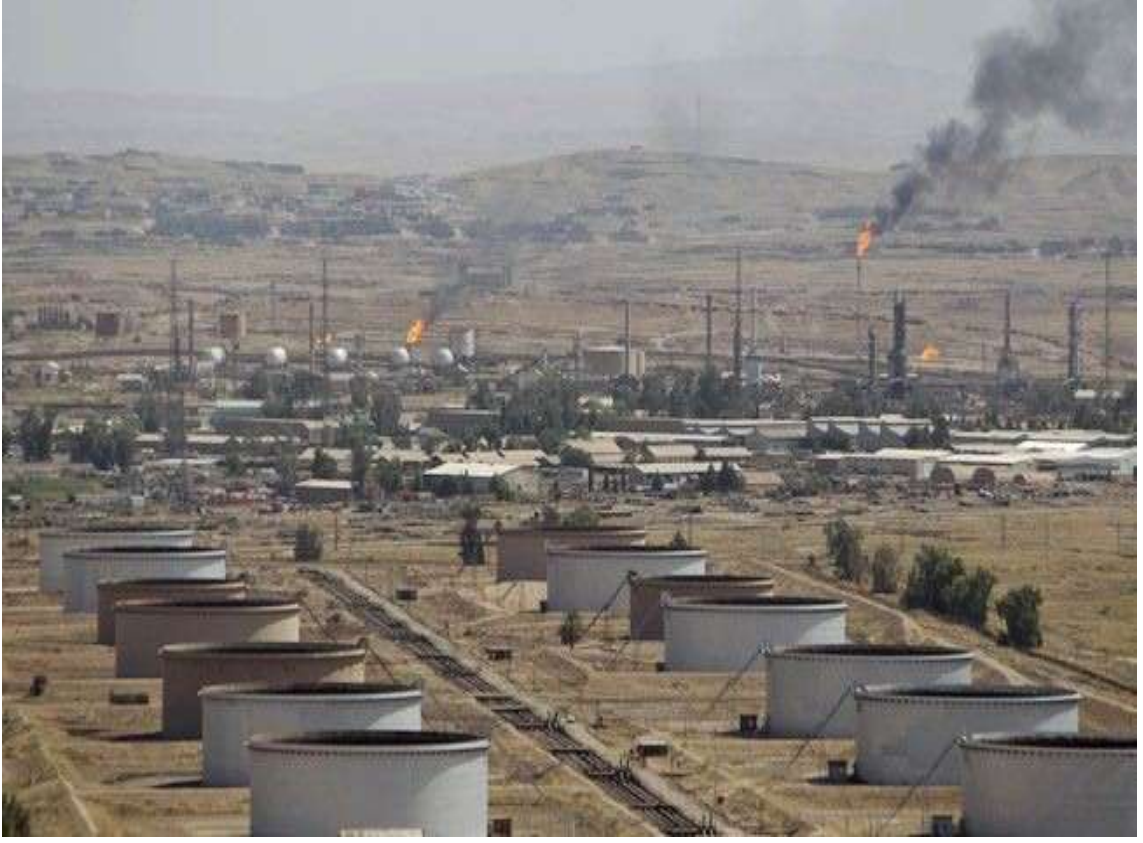
Şekil 4. Petrol Doğalgaz Üretimi