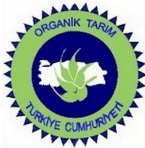
Şekil – 1 Türkiye Cumhuriyeti Organik Tarım Logosu

Tüm bu yükümlülüklerin yer aldığı ve açıklandığı yasa olan Organik Tarım Kanunu çalışmanın sonunda EK – 2’de yer almaktadır.