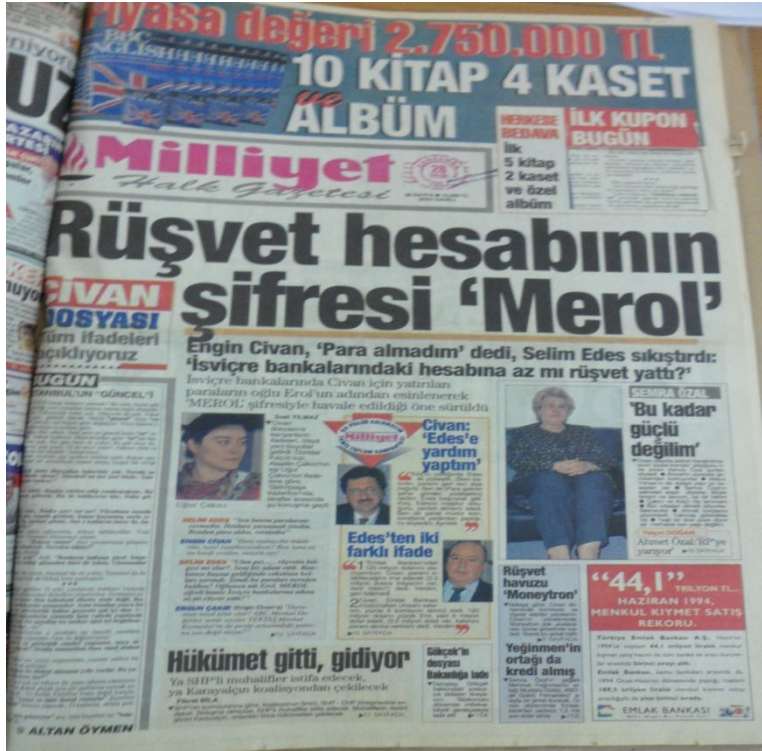
Ek 12. Milliyet, 28.09.2004