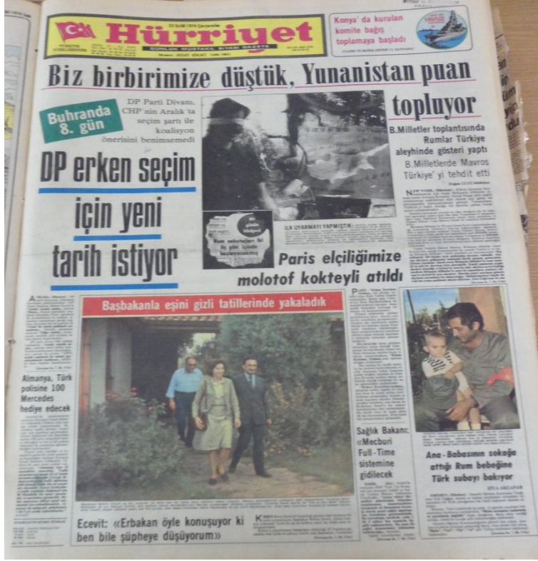
Ek 6. Hürriyet, 28.09.1984