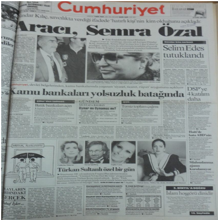
Ek 4. Cumhuriyet, 27.09.2004