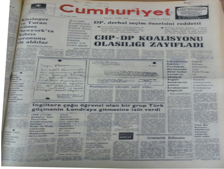
Ek 2. Cumhuriyet, 29.09.1984