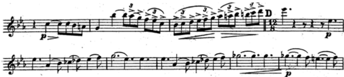
Resim 14. Vieuxtemps, 4. Keman Konçertosu, 2. bölüm, 28. ve 36. ölçüler arası.

28. ölçüye piano nüansında ve arşenin uca yakın orta kısmında başlanmalıdır. 29. ölçüye gelindiğinde sforzando aksanları vermek için sağ elin işaret armağını bastırmak gerekir. 31. ölçüde tekrar 12/8'lik tema gelir, piano nüansıyla başlayan temanın temposu giderek hızlandırılır. 35. ölçüdeki crescendo forte nüansına kadar getirilmeli, 36. ölçüdeki piano, subito olmalıdır (Resim 14).