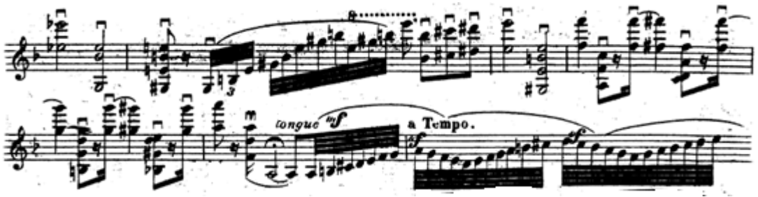
Resim 10. Vieuxtemps, 4. Keman Konçertosu, 1. bölüm, 151.-157. ölçüler arası.

156. ölçüdeki puandorga kadar accelerando yapılmalıdır (Resim 10).