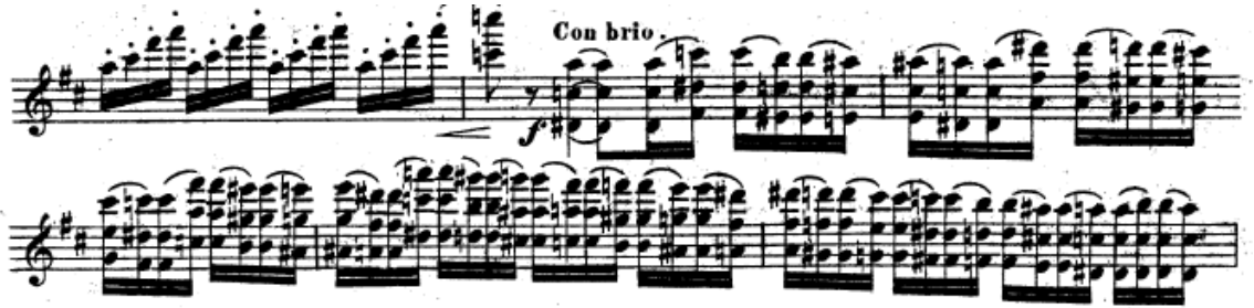
Resim 27. Vieuxtemps, 4. Keman Konçertosu, 4. bölüm, 134.-139. ölçüler arası.

135-139. ölçüler arasında gelen bağlı akorlar içeren pasajda da daha önce belirtilen akor çalışmaları yapılır. Bağırsız çalışarak temiz bir entonasyon yakaladıktan sonra iki bağlı, dört bağlı ve noktali ritimlerden oluşan çalışmalar yapılmalıdır (Resim 27).