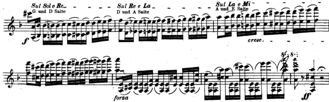
Resim 8. Vieuxtemps, 4. Keman Konçertosu, 1. bölüm, 132-138 ölçüler arası.

132. ölçüde gelen oktavlar tempoda ve temiz çalınmalıdır. 134. ölçüde gelen crescendo arşeyi genişleterek yapılmalıdır. 136. ölçüde gelen çift sesler forse edilerek çalınmalı ve tel atlamalarında sağ dirseğin açısı doğru ayarlanarak arşenin diğer tele değmemesi sağlanmalıdır (Resim 8).