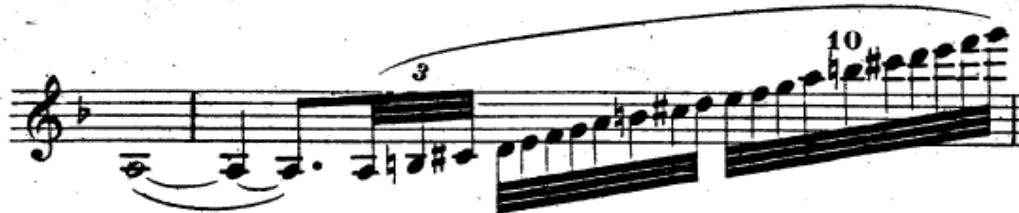
Resim 2. Vieuxtemps, 4. Keman Konçertosu, 1. bölüm, 82-83. ölçüler.

82. ölçüdeki uzun sesin ardından gelen gam öncelikle ayrı arşelerle çalışılmalı, üçleme, sekizleme ve onlamalar doğru tartımda olmalıdır (Resim 2).