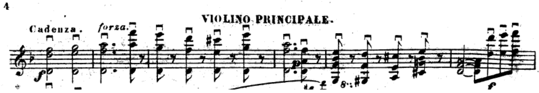
Resim 9. Vieuxtemps, 4. Keman Konçertosu, 1. bölüm, 139-144 ölçüler arası.

156. ölçüdeki puandorga kadar accelerando yapılmalıdır (Resim 10).