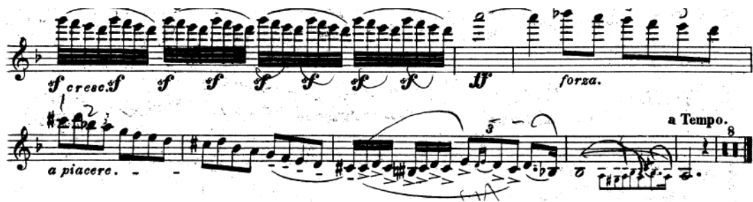
Resim 11. Vieuxtemps, 4. Keman Konçertosu, 1. bölüm, 159-173. ölçüler arası.

159. ölçüde başlayan hızlı pasajda sforzando 'ların sağ el işaret parmağından uygulanacak baskıyla ve sol el yardımıyla yapılması tavsiye edilir. Bahsi geçen pasajın temposu yavaştan hızlıya doğru gitmelidir (Resim 11).