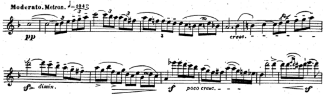
Resim 7. Vieuxtemps, 4. Keman Konçertosu, 1. bölüm, 120-131 ölçüler arası.

132. ölçüde gelen oktavlar tempoda ve temiz çalınmalıdır. 134. ölçüde gelen crescendo arşeyi genişleterek yapılmalıdır. 136. ölçüde gelen çift sesler forse edilerek çalınmalı ve tel atlamalarında sağ dirseğin açısı doğru ayarlanarak arşenin diğer tele değmemesi sağlanmalıdır (Resim 8).