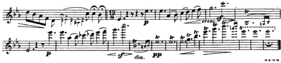
Resim 17. Vieuxtemps, 4. Keman Konçertosu, 2. bölüm, 75-90 ölçüler arası.

77. ölçüde keman iki ölçü boyunca solodur. 83. ölçüde trillerle başlayan diminuendo sağ eldeki basınç orantılı bir şekilde azaltılarak yapılmalıdır (Resim 17).