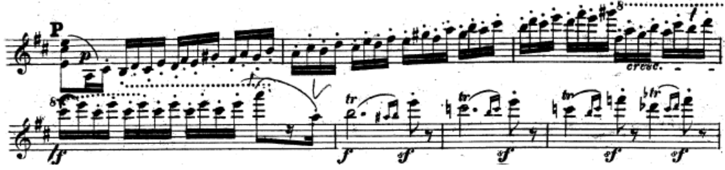
Resim 28. Vieuxtemps, 4. Keman Konçertosu, 4. bölüm, 138-141. ölçüler arası.

139. ölçüde 16'lık tekrar eden notalar sekizlik olarak birer kez çalınarak çalışılmalıdır. Bu sayede tema sol ele öğretilmiş olur. Böylece daha sonra orijinal şekliyle çalındığında bir egzersiz havasından çıkarak, melodi ortaya çıkarılmış olur (Resim 29).