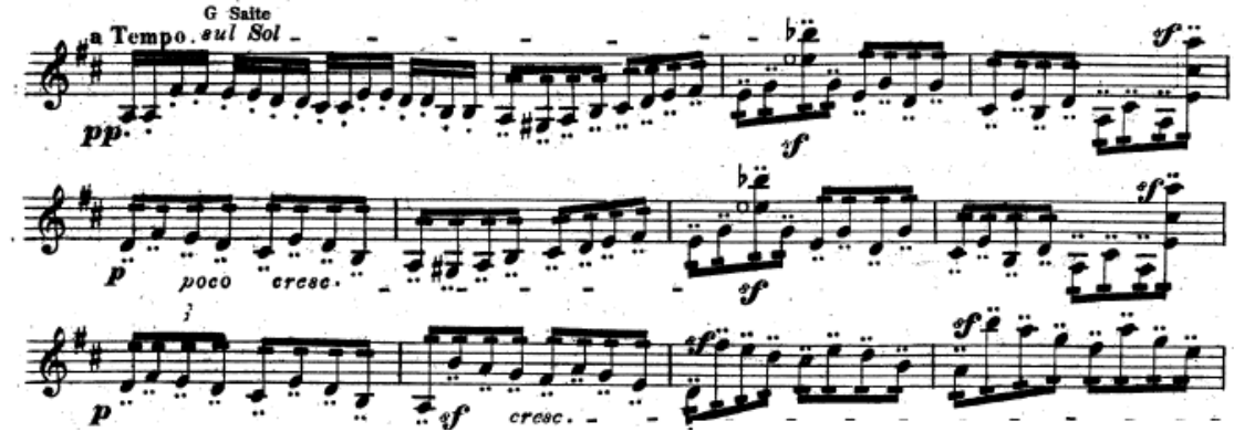
Resim 29. Vieuxtemps, 4. Keman Konçertosu, 4. bölüm, 139. -150. ölçüler arası.

139. ölçüde 16'lık tekrar eden notalar sekizlik olarak birer kez çalınarak çalışılmalıdır. Bu sayede tema sol ele öğretilmiş olur. Böylece daha sonra orijinal şekliyle çalındığında bir egzersiz havasından çıkarak, melodi ortaya çıkarılmış olur (Resim 29).