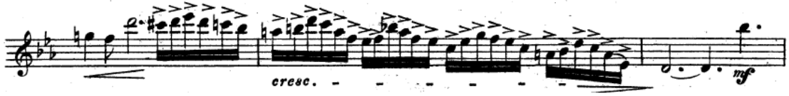
Resim 15. Vieuxtemps, 4. Keman Konçertosu, 2. bölüm, 37. ve 39. ölçüler arası.

61. ölçüdeki triller sık aralıklarla yapılmamalıdır. Arşe değiştirilirken trilin devamlılığı sağlanmalıdır (Resim 16).