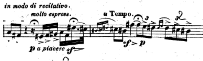
Resim 6. Vieuxtemps, 4. Keman Konçertosu, 1. bölüm, 112.-113. ölçüler.

Üçlemelerin başındaki puandorg çok uzun tutmadan yapılmalıdır. Aksanlar hızlı bir vibrato ile belirtilip pianissimo 'ya kadar hızlı bir decrescendo ile düşürülmelidir (Resim 6).