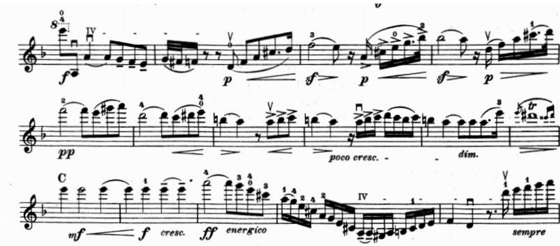
Resim 4. Vieuxtemps, 4. Keman Konçertosu, 1. bölüm. 92.-106. ölçüler arası.

96. ölçüden itibaren 8 ölçü boyunca yeni bir tema gelir. Bu tema pianissimo nüansında geniş ve durmayan bir vibratoyla çalınmalı, arşe ve pozisyon değişimleri belli edilmemelidir. 96. ölçüde gelen melodi 98. ve 99. ölçülerde de kendisini tekrarlar. Bu tekrarlayan melodi artiküle bir şekilde çalınmalıdır. 99. ölçünün 2. zamanına kadar crescendonun devam ettirilmesi gerekir. C harfinden bir önce gelen tril diminuendo ile beraber ritmik bir şekilde çalınmalıdır. 102. ölçüde orkestra melodiyi alır ve keman iki ölçü boyunca orkestraya eşlik eder. Bu iki ölçü boyunca mezzoforte 'den büyük bir crescendo ile fortissimo nüansına gelinmelidir (Resim 4).