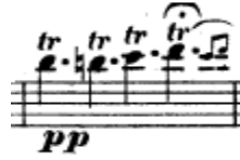
Resim 16. Vieuxtemps, 4. Keman Konçertosu, 2. bölüm, 61. ölçü.

61. ölçüdeki triller sık aralıklarla yapılmamalıdır. Arşe değiştirilirken trilin devamlılığı sağlanmalıdır (Resim 16).