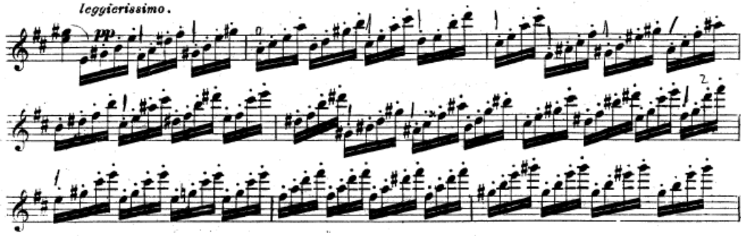
Resim 26. Vieuxtemps, 4. Keman Konçertosu, 4. bölüm, 124.-132. ölçüler arası.

ve son olarak da spiccato şeklinde çalışılmalıdır. Aralarda duraksama yaparak da çalışılmalı ama martele arşe stili kullanılmalıdır. Bu çalışma ile sağ ele tel değişim zamanları doğru şekilde öğretilmelidir (Resim 26).