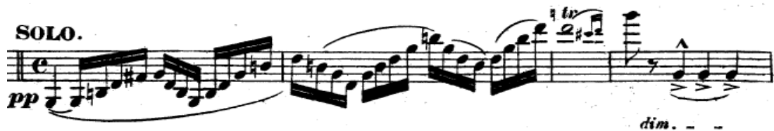
Resim 12. Vieuxtemps, 4. Keman Konçertosu, 2. bölüm, 12.-15. ölçüler arası.

2. bölüm müzikal cümleme açısından oldukça zor bir bölümdür. Bölüm boyunca notaların kesintisiz ve bağlı olarak birbirini izlemesi müzik cümlelerin bölünmemesi açısından gereklidir. Kemandan çıkan sesin yani sonoritenin koyu olması tercih edilmelidir. Bunun için sağ elin ağırlığı iyi ayarlanmalı ve arşenin telden çıkmamasına özen gösterilmelidir. Vibrato ise eşit ve yavaş olmalı ama crescendo 'larda sıkılaştırılmalıdır. Flesh'in dediği gibi "Yorumda artistik bitiş doğru yapılan vibrato olmadan imkânsızdır." 30 Aver ise "...nüanslara uygun yapılan vibrato bir kemancının en önemli zenginliğidir." 31 diyerek vibratonun önemini belirtmiştir. Solo partinin birinci ölçüsünde giriş cümlesi, arşenin titrememesi için arşenin ucunda, tuşeye yakın, arşenin tahtası tuşeye doğru yatık ve yarım kıl kullanılarak çalınmalıdır. Solonun başlangıcından itibaren üçüncü ölçüdeki tril yavaştan başlayıp hızlandırılmalı, ilk cümlecüğün bittiği 15. ölçüdeki ilk sekizlik sol sesi ise yumuşak bir şekilde eşit ve yavaş bir vibrato ile yapılmalıdır. Cümle bitışı, arşeyi dikkatli bir şekilde kolu yavaşça tellerden ayırarak yapılmalıdır. 15. ölçüdeki aksanla başlayan sol sesini oluşturan 3 adet dörtlük nota sol el vibrato aksanıyla vurgulanarak giderek ağırlaşmalı ve diminuendo yapılmalıdır. Bu çalış 16. ölçüdeki " con espressivo " olarak başlayan temaya etkili bir hazırlık sağlar. (Resim 12).