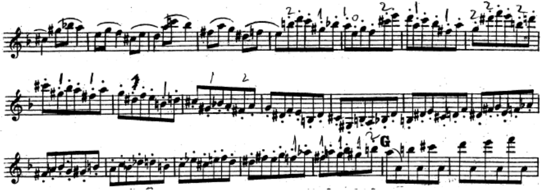
Resim 20. Vieuxtemps, 4. Keman Konçertosu, 3. bölüm, 108.-127. ölçüler arası.

129. ölçüdeki tel değiştirme gerektiren pasajda melodik çizgiyi oluşturan sesler daha fazla önem verilerek ve giderek arşeyi büyüterek çalınmalıdır. Bu pasajda melodik çizgiye eşlik eden boş teldeki la sesi ise sürekli olarak piano nüansıyla çalınmalıdır. 133. ölçüde gelen doğuşkanların net çıkması için 1. parmağın temiz basılması, arşenin tüm kıllarının tele değmesi, köprüye yakın olması ve hızlı bir şekilde çekilmesi gerekir (Resim 21).