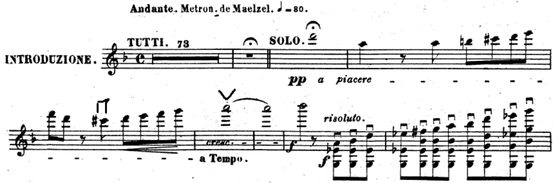
Resim 1. Vieuxtemps, 4. Keman Konçertosu, 1. bölüm, 1-81. ölçüler arası.

bölünerek, yani kırarak çalınmalıdır. Bu sayede tiz seslerdeki akor değişimleri daha net duyurulabilir. 81. ölçüde gelen beş tane tam beşli aralık (mi-si ve sol-re) tele parmak ucuyla değil, birinci boğumun tüm yüzeyinin tellere temas ettirilmesi ile çalınmalıdır (Resim 1).