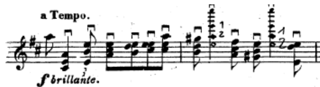
Resim 25. Vieuxtemps, 4. Keman Konçertosu, 4. bölüm, 116.-117. ölçüler arası.

116. ölçüdeki çekerek çalınan akorların öncelikle boş tel üzerinde çalışılması gerekir. Arşeyi telin üstüne koyarken sol elde akoru kuran parmakların önceden telde hazır bir pozisyon almış olması gerekir. Arşe köprüye paralel olmalı ve dipten başlamalıdır. Daha sonra arşe orta tele bastırarak çekilir. Akorlar aralarda duraksama yaparak çalışılır ve sol ele gerekli hızlandırma kazandırılır. Akorları hem iterek hem çekerek çalışmak da başka bir çalışma yöntemidir. Bu çalışma sonrası sadece çekerek çalmak daha kolay gelecektir. Çünkü çekerek çalışta yukarıda kalan kolun ağırlığından güç alınır ancak iterek akor çalınırken yerçekimine karşı hareket etmek daha zordur (Resim 25).