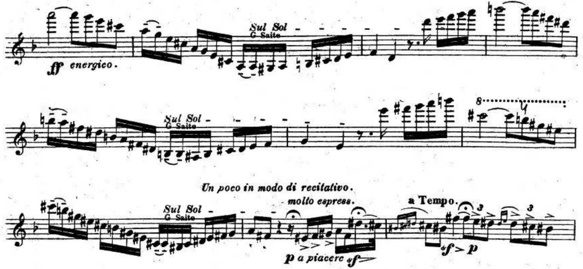
Resim 5. Vieuxtemps, 4. Keman Konçertosu, 1. bölüm, 104.-113. ölçüler arası.

ikinci zamanda gelen sforzando çok belirgin bir biçimde kendini hissettirmelidir. (Resim 5).