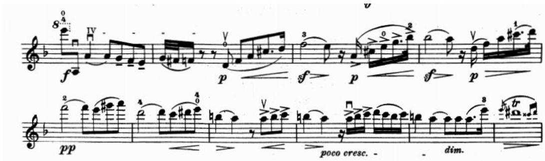
Resim 3. Vieuxtemps, 4. Keman Konçertosu, 1. bölüm, 92-101 ölçüler arası.

96. ölçüden itibaren 8 ölçü boyunca yeni bir tema gelir. Bu tema pianissimo nüansında geniş ve durmayan bir vibratoyla çalınmalı, arşe ve pozisyon değişimleri belli edilmemelidir. 96. ölçüde gelen melodi 98. ve 99. ölçülerde de kendisini tekrarlar. Bu tekrarlayan melodi artiküle bir şekilde çalınmalıdır. 99. ölçünün 2. zamanına kadar crescendonun devam ettirilmesi gerekir. C harfinden bir önce gelen tril diminuendo ile beraber ritmik bir şekilde çalınmalıdır. 102. ölçüde orkestra melodiyi alır ve keman iki ölçü boyunca orkestraya eşlik eder. Bu iki ölçü boyunca mezzoforte 'den büyük bir crescendo ile fortissimo nüansına gelinmelidir (Resim 4).