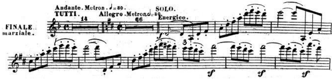
Resim 24. Vieuxtemps, 4. Keman Konçertosu, 4. bölüm, 1.-89. ölçüler arası.

Andante başlayan 13 ölçülük bir girişi olan bölüm 14. ölçüde allegro tempoda devam eder. 81. ölçüde başlayan keman solo için besteci energico yani enerjik terimini kullanmıştır (Resim 24).