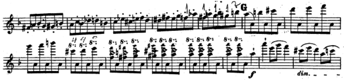
Resim 21. Vieuxtemps, 4. Keman Konçertosu, 3. bölüm, 124-138. ölçüler arası.

129. ölçüdeki tel değiştirme gerektiren pasajda melodik çizgiyi oluşturan sesler daha fazla önem verilerek ve giderek arşeyi büyüterek çalınmalıdır. Bu pasajda melodik çizgiye eşlik eden boş teldeki la sesi ise sürekli olarak piano nüansıyla çalınmalıdır. 133. ölçüde gelen doğuşkanların net çıkması için 1. parmağın temiz basılması, arşenin tüm kıllarının tele değmesi, köprüye yakın olması ve hızlı bir şekilde çekilmesi gerekir (Resim 21).