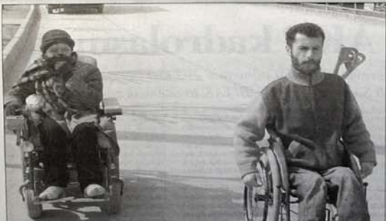
Sivil Toplum Örgütleri, 1 Temmuz'da yürürlüğe giren Özürlüler Yasası hazırlanırken kendilerinin yeteri kadar faydalanmadıklarını belirttiler.

nağı daraldı. Özürlülerin toplu taşım araçlarından ücretsiz yararlanmasını sağlayan maddede belediyeler yasanın dan çıkarıldı, özürlülerin bu hakkı kullanması belediyelerin lütfuna terk edildi. Muhtak aylığı konusunda da adeta kimsenin yararlanamayacağı şekilde düzenlendi yasa. Ayrıca 67 milyon olan özürlü aylığının yararlanıncı olacak. Ev, tükümlü kadroları ilâm aylığı ve muhtak masrafları hak-sız vere alıkları gerekçesiyle istenen geri ödeme ve icra takip-lenme af sağlandı.