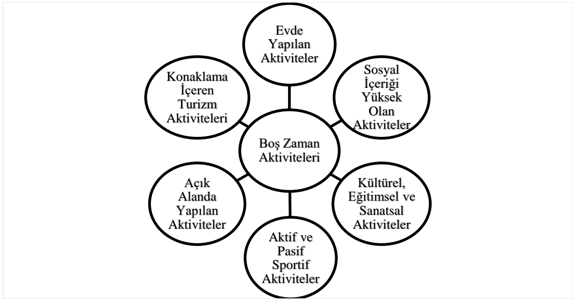
Şekil 2. Boş Zaman Aktivite Türleri

Boud-Bovy ve Lawson (2002: 1), boş zaman aktivite türlerini genel başlıklar altında sınıflandırmıştır. Bu sınıflandırma, Şekil 2’de gösterildiği gibidir. Boud-Bovy ve Lawson (2002: 1) tarafından boş zaman aktivite türlerine yönelik yapılan bu sınıflandırmanın, diğer araştırmacılar (Cordes ve İbrahim, 1999; Hazar, 2009; Tribe, 1995) tarafından yapılan sınıflandırmalara benzer olmakla birlikte, söz konusu sınıflandırmaları da kapsadığı görülmektedir. Bu nedenle bu tez çalışmasında, A tipi ve B tipi kişilik özelliklerine sahip bireylerin hangi boş zaman aktivitelerini tercih ettiğini ortaya çıkarmak için Boud-Bovy ve Lawson (2002) tarafından yapılan aktivite türleri sınıflandırmasından yararlanılmıştır.