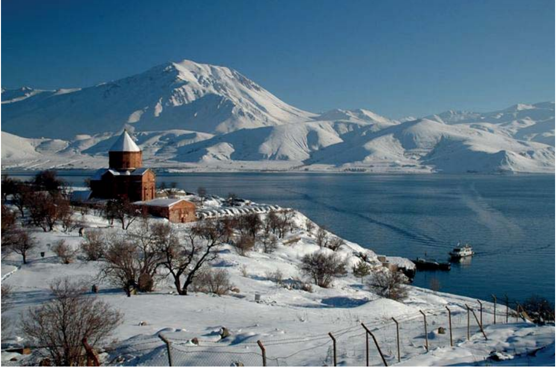
Görsel 3.6. Artos Dağı