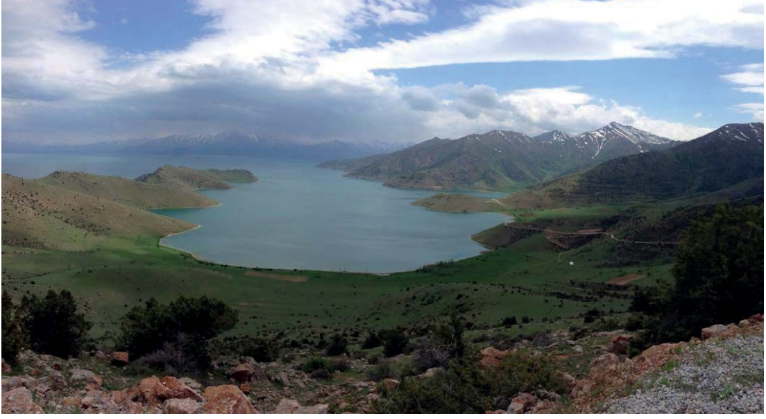
Görsel 3.4. Van Gölü Kıyısında Yer Alan Bir Koy