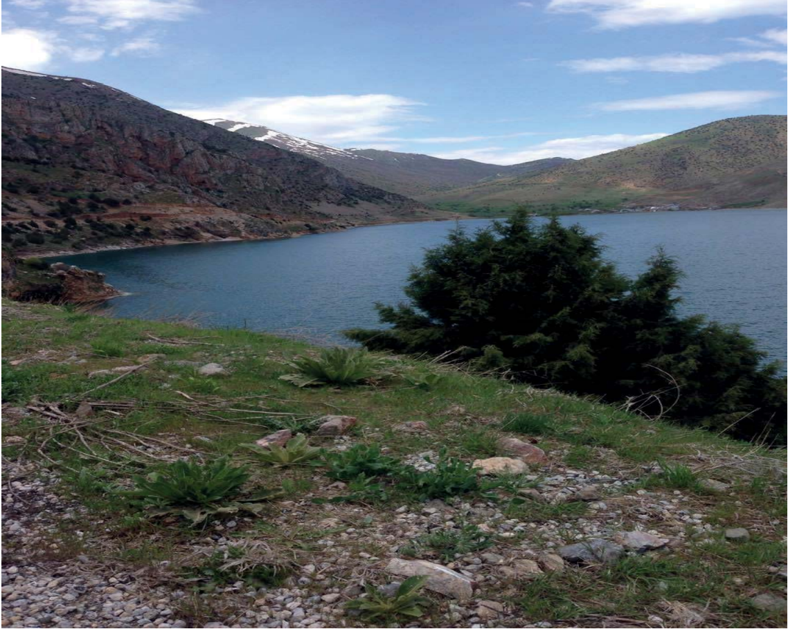
Görsel 3.8. İnköy

günümüzde terkedilmiş olarak bulunur. Bu köy ve civarındaki koylar arkasındaki arazi hafif bir meyille yükselmektedir. Bir zamanlar Van'ın önemli tarımsal ürünlerinden biri olan üzüm bağları, bu koyun yamaçlarında yabani fıstık ağaçlarına dolanmış asmalar halinde mevsimi geldiğinde halen üzüm vermektedir. Arazinin ortasındaki küçük kilise yapısı ve çevredeki eski yapı temelleri koyun zamanında bir yaşam alanı olduğuna işaret etmektedir.