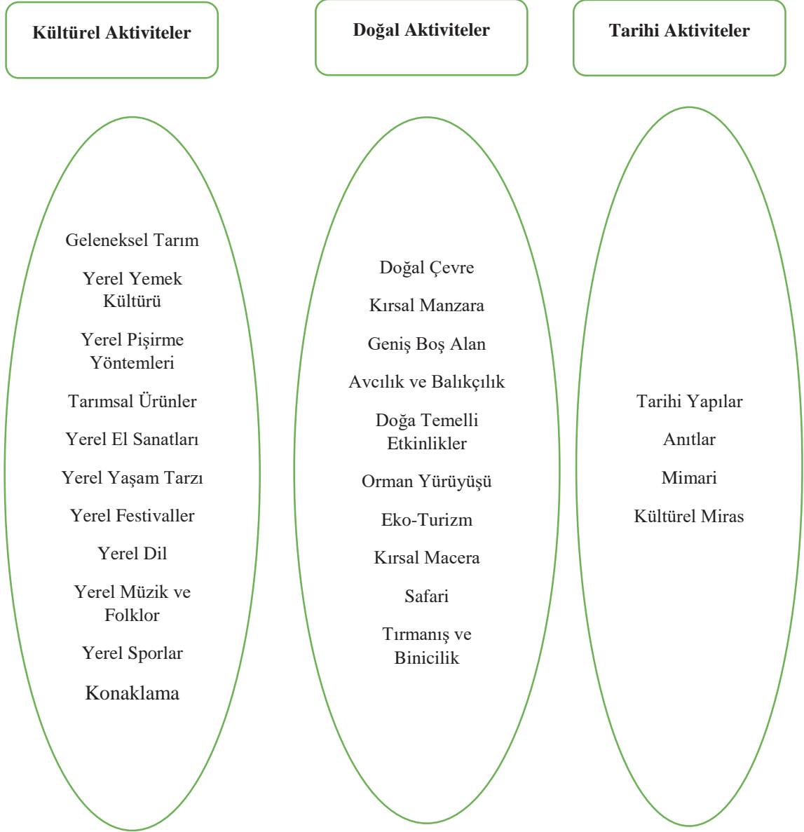
Şekil 2.2. Kırsal Turizm Aktivitelerinin Sınıflandırılması