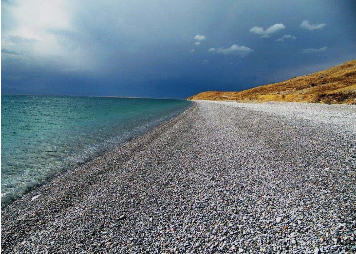
Görsel 3.9. Gevaş'ta Bir Plaj

Gevaş, koy ve plajlar bakımından oldukça zengin bir yöredir. Bu yörede yer alan, Grand Deniz Sahili, DSİ ve Kızılay Kampı Sahili, Akdamar Adası Karşısı Sahili, İskirt Köyü Sahili ve Ağın Sahili'nin yanı sıra henüz isimlendirilmemiş birçok plaj yer almaktadır. Yukarıda belirtilen plajlar üzerinde çeşitli işletmeler kurulmuş, diğer isimlendirilmemiş plajlar üzerinde ise herhangi bir işletme kurulmamıştır. Bu durumun hem olumlu hem olumsuz tarafları vardır. Olumlu tarafı, bu plajların el değmemiş bir şekilde doğal halini korumuş ve temiz kalmıştır. Olumsuz tarafı ise, bu plajlar için gerekli tanıtımlar ve yatırımlar yapılmadığı için, yerel halka ve ziyaretçilere hizmet vermede eksik kalmaktadır. Görsel 3.9'da Gevaş'ta yer alan, çakılları ve temizliğiyle öne çıkan bir plaj yer almaktadır.