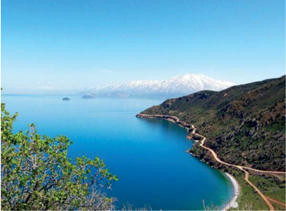
Görsel 3.10. Gevaş'ta Bir Koy

Gevaş'ta yer alan plajların yanı sıra bu plajların yer aldığı veya herhangi bir plaja sahip olmayan birçok koy yer almaktadır. Özellikle Göründü, Altınsaç, İnköy ve Ağın köylerini bulunduğu bölgede, doğal güzelliklere sahip birçok koy mevcuttur. Bu koylar hem manzara bakımından hem kamp alanı bakımından oldukça ilgi çekicidir. Görsel 3.10'da, bu bölgedeki koylardan biri görülmektedir.