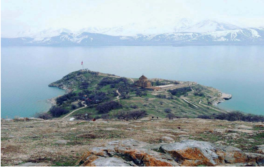
Görsel 3.5. Akdamar Adası