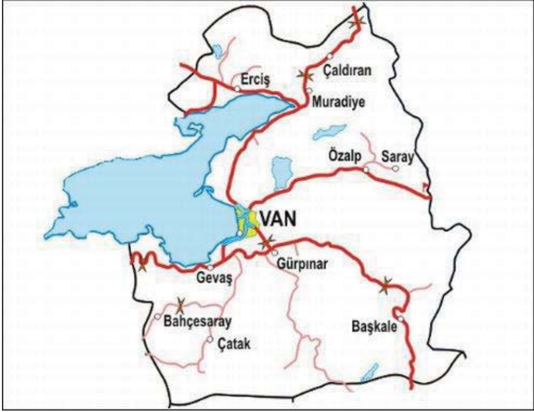
Görsel 3.2. Gevaş İlçesinin Van İli Sınırlarındaki Konumu