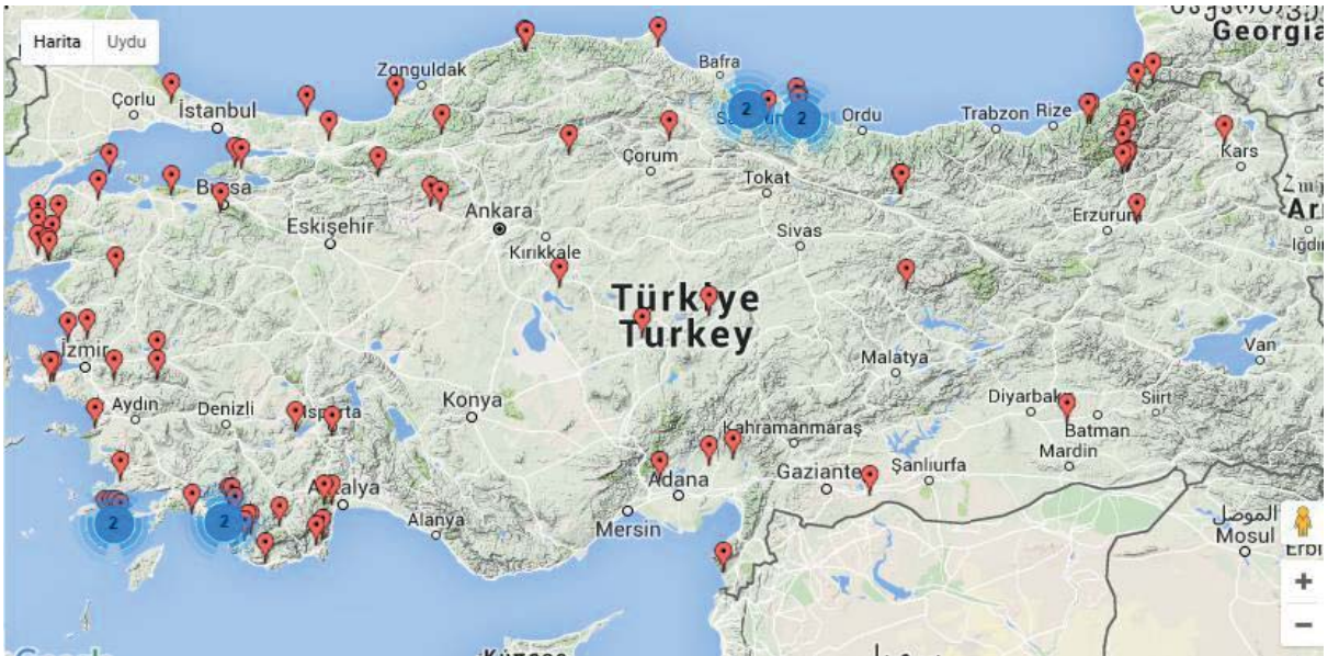
Görsel 2.1. Tatuta Haritası

Derneğin internet sayfasında yer alan harita yardımıyla çiftliklerin bulunduğu bölgeler, ziyaret dönemleri ve ziyaret türü belirlenerek başvuru yapma olanağı sağlanmaktadır. Sayfada TATUTA sisteminde yer alan ekolojik çiftliklerin konum, ulaşım, iletişim ve konaklama gibi özelliklerinin yanı sıra mevsimlere ve hava şartlarına göre çiftlikte yardıma gereksinim duyulan işler hakkında da ayrıntılı bilgiler yer almaktadır. Sayfada ayrıca TATUTA'nın yürütücüsü Buğday Derneği ile birlikte, eğitim alan çiftliklerin, bu çiftliklere konuk olacak gönüllü ve ziyaretçilerin sorumluluklarına da yer verilmektedir. Türkiye'de uygulama bünyesinde yer alan çiftliklerin gösterildiği harita Görsel 2.1'de görülmektedir.