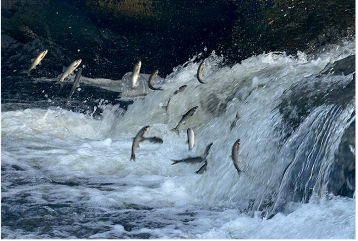
Görsel 3.14. İnci Kefali