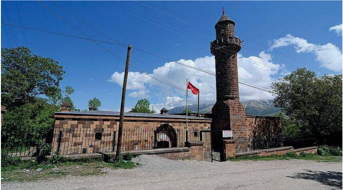
Görsel 3.16. İzzettin Şir Camii

Gevaş ilçesinde bulunan caminin üzerinde inşasına ilişkin herhangi bir kitabe yer almamaktadır. Van ve Hakkari Hakimi İzzettin Şir tarafından yaptırıldığı kabul edilmekte ve 14-15. yüzyıllara ait bir yapı olduğu düşünülmektedir. Kare planlı bir cami ile, kuzey duvarına bitişik medreseden oluşan yapının batı cephesinin kuzey kesiminde yer alan bir taç kapıdan medrese avlusuna, buradan da ikinci bir kapı ile camiye geçilmektedir. Cami iki sahnı ve mihrap önü kubbelidir. Kuzeyde enine beşik tonozlarla örtülmüş sahnılar bulunmaktadır. Kible duvarının ortasında ise beş kenarlı mihrap nişi bulunmaktadır. Yapı düzgün kesme taş malzeme ile yapılmıştır. Batı cephenin ortasındaki minare ise daha sonraki tarihlerde sonradan eklenmiştir. Görsel 3.16'da İzzeddin Şir Camii görülmektedir.