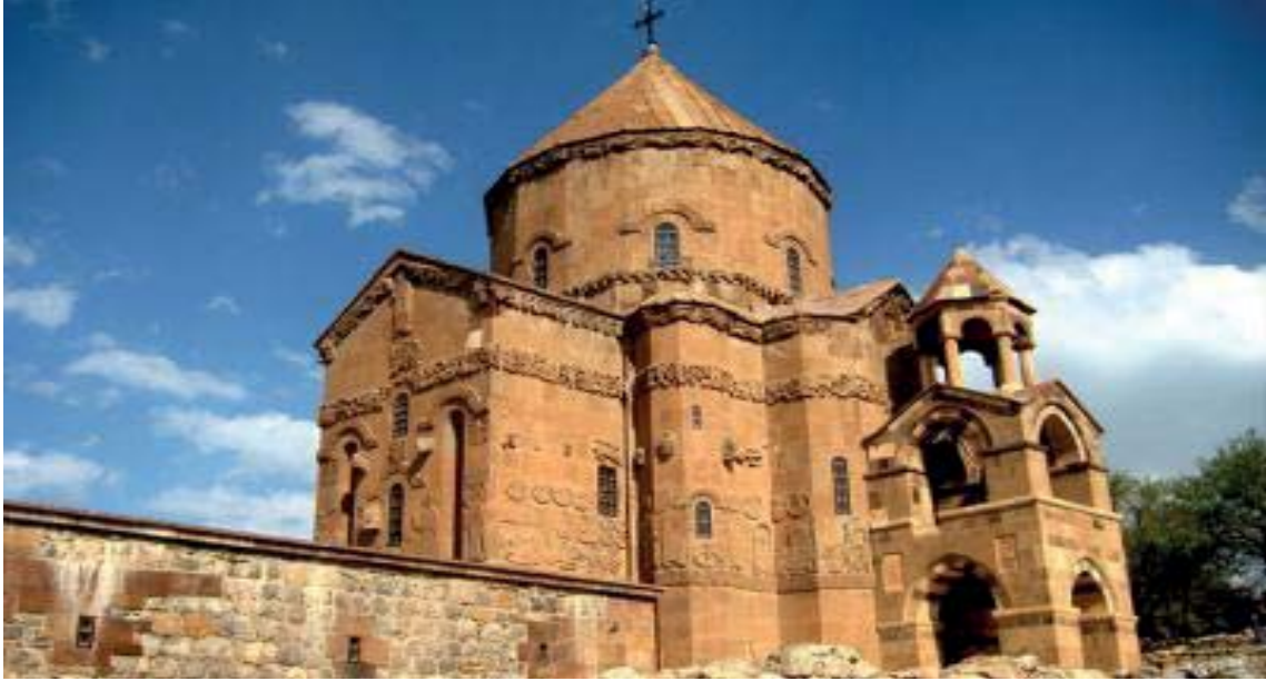
Görsel 3.11. Akdamar Kilisesi

2003). Kilisede asma sarmaşıkları, hayvan figürleri ve çeşitli sanatsal figürleri görmek mümkündür. Kilisenin önemini arttıran başka bir konu ise Orta Asya Türk sanatı etkilerini de üzerinde barındırmasıdır (Umar, 1993). Kilisenin yerel halk tarafından da bilinen "Ah Tamara" efsanesi günümüze kadar ulaşmıştır. Efsane, dönemin papazın kızı Tamara ile sahilde yaşayan bir çoban arasında geçmektedir. Buluşmalarını Akdamar Adası'nın sahilinde sürdüren iki genç, papazın hazırladığı tuzak neticesinde buluşma işareti olan ışığın yerinin değiştirilmesi sonucu boğulmak üzere olan çoban gencin "Ah Tamara" diye çığlık atarak Van Gölü'nde boğulması sonucu adanın adı "Ah Tamara" olur (Van İl Kültür ve Turizm Müdürlüğü, 2006). Akdamar Kilise'nin görüntüsü Görsel 3.11'de yer almaktadır.