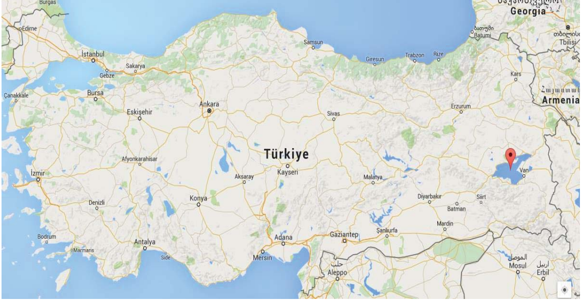
Görsel 3.3. Van Gölü'nün Türkiye Haritasındaki Yeri

Adası olmak üzere dört önemli adaya sahiptir. Bu adalardan en önemlisi ise üzerinde tarihi bir kilise olan Akdamar Adası'dır.