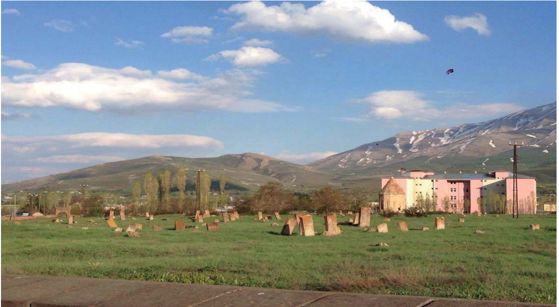
Görsel 3.15. Halime Hatun Kümbeti ve Selçuklu Mezarlığı

Van'ın Gevaş ilçesindeki Selçuklu Mezarlığı'nın doğusunda yer alan kümbet, kare dıştan piramidal külâhla örtülü iki katlı bir yapıdır. Giriş kapısı üzerinde yer alan kitabesine göre Melik İzzeddin tarafından 1335 tarihinde, kızı Halime Hatun için yaptırılmıştır (Kültür ve Turizm Bakanlığı, 2007). Ustasının Ahlatlı Pehlivan oğlu Esed olduğu bilinmektedir. Üstten piramidal bir külâhla örtülmüş olan kümbet, düzgün kesme taş malzeme ile yapılmıştır. Gövdenin kuzeyindeki cepheye taç kapı, diğer üç yöne pencereler açılmıştır. Aralardaki yüzeyleri üçgen nişler hareketlendirmektedir. Tüm cephelerde şeritler halinde ve madalyonlar şeklinde bitkisel, geometrik ve yazılardan oluşan süslemelere yer verilmiştir. Sonlar Gevaş Vakıflar Genel Müdürlüğü tarafından restore edilmiştir. Halime Hatun Kümbeti ve Selçuklu Mezarlığı'nın görüntülerinin yer aldığı Görsel 3.15, aşağıdaki görülmektedir.