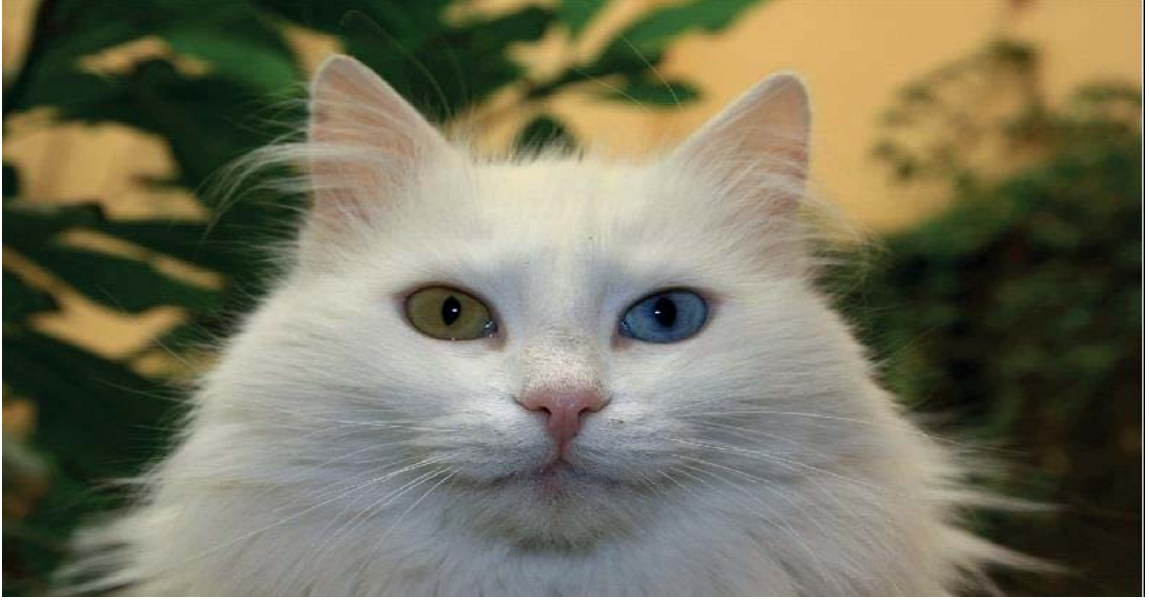
Görsel 3.13. Van Kedisi

Araştırma Merkeziyle temasa geçmektedir. Van Kedisi, Van'ın tescilli bir markası konumundadır. Van Kedisi'nin Van'a ait bir değer olduğu resmi olarak 22.04.2006 tarihinde tescil edilmiştir. Görsel 3.13'te, gözleri birbirinden farklı olan Van Kedisi görülmektedir.