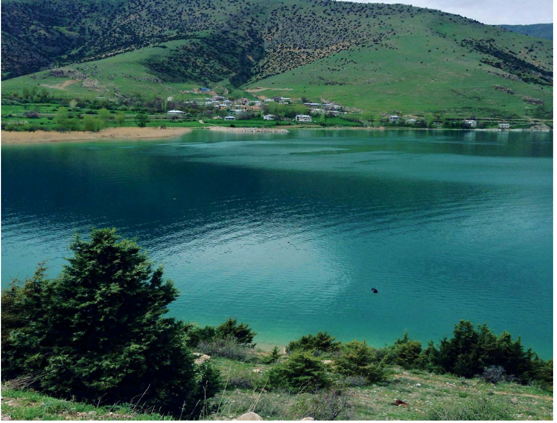
Görsel 3.7. Altınşaç Köyü

Göründü ve Altınşaç köyleriyle aynı bölgede yer İnköy karayolunun sonlandığı köydür. Van Gölü'nün oluşturduğu bir koyda kurulan köyün kendine ait bir iskelesi bulunmaktadır ve yerel halk ulaşımını büyük oranda göl yoluyla yapmaktadır. Karayoluyla ulaşımın oldukça zor olduğu köy, doğal çekicilikleriyle dikkat çekmektedir. Bu köy doğa fotoğrafçıları, sportif amaçlı yürüyüş yapan ve doğayı keşfe çıkan ziyaretçiler için etkileyici bir manzaraya sahiptir. Mavi ve yeşilin aynı anda görüldüğü yörede, pek çok koy ve bu koyları karşılayan birçok dağ bulunmaktadır. İnköy, Van Gölü ve köyün etrafındaki dağlar, Görsel 3.8'de görülmektedir.