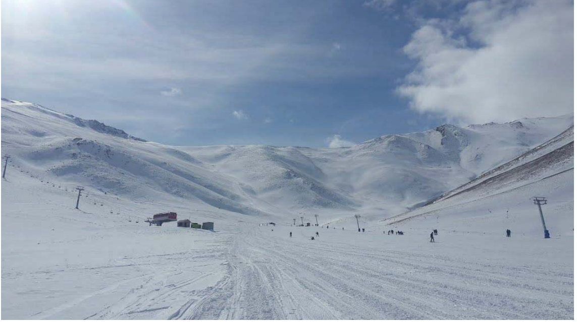
Görsel 3.17. Abalı Kayak Merkezi

biridir. Daha önce 1200 metre olan telesiyej hattı, daha sonra yapılan çalışmalarla beş bin metreye çıkmıştır. Yapılan yatırımlarla Abalı Kayak Merkezi uluslararası organizasyonların yapılabileceği standartlara erişmiştir. Van Gölü manzaralı Abalı Kayak Merkezi, beyazın yanında mavi bir görüntüyü kayak severlere sunmaktadır. Görsel 3.17’de, kayak merkezinin görüntüsü yer almaktadır.