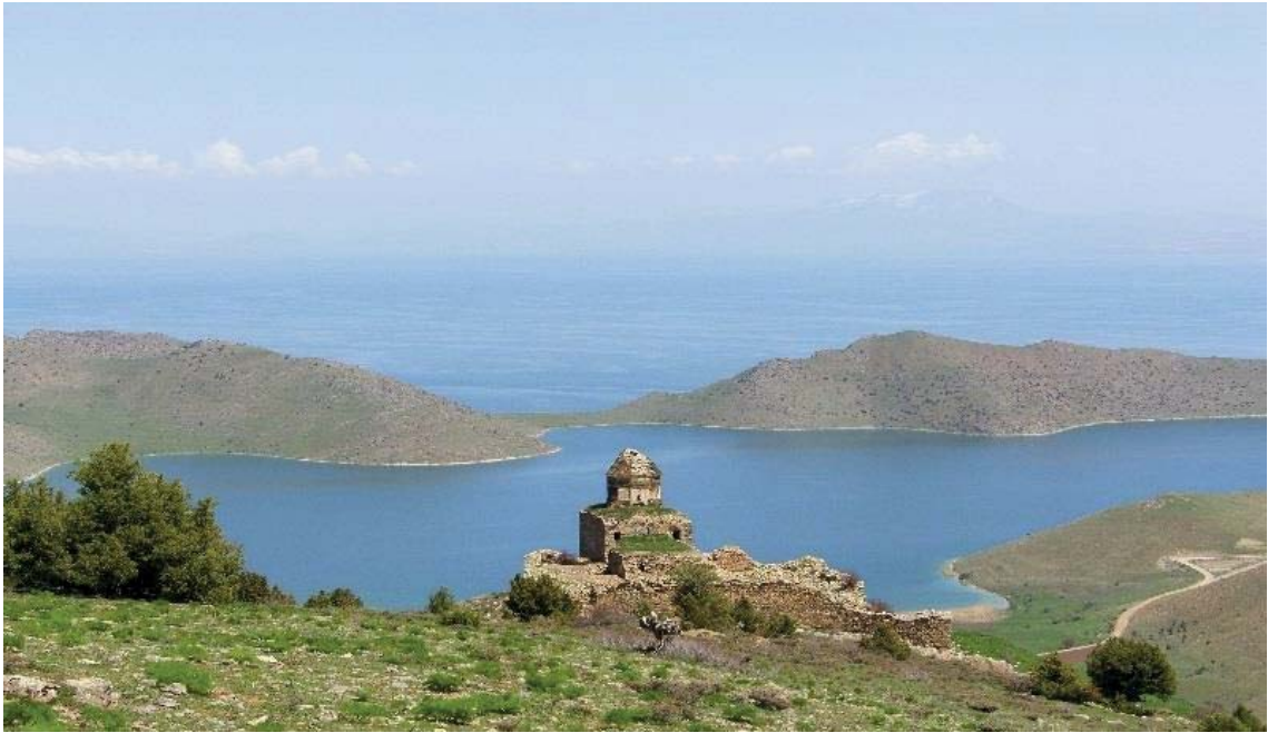
Görsel 3.12. Altınsaç Kilisesi

Altınsaç Kilisesi Van ilinin Gevaş ilçesine bađlı olan Altınsaç Köyü'nde bulunur. Van Gölü manzarasına sahip bir vadi yamacına kurulan kilisenin diđer tarafında ise dađ zirvesi bulunmaktadır. Görsel 3.12, yukarıda tasvir edilen görüntüyü yansıtmaktadır. 13. yüzyıldan daha önce inşa edildiđi düşünölen kilise, 1671 yılında onarılarak tekrar hizmete sunulmuştur. Manastıra ait yapılar yıkılmasına rađmen kilise günümüze oldukça sađlam bir durumda gelmiştir. Bazilika, kubbeli bazilika, merkezi ve karma plan tipe, Van şehrinin genelinde kullanılan diđer dört tip de eklendiđinde sekiz çeşit şemanın dođu Hıristiyan mimarisinde kullanıldıđı görölmüştür (Van İl Kültür ve Turizm Müdürlüğü, 2006).