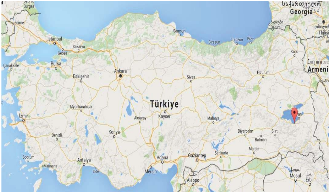
Görsel 3.1. Gevaş İlçesinin Türkiye'deki Coğrafi Konumu

Gevaş, 1548 yılında Osmanlı İmparatorluğu'na katılmış ve 1860 yılında da kaza merkezi olmuştur (Van Valiliği, 1998). İlkçağ kaynaklarında Vastiana, Arap ve Selçuklu kaynaklarında Vustan veya Vestan olarak geçen Gevaş ilçesi, ismini ise yöredeki akarsuyun ilkçağdaki isminden aldığı tahmin edilmektedir (Umar, 1993). Cumhuriyet'in ilk yıllarından 1950'ye kadar 2000 nüfuslu küçük bir yerleşme olan Gevaş, 1950'den sonra göç alarak, nüfusu 10 bini aşan yerel bir merkez konumuna gelmiştir. Gevaş'ın Türkiye'deki coğrafi konumu Görsel 3.1'de gösterilmiştir.