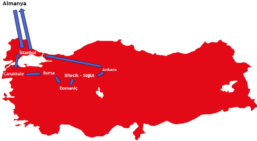
Şekil 1. Almanya Türk Federasyon Türkiye Kültür Gezisi Güzergâhı

süren Türkiye Kültür Gezisi güzergâhında bulunan şehirlerde ziyaret edilecek tarihi ve kültürel yerler, ATF Yönetimi tarafından belirlenip detaylı bilgilerin de yer aldığı bir kitapçık halinde gezi öncesinde katılımcılara dağıtılmıştır. Dokuz gün süren bu gezide, gezi planında yer alan yerler ise gün gün şöyle olmuştur 7 :