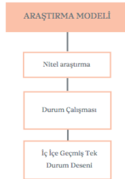
Şekil 2. Çalışmanın araştırma modeli

Türkiye’de travma haberciliği bağlamında travmatik yaşam olaylarının haberleştirilmesinde uyulması gereken yayın ilkelerinin belirlenmesini amaçlayan bu çalışmada; travma haberciliği kapsamındaki travmatik yaşam olayları tek bir duruma işaret ederken, araştırmada yayın ilkelerinin tanımlanacağı analiz birimleri ise travma haberciliğinde konuya taraf olan üç paydaştan oluşmaktadır. Dolayısıyla araştırmada bu üç paydaş; medya profesyonelleri, olaya maruz kalanlar ile hedef kitle bağlamında haber yayının ilkelerinin belirlenmesi amaçlanmaktadır. Bu bağlamda çalışmada tek bir durum içerisinde birden fazla alt tabaka ve analiz birimi (Subaşı ve Okumuş, 2017, s. 422) olmasından dolayı araştırma deseni iç içe geçmiş tek durum desendir. Yukarıda ifade edilenler doğrultusunda çalışmanın araştırma modeli aşağıdaki şekilde belirlenmiştir: