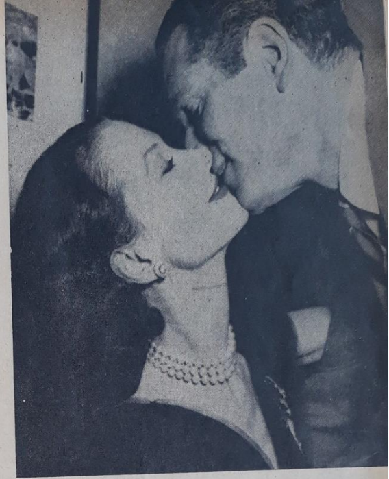
Bütün gün dışarda makine gibi çalıştıktan sonra ev işlerinden bir çoğunu da alan Amerikalı erkeğin karısından aldığı tek mükâfat budur : Bir öpücük !

GENÇ kız evlenince, çok pahalıya mal olan uşak ve hizmetçilere yolverir ve onların işini kocasına gördürür. Evde iş bölümü,