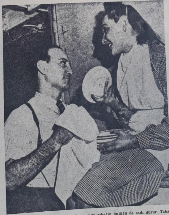
Mutfakta kadının naylon önlüğü yanında erkeğin önlüğü de asılı durur. Tabak- tan kocasına biraz yardım ederse ne mutlu!

dan başka kadının hayat ve kanun kitabında, devrimizden daha sert ve güç eski zamanlardan kalma bir kaide bugün hâlâ yaşamaktadır ki, bu da kadının müsaadesi ve lütfekârlığı üzerine ona refakat şerefine nail olan erkeğin daima silah başında olması, yanında ki kadın için dövüşmeğe daima hazır bulunmasıdır. Yüksek tahsil muhitinde genç bir kız talebinin şöhreti, etrafında dolayan ve onu gezmeğe götüren erkeklerin sayısı nisbetinde yükselir; fakat genç kız, delikanlılar arasında birkaç yumruk dövüşmesine sebebiyet verdiği takdirde bu şöhret göklere kadar yükselir.