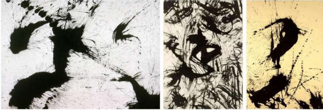
Görsel 1. (a) Mark Tobey, 1957, Uzay Ritüeli No. 1 / Space Ritual No. 1 . Kâğıt üzerine sumi mürekkebi, 74,3 x 95,1 cm. Artsy (solda), (b) Mark Tobey, 1957, İsimsiz / Untitled . Kâğıt üzerine mürekkep, 33,7 x 24,4 cm. The Met Museum (ortada), (c) Mark Tobey, 1957, Sumi / Sumi . Kâğıt üzerine Çini mürekkebi, 22,44 x 17,32.

yoğun kompozisyonları ile Tobey, Avrupa geleneklerinden de ayrılmaktadır. Tobey'in raslantısal fırça darbeleri ve kaligrafik vuruşları ile Lekecilik akımının temsiliyeti hissedilir. Tobey'in 1922 yılında Doğu Asyalı bir koloni ile karşılaşması ve Reng Kwei isimli Çinli bir sanatçı ile tanışması, Doğu Asya fırça kullanma tekniğini öğrenmesine sebep olmuştur. Eserlerinde sert fırça vuruşları tasarlanmış yoğun anlatımlı kompozisyonlarında kaligrafik izlenimler hissedilmektedir (Görsel 1). Tobey, Uzakdoğu düşüncesi ve yazısından esinlenerek soyut ve şiirsel resimler yapmış, fırçası ile yazı türü çizgiler oluşturmuş ve beyaz yüzeylere siyah boyalar ya da siyah yüzeylere beyaz boyalar akıtarak figüratif resim anlayışından ayrılmıştır (Yılmaz, 2006: 160). Hem perspektif hem de üç boyutlu gerçekliği reddetmiş, Batı kaligrafisinin klasik biçim, işlevsel olma ve okunabilirlik gibi en temel kavramlarına meydan okumuştur (Gaur, 1994: 216).