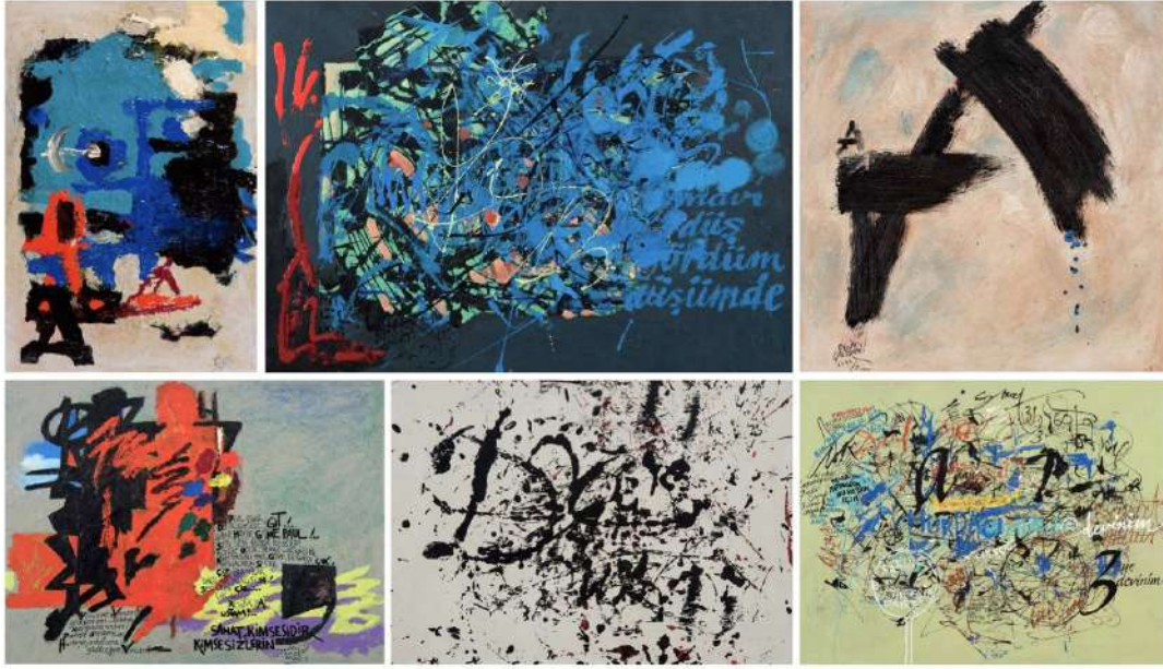
Görsel 12. (a) Etem Çalışkan, Hurdacı, 50x70 cm, Soyut Kaligrafi, Kâğıt Üzerine Akrilik (solda), (b) Etem Çalışkan, Mai Ses, 50x70 cm, Soyut Kaligrafi, Tuval Üzerine Akrilik (ortada), (c) Etem Çalışkan, AAA, 60x60 cm, Soyut Kaligrafi, Tuval Üzerine Akrilik (sağda, üst sıra). (d) Etem Çalışkan, Van Gogh 66x88 cm, Soyut Kaligrafi, Tuval Üzerine Akrilik (solda), (e) Etem Çalışkan, Dokunmalar, 50x70 cm, Soyut Kaligrafi, Kâğıt Üzerine Akrilik (ortada), (f) Etem Çalışkan, Kültür, 70x100 cm, Soyut Kaligrafi, Tuval Üzerine Akrilik (sağda, alt sıra).

başlangıcı yazıdır ve her bir resmini yine yazı olarak niteler. Kurallar içerisinde kuralsızlığı, özgürce kullandığı deneysel boyası ve fırça vuruşları ile yansıtır (Görsel 12 (a, b, d)). Leke ağırlıklı eserlerinde, yer yer okunur metinler yer almakta, metinlerin yan yana gelerek oluşturduğu lekese örüntüler ile kaligrafi ağırlıklı resimsel üslubu ayırt edici olmaktadır (Görsel 12 (b ve f)). Çalışkan'a göre sanatçı düşüncelerinde de çalışmalarında da özgür olabilmelidir. Özgürlüğü sanatçıya verenin yine sanat olduğunu savunan Çalışkan, eserlerinde kullandığı renklerden, lekese biçimlere ve metinsel öğelere değin sınırsız bir görsel betimleyicisi ve yaşayan değerli bir sanatçıdır. Sanatçı, kaligrafi alanında 2021 yılı Cumhurbaşkanlığı Kültür ve Sanat Büyük ödülünü almıştır.