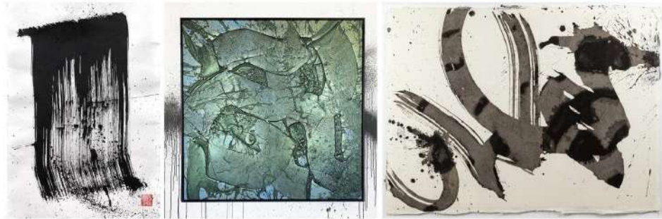
Görsel 6. (a) Niels Shoe Meulman, Anniversary Piece, Single Stroke, Kâğıt Üzerine Mürekkep (solda), (b) Niels Shoe Meulman, The Moment, Kâğıt Üzerine Karışık Teknik, 125x125x3 cm (ortada), (c) Niels Shoe Meulman, Ununsigned, 2019, Kâğıt Üzerine Mürekkep, 50x70 cm (sağda).

Michaux eserlerinde, yazıya benzeyen siyah lekelerde beyaz boşluklar elde etmektedir. Kağıt üzerindeki mürekkep lekelerinde, belirli bir