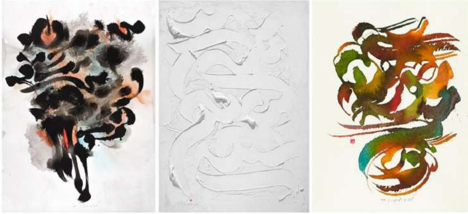
Görsel 5. (a) Korosh Ghazimorad, 2018, Patoglif Koleksiyonları / Pathoglyphics Collections, Karton Üzerine Akrilik, 70x100 (solda), (b) Korosh Ghazimorad, 2019, Beyaz Üzerine Beyaz Seri / White on White Series, Kanvas Üzerine Karışık Teknik, 70x100 (ortada), (c) Korosh Ghazimorad, 2020, Kökler ve Ağaçlar Koleksiyonu / Roots and Trees Collections, Karton Üzerine Akrilik, 20x29,5 (sağda).

etkilenecek grafiti öncülüğü ile tanınmış bir kaligrafi yorumcusudur. Geliştirdiği dinamik vuruşları ile karakteristik bir stil geliştirmiş, sıçratmalı boya kullanımı ile kompozisyonlarının lekesele etkisini özgünleştirmiştir (Görsel 6). Eserlerinin etkisi yazının resimsel biçimlenmesi ile gelişmektedir. Meulman, metinsel iletişimi görsel yolla ifade eden yöntemi benimsemiştir. Lekeci tavrı ile kompozisyonlarında etkiyi arttırmaktadır.