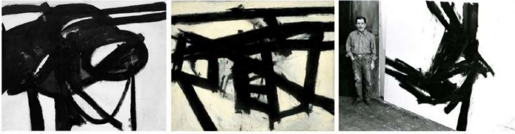
Görsel 4. (a) Franz Kline, 1950, Şef / Chief . Tuval üzerine Yağlıboya, 148,3 x 186, 7 cm, Artwizard (solda), (b) Franz Kline, 1956, Mahoning . Artwizard (ortada), (c) Franz Kline, 1950s, Franz Kline ve Eseri , Arte Moderna. (sağda).

üslubunu ortaya koyan fırça darbelerindeki basitleştirilmiş anlatım gücü ile kişisel çizim tarzını belirginleştirmiştir. Eserleri, Uzakdoğu kaligrafisinden esinlendiği izleri taşımaktadır (Görsel 4). Yoğun lekeci anlatımı ile resimlerinde ruhsal etki boyutu hissedilmektedir. Yazı, “biçim olarak anlamın yanı sıra tarifsiz bir ruhu da bünyesinde barındırır, duyguyu somutlaştırır” (Uçar, 2022: 8). Öyle ki Kline’nın eserlerindeki anlamın temsilleri, öznenin aidiyetine değil, anlamına gönderme yapmaktadır. Devasa büyüklükteki yüzey ve tuvallerdeki kararlı fırça vuruşları, siyah üzerinde yoğunlaştığı kadar beyaz boşlukları da tasarlayıp boyamasıyla, beyazın da siyah kadar önemli olduğuna işaret etmesiyle anlaşılmaktadır.