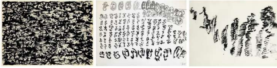
Görsel 7. (a) Henri Michaux, Sans Titre , 1960, Kâğıt Üzerine Hint Mürekkebi, 75x108 cm (solda), (b) Henri Michaux, Sans Titre , 1952, Kâğıt Üzerine Hint Mürekkebi (ortada), (c) Henri Michaux, Sans Titre , 1960, Kâğıt Üzerine Guaj Boya, 74x55 cm (sağda).

kompozisyon anlayışıyla sınırlandırılmaksızın tekrar eden lekeler ve biçimlerde, kaligrafinin etkisi gözle görülür niteliktedir.