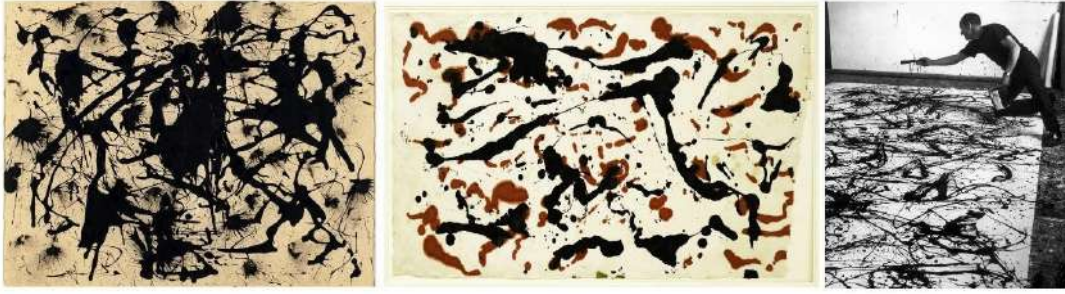
Görsel 2. (a) Jackson Pollock, 1950, İsimsiz / Untitled . Kâğıt üzerine mürekkep, 44,5 x 56,6 cm. MoMA (solda), (b) Jackson Pollock, 1951, İsimsiz / Untitled . Dut kağıdına siyah ve sepya mürekkep, 63,5 x 98,4 cm. Artsy (ortada), (c) Jackson Pollock, Atölyesinde Çalışırken . Indigo Dergisi (sağda).

ederek tuval yüzeyi üzerinde sıçratma, damlatma etkileri ve eylemleri gerçekleştirmektedir (Hollingsworth, 2009: 472). Görsel 2'de yer alan eserlerinde olduğu gibi Pollock, sıçrama etkisiyle lekesele tavrını deneysel malzemelerle geliştirmekte, modern sanatçıların yeni teknikler ile dönemin üslubunu şekillendirmede etken olduklarından söz etmektedir. Eserlerinde, sanatçısının anlatım yeteneğinin ön planda tutulduğu soyut dışavurumculuk ile figürsüz ve dış gerçekten bağımsız bir anlatım tercih edilmektedir.