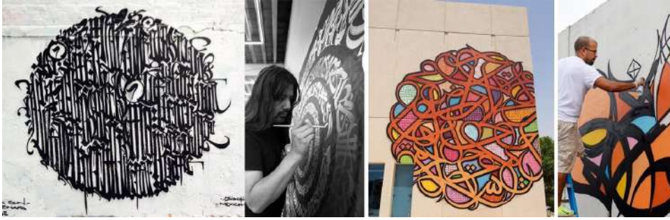
Görsel 9. (a) Said Dokins & Monkey Bird. The Secrets of Mind , 2016, Duvar Üzerine Kaligrafiti, Fransa (solda), (b) Said Dokins, Duvar Üzerine Kaligrafiti uygularken (ortada, solda), (c) eL Seed, Kaligrafiti, Duvar Üzerine Kaligrafiti, Dubai (ortada, sağda), (d) eL Seed, Kaligrafiti, Duvar Üzerine Kaligrafiti uygularken (sağda).

ve yeni teknolojilerin birleştiği lekesel kaligrafi sanatı hissedilir. Duvar resimleri ve enstalasyonlarında mekâna özgü metinsel içeriğin kullanıldığı kaligrafiler vardır. Batı kaligrafisi eğitiminin yanı sıra Japon kaligrafisi konusunda da çalışmalar yapmakta, eserleri ulusal ve uluslararası birçok kentin duvarlarında yer almaktadır (Görsel 9, (a)). Sokak Sanatı ve kaligrafi arasındaki kesişme, eserlerinin ortak özelliklerindedir; lekesel boşluk ve doluluk ilişkisi, harf formlarının temelinde şekillense de lekesel ağırlıkları belirgindir. Bu nedenle çalışmalarında lekesel üslup, harfin ötesine geçen biçimlerin vurgusu ile hissedilir.