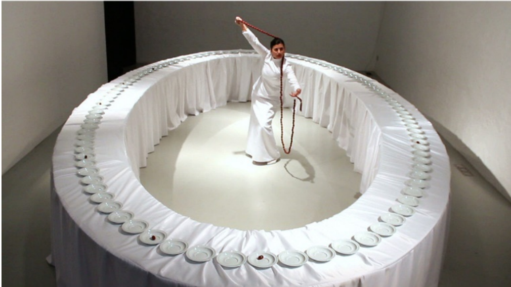
Resim 5. Nezaket Ekici, Performans, 2015 (Pazarbaşı, 2015)

Kimlik, cinsiyet ve kültürel normlar üzerine odaklanan eserleriyle tanınan Nilbar Güreş ise, kadının toplumsal hayattaki yerini sorgulayan çalışmalar yapmış ve kültürel çeşitliliği, cinsiyet eşitliğini ve kimlik meselelerini ele almıştır. Bu video performansında (Resim 6) Güreş, başına giydiği her katmanı açarak birlikte yaşadığı kadınların isimlerini söyleyerek günlük hayatın biyografik deneyimini siyasi bir konu olan İslam fobiye taşımaktadır. Özellikle Avrupa'da göçmen karşıtı grupların ırkçı politikalarını meşrulaştırmak için "örtülü ve güçsüz bırakılan" müslüman figürünü kullanmalarının kadınlara yönelik İslam fobiye bir tepki olduğu düşünülmektedir. Bu çalışma, Viyana ve İstanbul gibi farklı yerlerde yaşayan sanatçının kendini konumlandırma potansiyelini ve coğrafi sınırları aşma kabiliyetini vurgulayarak kavramsal bir anlam taşımaktadır. Nezaket Ekici'nin bu performansı, siyasi bir mesele olan İslam fobiye dikkat çeken ve kadınların güçlendirilmesi için bir çağrıda bulunan önemli bir çalışmadır.