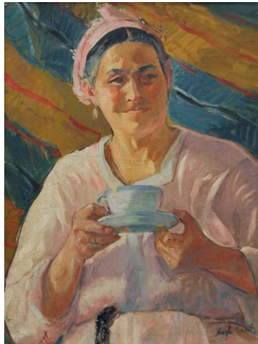
Resim 3. Nazlı Ecevit, Portre, (Kültür Portalı, 2023).

Nazlı Ecevit'in sanat kariyeri boyunca sergilediği çeşitlilik ve başarı, Türk sanat camiasında takdirle karşılanmıştır. Eserleri, güçlü kompozisyonları, detaylara verdiği önem ve renk kullanımıyla dikkat çekmektedir. Sanatseverler arasında geniş bir hayran kitlesi bulunan Ecevit, Türk resim sanatına önemli katkılarda bulunmuş ve ün kazanmış bir sanatçı olarak anılmaktadır.