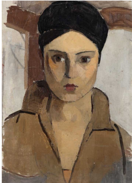
Resim 2. Hale Asaf, Oto portre (İstanbulsanatevi, 1987).

Hale Asaf, dönemin en yetenekli kadın sanatçılarından biridir ve eserlerinde yalın (Resim 2), gerçekçi bir tarz kullanarak iç dünyasını yansıtmıştır. Çarpıcı işler ortaya koymuştur. Mihri Müşfik gibi teyzesiyle aynı mesleği paylaşmıştır. Ne yazık ki, Hale Asaf sağlık sorunlarıyla mücadele etmek zorunda kalmış ve henüz 35 yaşında yaşamını yitirdiği bilinmektedir. Ancak, verdiği mücadele ve yaşadığı hüznü anlatan pastel tonlu tabloları günümüzde hala sanatçının duygularını yansıtmaya devam etmektedir.