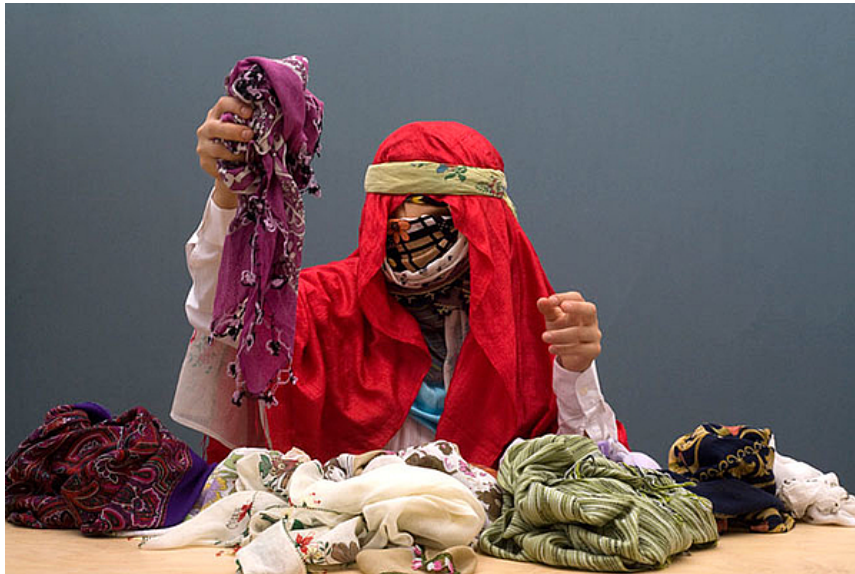
Resim 6. Nilbar Güreş, Video (Güreş, 2006).

Kimlik, cinsiyet ve kültürel normlar üzerine odaklanan eserleriyle tanınan Nilbar Güreş ise, kadının toplumsal hayattaki yerini sorgulayan çalışmalar yapmış ve kültürel çeşitliliği, cinsiyet eşitliğini ve kimlik meselelerini ele almıştır. Bu video performansında (Resim 6) Güreş, başına giydiği her katmanı açarak birlikte yaşadığı kadınların isimlerini söyleyerek günlük hayatın biyografik deneyimini siyasi bir konu olan İslam fobiye taşımaktadır. Özellikle Avrupa'da göçmen karşıtı grupların ırkçı politikalarını meşrulaştırmak için "örtülü ve güçsüz bırakılan" müslüman figürünü kullanmalarının kadınlara yönelik İslam fobiye bir tepki olduğu düşünülmektedir. Bu çalışma, Viyana ve İstanbul gibi farklı yerlerde yaşayan sanatçının kendini konumlandırma potansiyelini ve coğrafi sınırları aşma kabiliyetini vurgulayarak kavramsal bir anlam taşımaktadır. Nezaket Ekici'nin bu performansı, siyasi bir mesele olan İslam fobiye dikkat çeken ve kadınların güçlendirilmesi için bir çağrıda bulunan önemli bir çalışmadır.