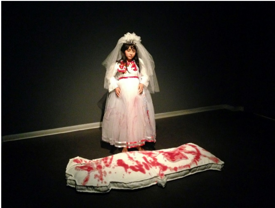
Resim 7. Şükran Moral, Çocuk Gelin, 2014 (Yıldırım, 2014).

Son olarak eserleriyle kadının mücadelesini ve kadına yönelik toplumsal baskıları ele alan Şükran Moral, feminist bir perspektifle çalışan bir sanatçıdır. Kadının güçlü duruşunu ve toplumsal hayattaki yerini vurgulayan eserler ortaya koymuştur. Çocuk gelin (Resim 7) olgusu, evlilik adı altında normalleştirme süreciyle kabul edilmiş bir durumdadır. Bu normalleştirme süreci, kadın ve kadın bedeni üzerindeki hak taleplerini, vicdan kavramının rahatlatılmasını amaçlamaktadır. Bir enstalasyon çalışmasında Moral, çocuk figürüne gelinlik giydirmiştir. Göğüs kısmına ve kollarına altın takılar ekleyerek, gelinliğin bel bölgesine bağladığı kırmızı kurdeleyle kadın bedeninin indirgendiği bekâret kavramına göndermede bulunur. Ancak sanatçı, bu noktada durmayıp bir adım daha ileri gitmiş ve gelinliği kanla lekelemiştir. Kan, öncelikle bekâret sembolü ile başlayıp namusla ilişkilendirilen her türlü cinayeti içeren geniş bir yelpazede ele alınır. Çocuk gelinin önünde yerde duran yastık, Türkiye coğrafyasını temsil ederken üzerindeki kan desenleri, çocuk gelinlerin ve cinayetlerin ne kadar yaygın olduğunu ifade etmektedir. Bu ifade, toplumumuzda kanıksanmış ve en tehlikeli insanlık suçuna işaret etmektedir.