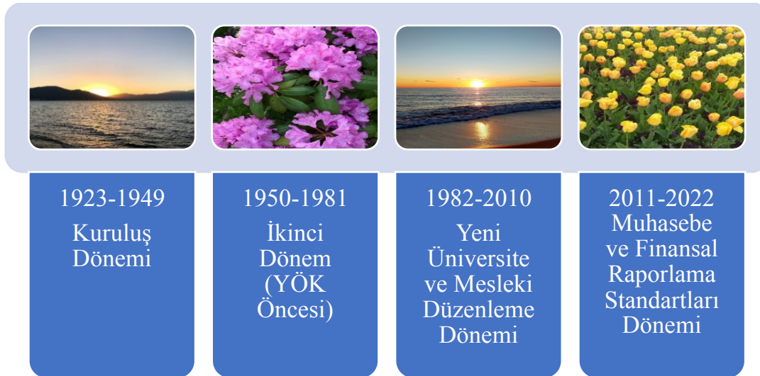
Şekil 1. Cumhuriyet Döneminde Muhasebe Eğitiminde Değişim Dönemleri

Cumhuriyet dönemindeki muhasebe eğitimi, farklı olgu ve etkenlere göre dört bölümde ele alınmıştır. Bunlar; Cumhuriyet öncesinden gelen üniversitelerde muhasebe eğitimi, 1950'den itibaren YÖK öncesi dönemde kurulan üniversitelerde muhasebe eğitimi, 1982'den itibaren YÖK sonrası yeni üniversite oluşumu ile birlikte 3568 sayılı muhasebe meslek yasası ve Tekdüzen Muhasebe Sisteminin uygulandığı dönem ve 2011 sonrası Muhasebe ve Finansal Raporlama Standartlarının etkisindeki dönem şeklindedir.