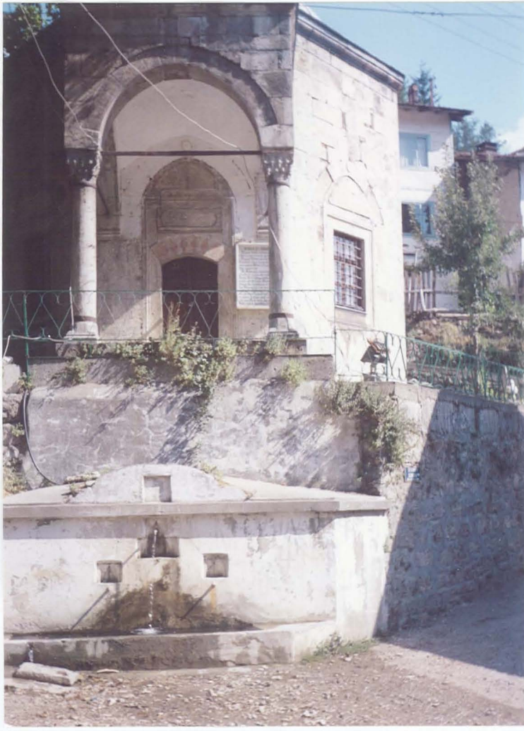
Göynük- Ömer Sekkin Türbesi ( XV. yy)