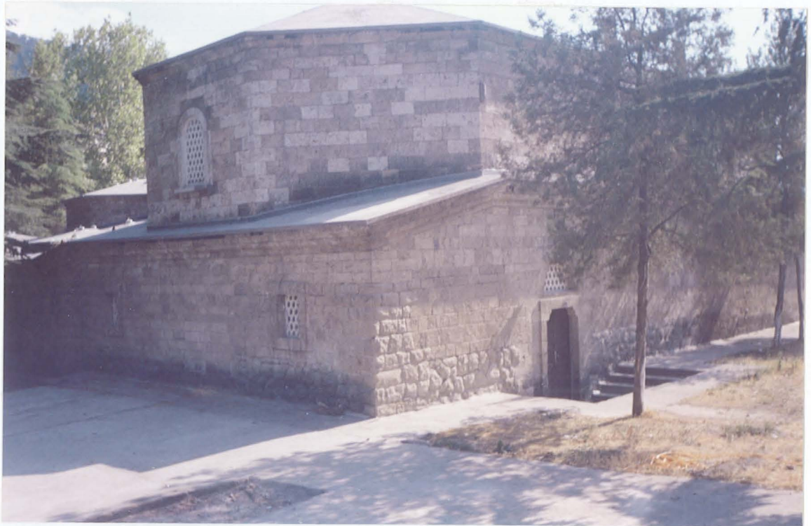
Göynük-Gazi Süleyman Paşa Hamamı (1331-1335)