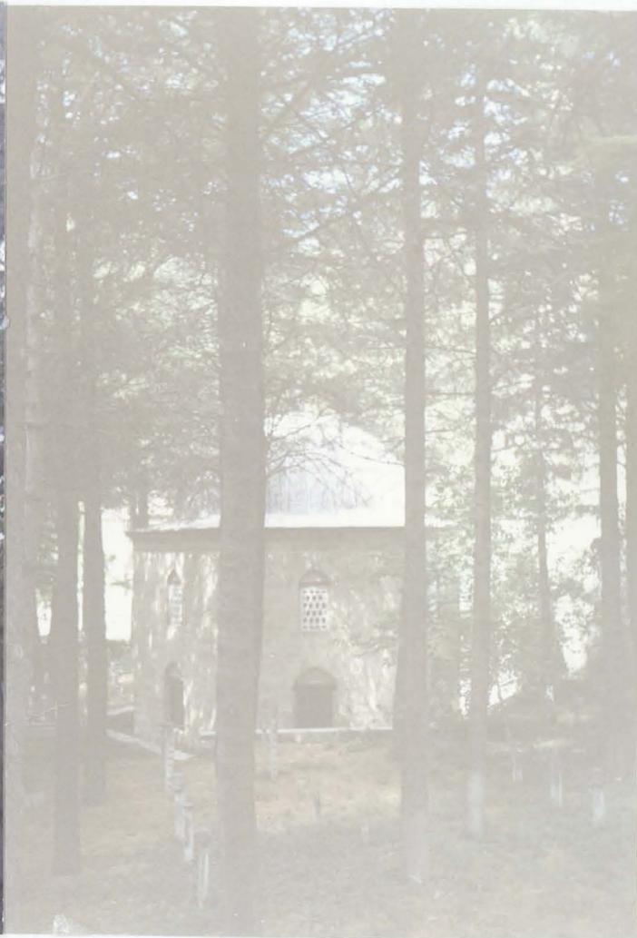
Göynük-Gazi Süleyman Paşa Camii (1331-1335)