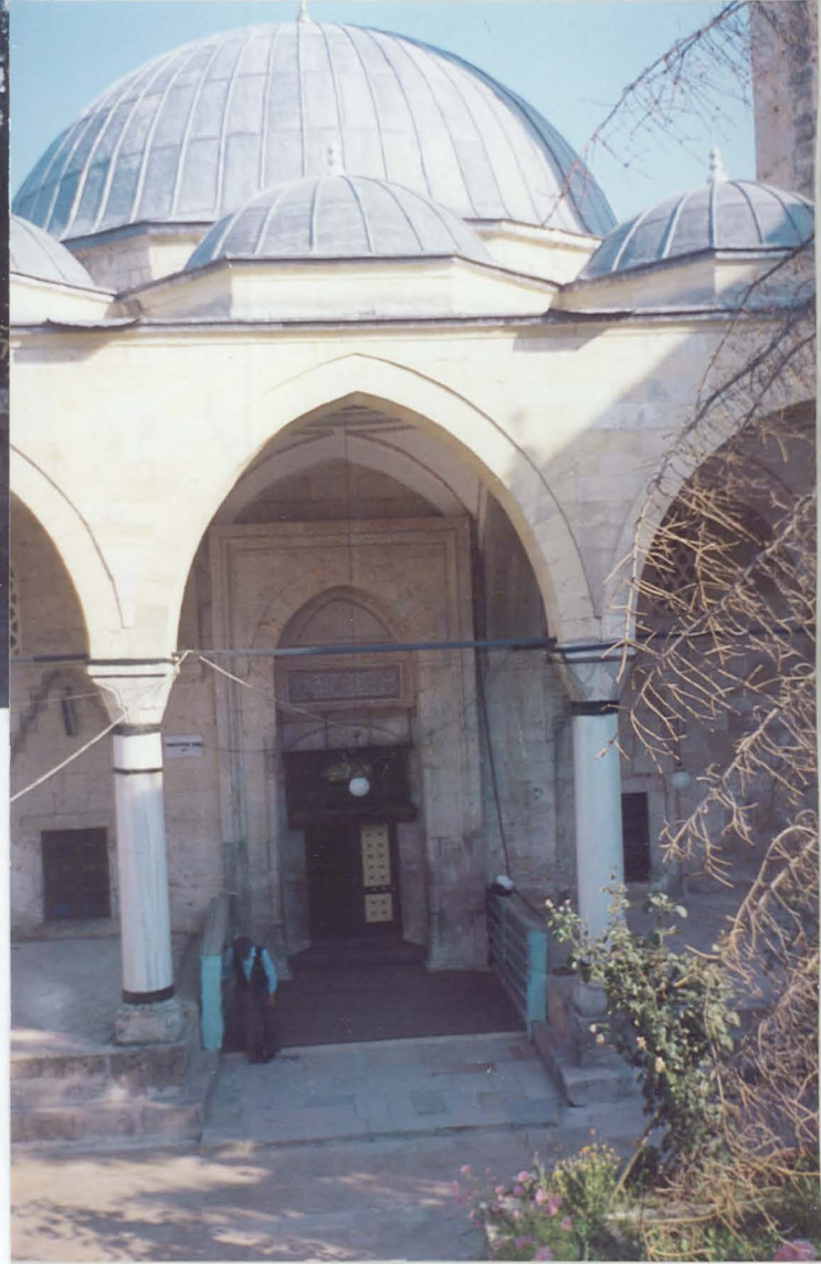
Taraklı Yenicesi-Yunus Paşa Camii (1517)