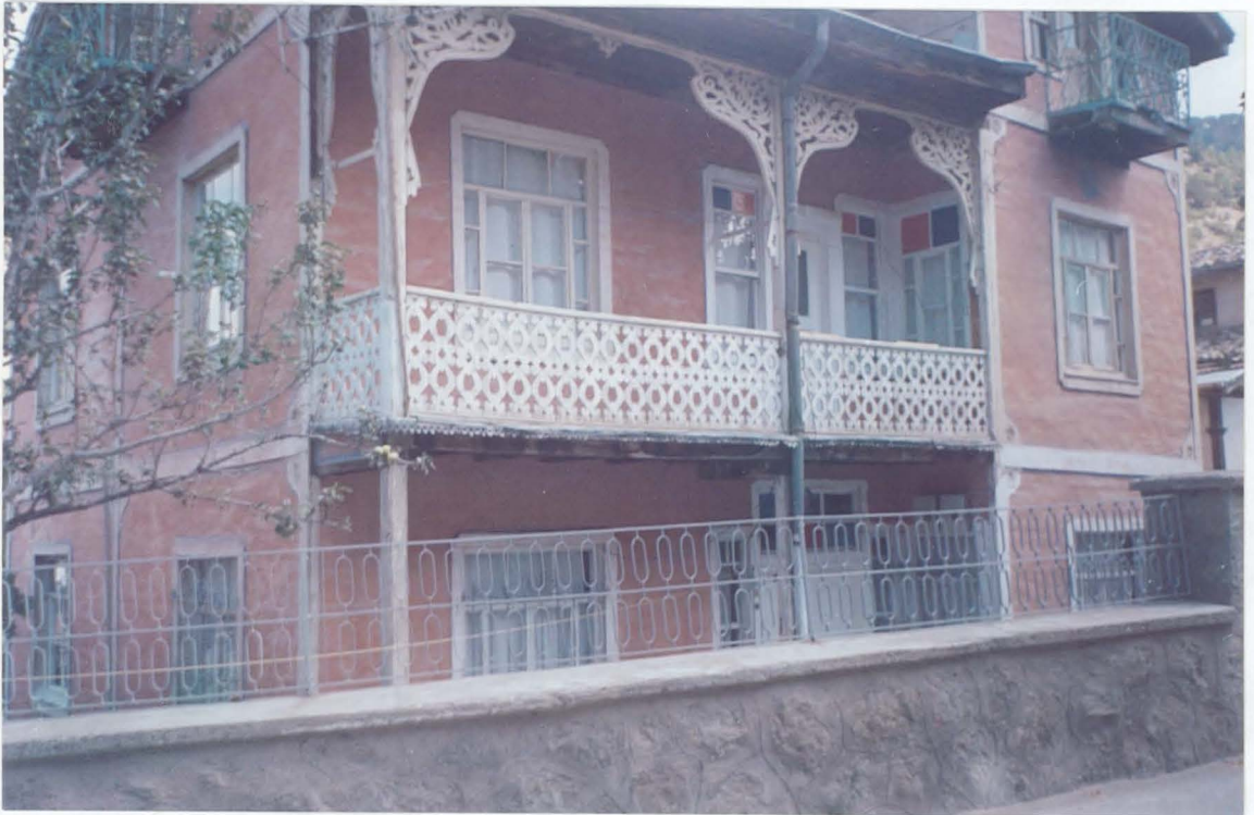
Göynük Eski Osmanlı Evlerinden Bir Örnek