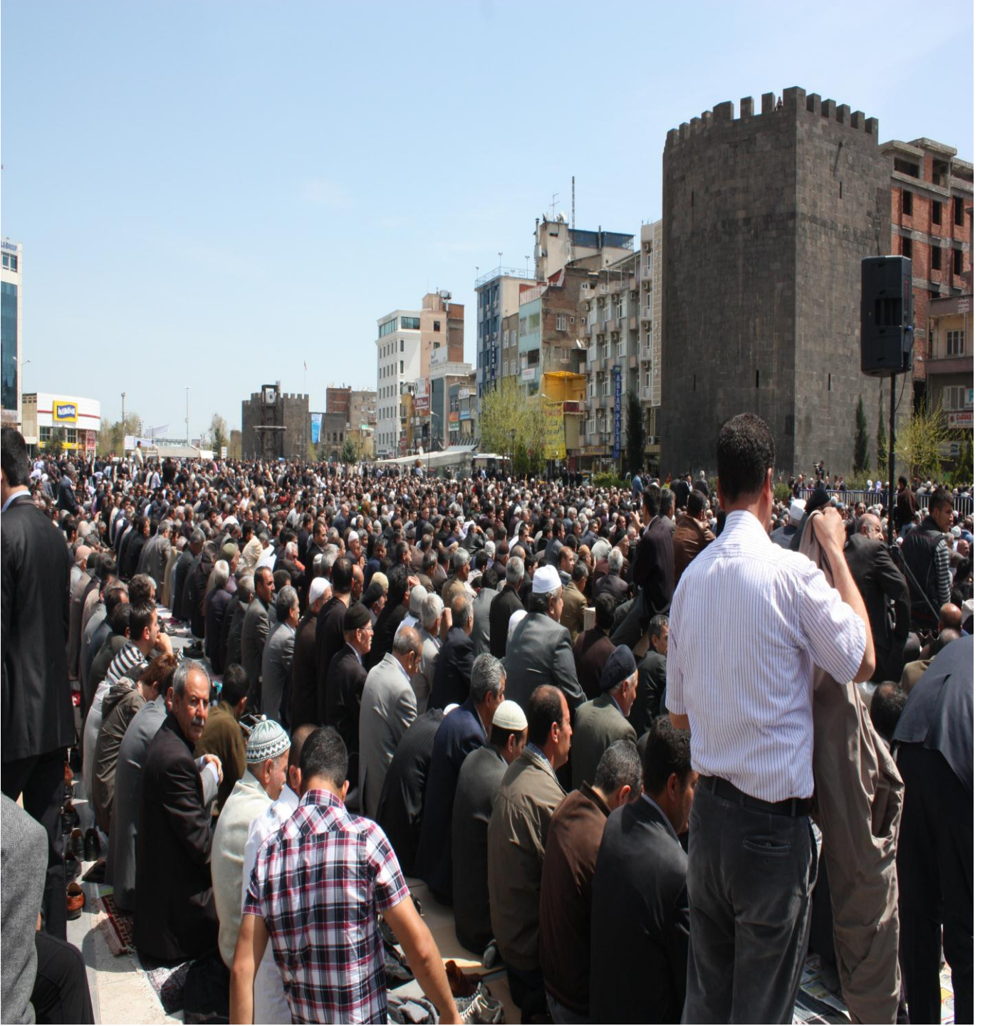
Resim 5: Diyarbakır'daki sivil Cuma namazından görünüm