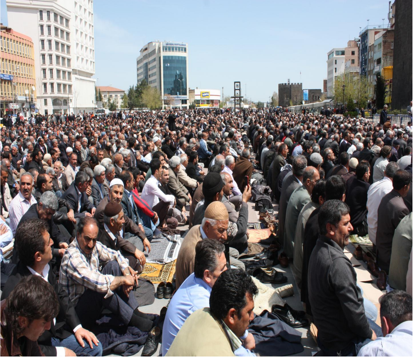
Resim 1: Diyarbakır'daki sivil cuma namazından görünüm