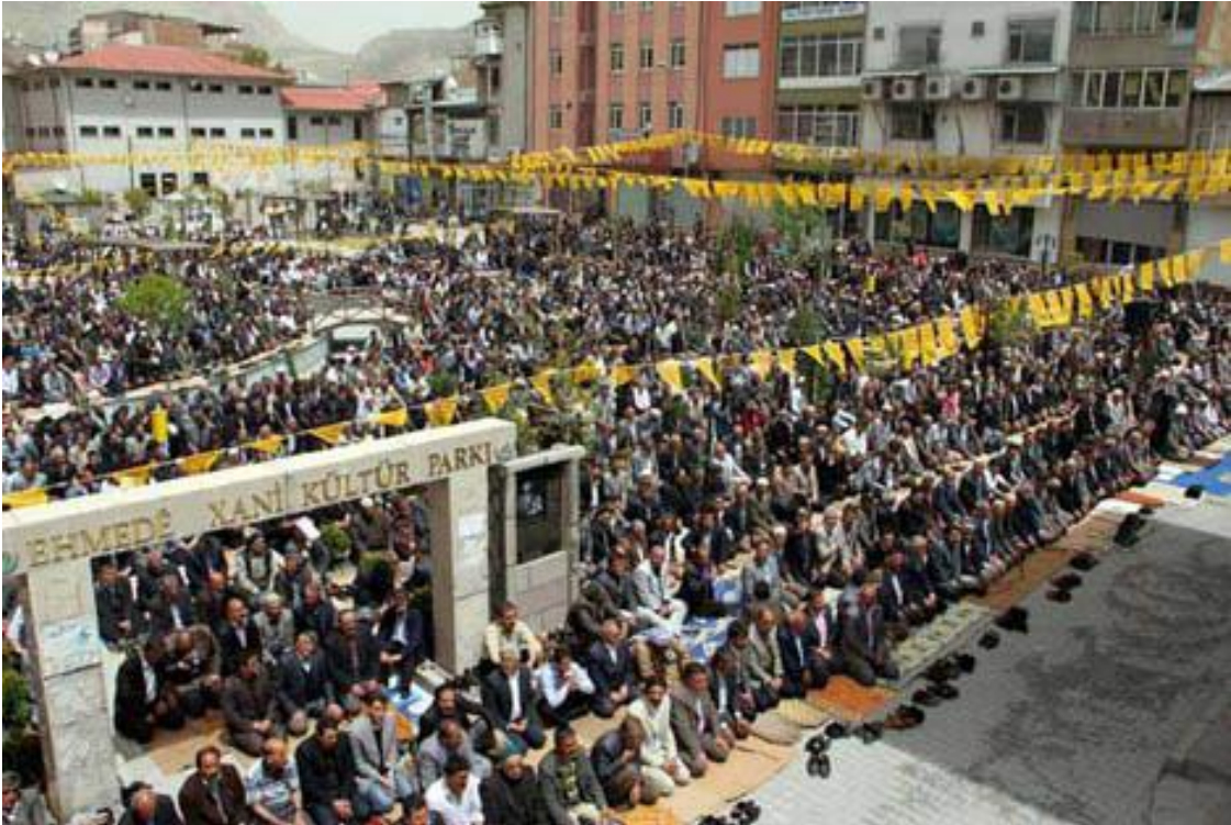
Resim 11: Bir sivil cuma namazından görünüm