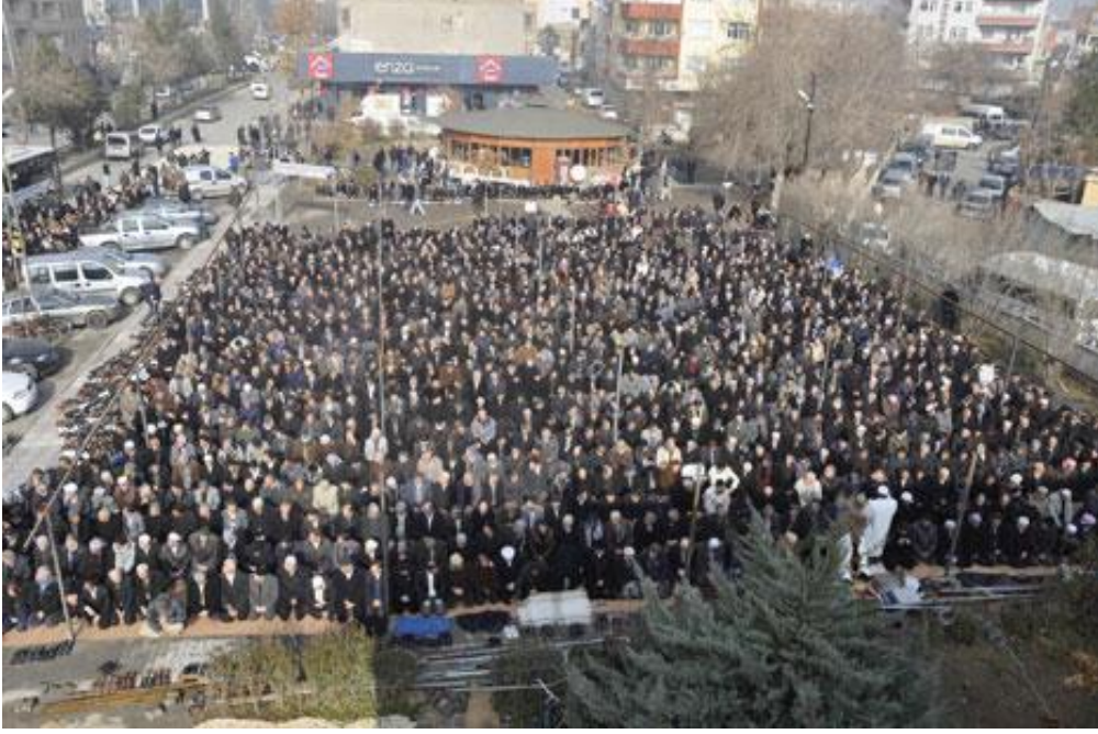
Resim 14: Bir sivil cuma namazından görünüm