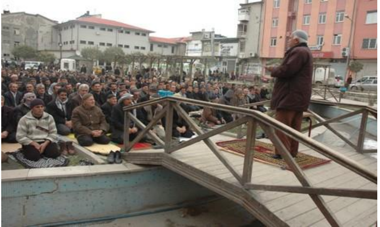
Resim 9: Van'daki sivil cuma namazından görünüm