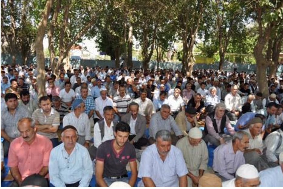
Resim 10: Bir sivil cuma namazından görünüm