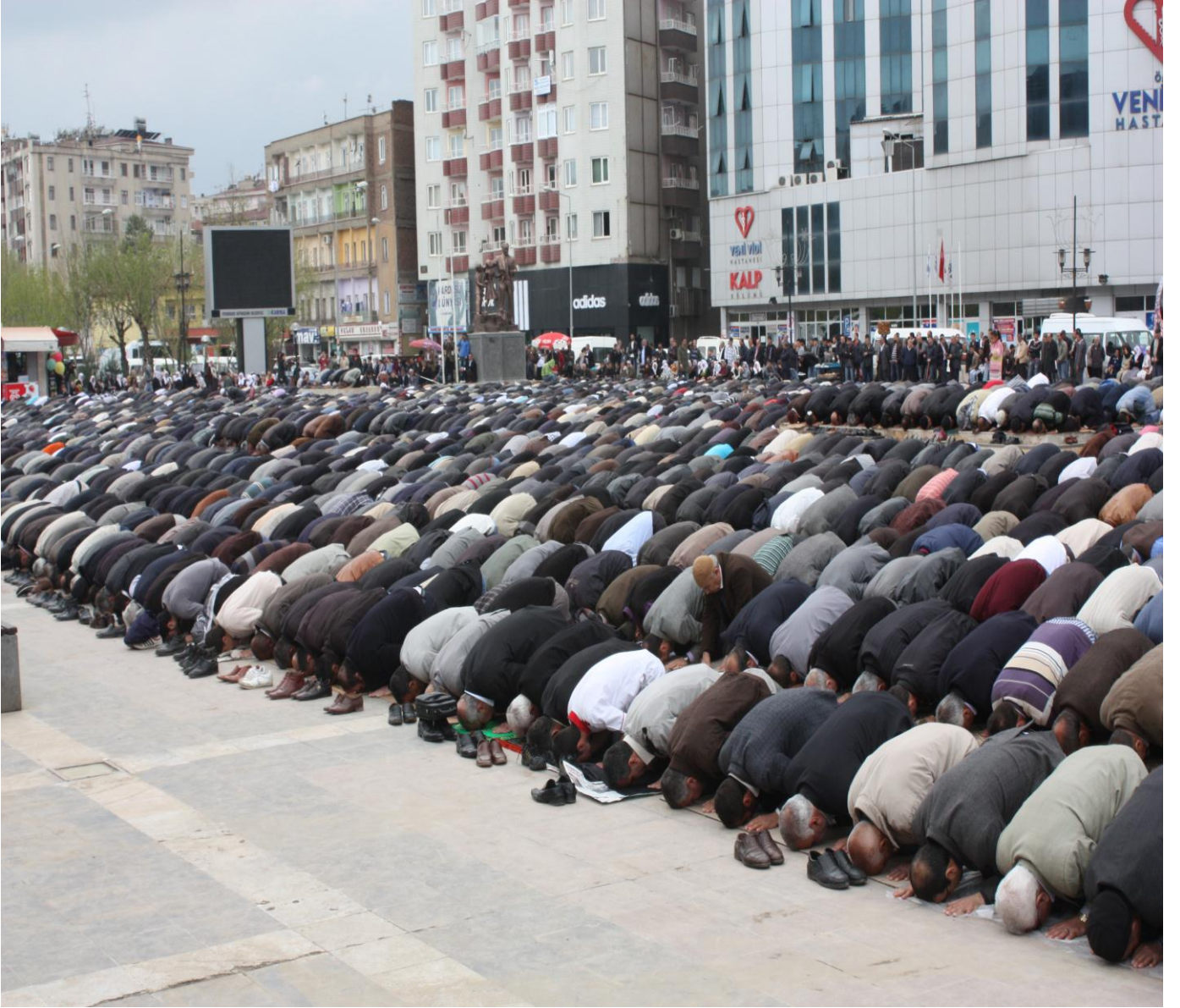
Resim 3: Diyarbakır'daki sivil cuma namazından görünüm