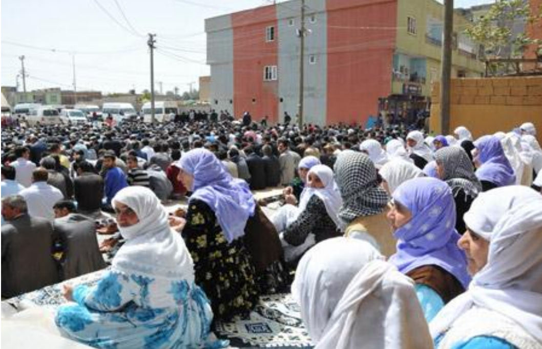
Resim 15: Bir sivil cuma namazından görünüm