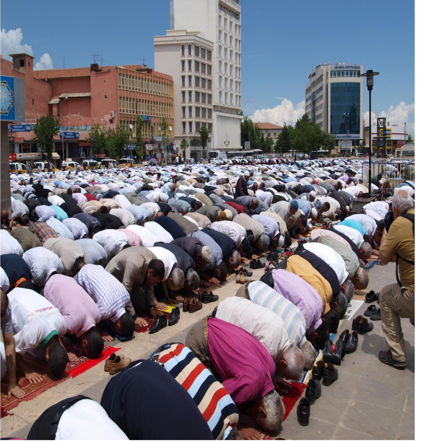
Resim 2: Diyarbakir'daki sivil cuma namazından görünüm