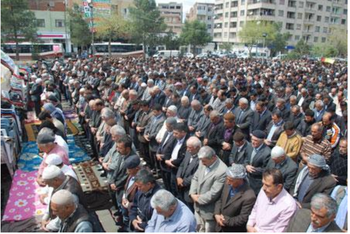
Resim 6: Batman'daki sivil cuma namazından görünüm