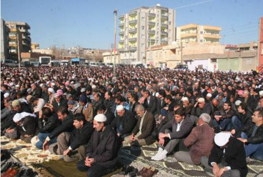
Resim 13: Bir sivil cuma namazından görünüm