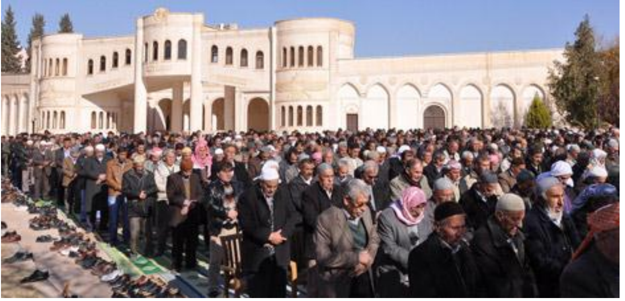
Resim 8: Nusaybin Mitanni Kültür Merkezindeki sivil cuma namazı