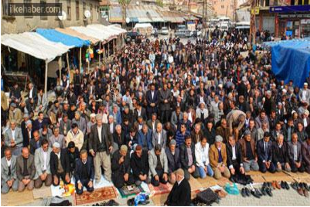
Resim 7: Yüksekova'daki sivil cuma namazı