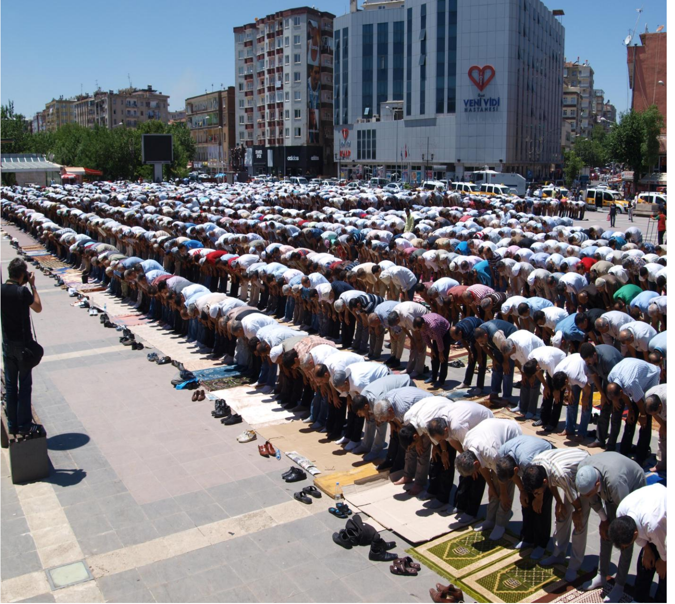
Resim 4: Diyarbakır'daki sivil cuma namazından görünüm