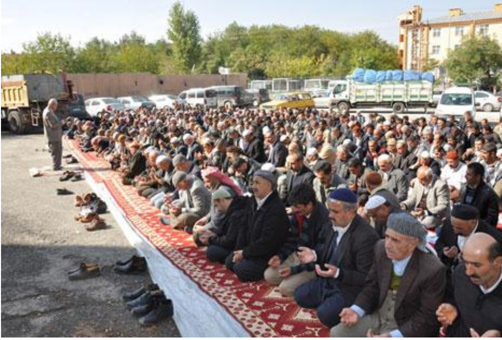
Resim 12: Bir sivil cuma namazından görünüm