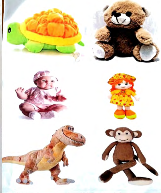
1. GRUP Yumuşak Oyuncaklar