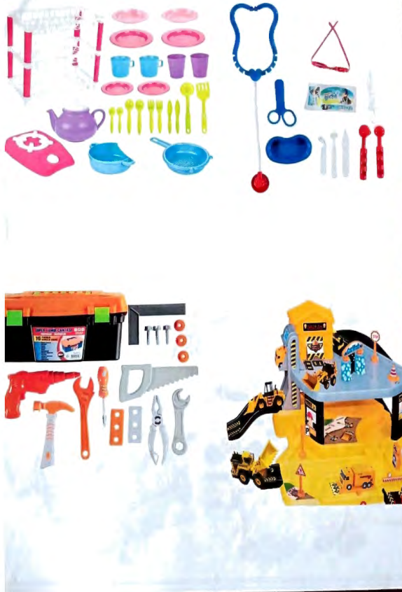
2. GRUP minyatür nesnelere Set