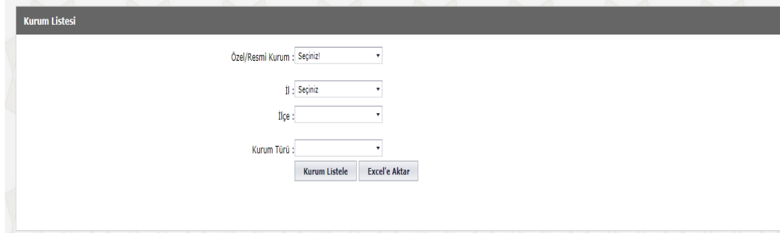
Görsel 2.1. MEBBİS okullar listesi web arayüzü ( https://mebbis.meb.gov.tr/KurumListesi.aspx adresinden, 12 Kasım 2019 tarihinde edinilmiştir)

MEB kurumsal internet adresi aracılığıyla ulaşılan okullar ile ( https://www.meb.gov.tr/baglantilar/okullar/index.php ) ve MEBBİS veri tabanından elde edilen veriler karşılıklı bir incelemeye tabi tutularak, il millî eğitim müdürlükleri ve okulların kurumsal web sayfalarından da güncellik ve doğruluk kontrolü yapılmasının ardından verilerin düzenlenmesi aşamasına geçilmiştir. Verilerin düzenlenmesi araştırmacıya zaman yönünden fayda sağlamasının yanında, verilerin kodlanması ve temaların belirlenmesi aşamalarında da büyük kolaylık sağlamaktadır. Bu amaçla, MEBBİS veritabanı aracılığıyla ulaşılan MEB kurumları listesi Excel formatında bilgisayara indirilmiş, MEB'e bağlı kamu okul ve özel okul niteliğindeki okul öncesi, ilkokul, ortaokul ve liseler dışındaki rehabilitasyon merkezi, halk eğitim merkezi vb. bütün kurumlar listeden çıkarılmıştır. MEBBİS kurumsal internet adresinde yer alan okullar listesi arayüzü Görsel 2.1.'de gösterilmiştir.