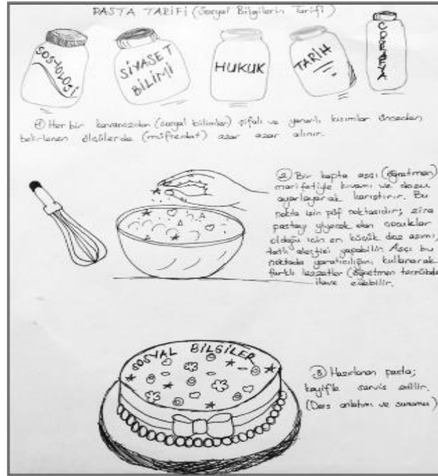
Şekil 1.4. Sosyal Bilgiler Tarifinde Pasta Metaforu (İnan, 2009)

İnan (2019) sosyal bilgileri “kavrayış düzeyleri gözetilerek sosyal bilimlerin gerçek hayat ve yaşanılan toplumla ilgili seçilmiş konulara yer veren bir derstir” şeklinde tanımlamış ve bir pasta metaforu kullanmıştır. Metafor Şekil 1.4’ de gösterilmiştir.