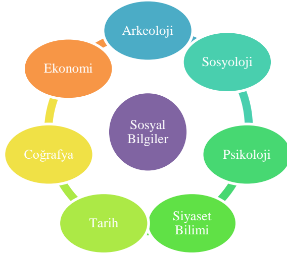
Şekil 1.3. Sosyal Bilgiler Dersinin Bileşenleri (Martorelle, 1988).

Sosyal Bilgiler tek bir ders olarak ele alınsa da Arkeoloji, Sosyoloji, Psikoloji, Siyaset Bilimi, Tarih, Coğrafya, Ekonomi alanlarının tümünü içermektedir.