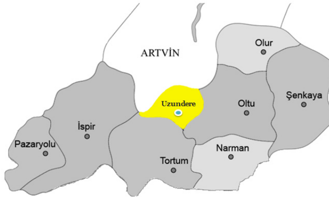
Şekil 2. Uzundere İlçesinin Konumu

Uzundere ilçe merkezi Tortum çayının doğusunda, 1050 m yüksekliklerde kurulmuştur. Yüzölçümü 830 km 2 olan ilçede Karadeniz iklimi hâkimdir. İlçenin yeryüzü şekillerini dağlar, dağların arasına yerleşen vadiler ve ara ara gözüken tepeler oluşturmaktadır. Bu yeryüzü şekillerinin bugünkü görünümünün oluşmasında tektonik hareketler oldukça aktif bir şekilde rol almışlardır (Ünal, 1998, s.413).