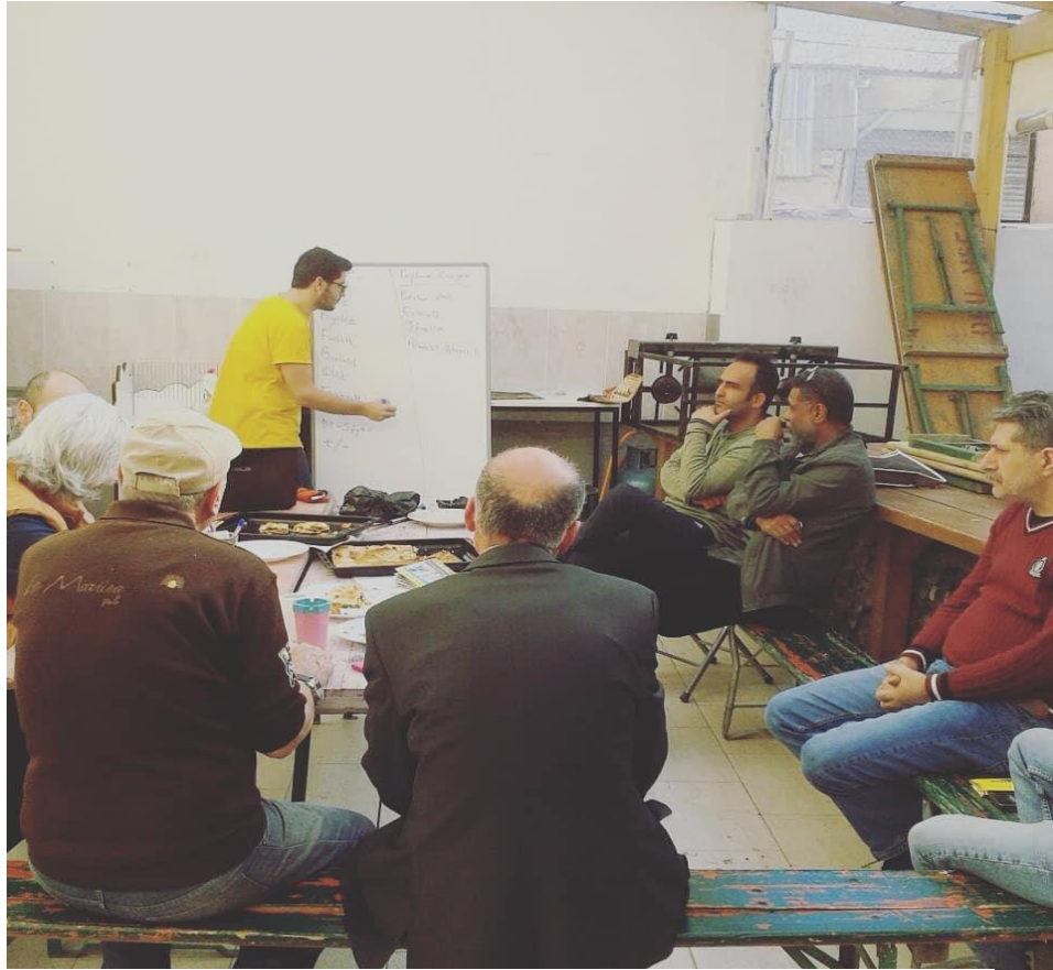
Resim 6.1: 2018 8 mart etkinliđi. Erkeklik tartışmaları. Kapılar

Bundan dolayı bir tahakküm biçimi karşısında farklı öznelerin bir araya gelebilmesi, bahsi geçen tahakkümün herkes için aynı olan mantığını idrak etmek ile o tahakkümün sonuçlarının farklı özneler için ayrıcalık üretebileceğini kabul etmek ve bu ayrıcalıklı öznelerin diğer öznelere karşı konukseverlik etiği sorumluluğuyla hareket etmesiyle mümkün olabilir. Özneyi inşa edecek(ya da başına gelecek) hakikatin oluşumu, bu bağlamda konukseverliğin etik sorumluluğun pratik ilkelerine yaslanmak durumundadır. Fakat bu noktada açık olan, konukseverlik etiğe ait bir takım pratik ilkelerin hakikatler etiği içerisinde istihdam edilmesi gerekliliğidir. Çünkü politik öznenin inşası sorunsal konukseverlik etiğinin değil, hakikatler etiğinin gündemine aldığı ve çözüme kavuşturmak istediği bir meseledir.