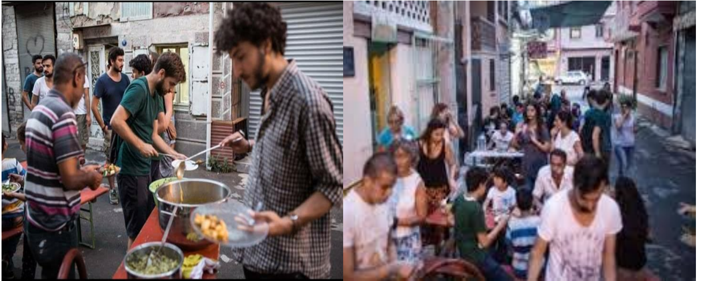
Resim 4.4: Kapılarda yapılan ahali mutfağlarından biri

Ahali mutfağı buluşmalarından birinde mahalleli ile beraber pazara gidip erzak toplama ve sonrasında yemek hazırlama sürecine katıldık. Mahalleden birkaç aile de bu etkinliğe katıldı. Büyük çoğu da daha önce ahali mutfağının parçası olan ailelerdi. Genel olarak katılımın bu düzeyde sınırlı olduğunu öğrendik. Yardım faaliyeti ile kıyaslandığında, dayanışma faaliyetine katılımın anlamlı ölçüde kısıtlı olması ‘hazıra konma’ eğilimine dair bir çıkarıma neden olabilir. Ancak bu çıkarımı sadece mültecilerle sınırlı tutmak yerine insan doğasına genişletmek hakikate daha yakın bir analiz olur. Bundan dolayı yardım faaliyeti sonucunda ortaya çıkan konuksevmezlik söyleminin hakikatten çok uzak olduğunu belirtebiliriz.