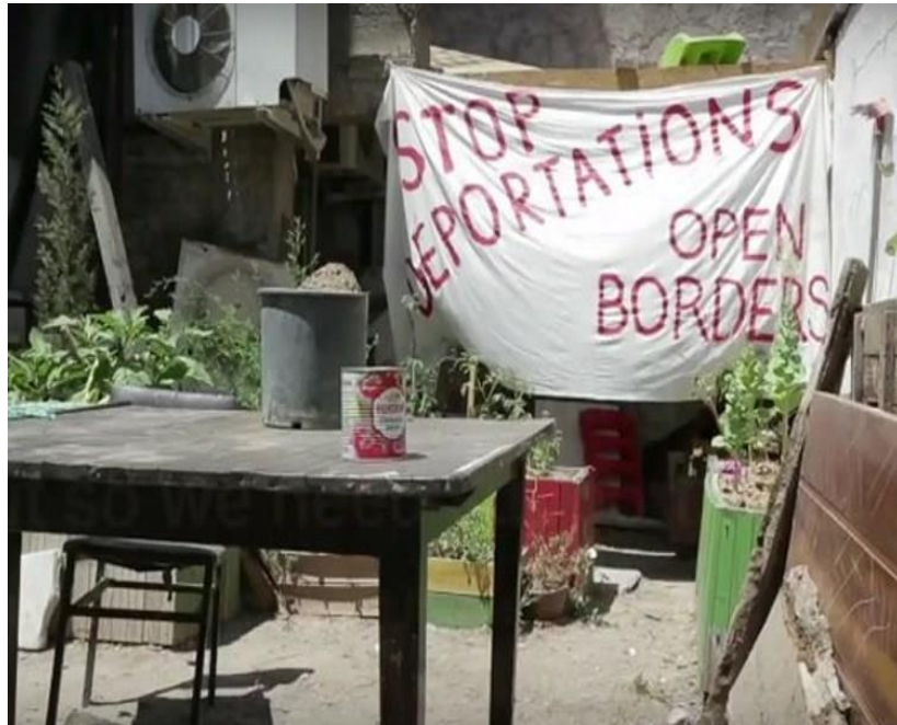
Resim 3.1: Kapılar iç mekan. 1 Mayıs 2015 yürüyüşünde kapıların kullandığı pankart.

Yurtsuzluğun Deleuze ve Guattari'nin felsefi bağlamında yorumunda ise koşulsuz konukseverliğin potansiyellerini bulmak mümkün. Çünkü bu bağlam, konukseverlik ilişkileri içerisinde ele aldığımızda; bulunduğu mekanla göçebe bir kavrayışla ilişki kuran yani kendini evin maliki olarak değil –volunturist hareketlilik içerisinde- ev işlerinin düzenlenmesinde gönüllü olarak gören bir anlam dünyasına dönüşebilmektedir. Bu anlam dünyası içerisinde eve gelen misafirin evin kontrolünü ele geçirmesi bir kaygı yaratmaz. Çünkü göçebe volunturist açısından bulunduğu mekan bir geçicilik ifade eder. Mekana yönelik mülkiyet odaklı bir kavrayışı bulunmaz. Bu yüzden mekanın kendisine fetiş bir anlam da yüklenmez. Ancak mekanın göçebe volunturistten önce verili bir takım koşulları olduğunu unutmamak gerekir. Bu yüzden koşulsuzluk ancak göçebenin kişisel perspektifinde oluşabilecek bir algı olarak kalabilir. Gelen misafiri karşılayan olarak, kendi geçiciliği ile misafirin geçiciliği arasında kuracağı özdeşlik, mekanın reel politik üzerinden oluşan koşullarına tabi olması gerçekliği ile kesintiye uğrayabilir.