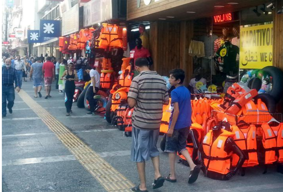
Resim 1.1: 2015 yılından Basmane Fevzi paşa bulvarı üzerindeki bir kaç esnaf

Namazgah mahallesi, İzmir'in Konak ilçesine bağlı Basmane semtinin güney batı bölgesinin merkezinde bulunmaktadır. Agora antik kentin bulunduğu bu bölge, Suriye iç savaşından önce de İzmir'e gelen göçmenlerin ilk adresi olarak düşünülebilir. İç savaş öncesi Afrikalı göçmenlerin yoğunlukta olduğu namazgah mahallesi, 2013 yılında Avrupa Birliği ile Türkiye arasında imzalanan ve 2016'da yürürlüğe giren mültecileri geri kabul antlaşmasından önce, savaştan kaçarak Türkiye'ye sığınan ve buradan da Avrupa'ya gitmek isteyen mültecilerin yoğun olarak buldukları bir yerdi. Bu araştırmanın ilk pilot gözlemleri için İzmir'de bulunduğum sıralar Basmane esnafının tamamına yakını, kaçak yollarla Yunanistan'a ve adalarına gitmek isteyen mülteciler için bot ve can yeleği gibi ekipmanlar satıyordu. Kaçakçılık ekonomisinin yarattığı yoğun talep ve esnafın hızlı bir şekilde bu talebe ayak uydurması ve bu durumun kamusal alanda herkesin gözü önünde olması etik ile reel politiğin yer değiştirdiğinin açık bir kanıtıydı. Bu yer değiştirmeyi konukseverlik etiğinin sınırı olarak, bir eşik olarak tarif edebiliriz.