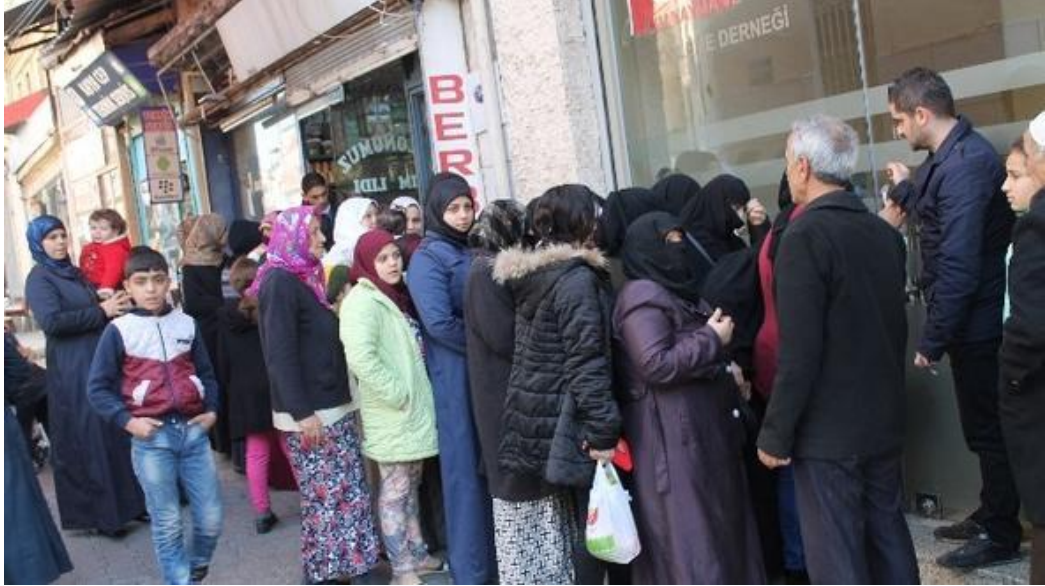
Resim 4.3: Hatuniye camii derneği önünde yardım sırası

İslam'ın egemen yorumlarına referansla gerçekleşen tüm konukseverlik pratiklerinin, alan el ile veren el arasındaki eşitsizliği yeniden ürettiğini varsayabiliriz. Burada egemen yorum olarak özel mülkiyet rejiminin sürekliliğini işaret ediyorum. Yardım faaliyetlerinin ideolojik açmazı olarak özel mülkiyet rejimini işaret ettiğimizde; bu bağlamda gerçekleşen konukseverlik pratiklerinin açmazlarını farklı dini ya da politik ideolojilere sahip kişi ve gruplara genişletebiliriz. Bugün İslami referanslara sahip olmayıp ama mültecilere yönelik yardım faaliyeti kapsamında pratikleri olan birçok kişi ve kurum mevcut. Suriyeli mültecilere yönelik 'hazıra konma' ve 'daha çok isteme' söylemi ile bu alanlarda da karşılaşmak mümkün. Yardım faaliyeti ve bu faaliyete gömülü olan eşitsiz ilişki, konuksever bir pratiğin hızlıca konuksevmez bir dile dönüşebilmesine olanak tanıyor.