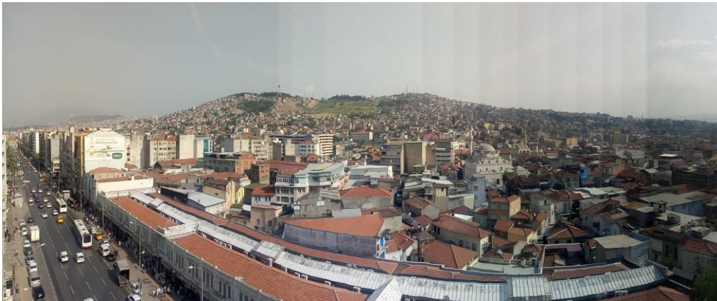
Resim 1.4 : Fevzi Paşa bulvarından Basmane tren garına uzanan temsili eşik. Eşiğin fotoğrafta görünen üst kısmı heterotopik uzam olarak Namazgah, Tilkilik, Kapılar, Kadifekale ve Ballıkuyu mahalleleri.

‘Heterotopyalar her zaman bir açılma ve kapanma sistemi gerektirirler; bu, heterotopyaları hem tecrit eder hem de nüfuz edilebilir kılar’ (Foucault, 2016: s. 300). Bu soyutlamayı Basmane (Namazgah ve Kapılar) bölgesi için somut bir analize çevirmek gayet mümkün. Fevzi Paşa bulvarından başlayıp Basmane tren garı boyunca uzanan hat; namazgah ve kapılar mahallelerini – bu mahallelerin tepe yamacında kalan kadifekale ve ballıkuyu gibi gecekondu semtlerini de dahil ederek- sınıfsal ve kültürel bir eksenle İzmir’in ‘elit’ merkezinden ayırmış durumdadır.