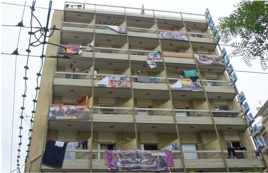
resim 7.2: City Plaza