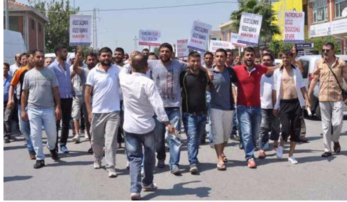
Resim 6.2: 2014 mülteciler karşıtı eyleme dönüşen yürüyüş. İzmir Ayakkabıcılar sitesi

Buna karşılık mülteci işçilerle deneyimlerin içerisinde oluşan türdeşlik algısı sayesinde, konuksevmez söylem ve pratikler aşılabilmektedir. Bu tablo, konukseverlik pratikleri için bir türdeşlik algısının –bir kez daha- zorunluluğunu göstermektedir. Ancak böyle bir türdeşlik algısının, konukseverlik pratikleri öncesi zorunlu bir uğrak olarak kavramamız gerektiğini de dile getirmektedir. Ayakkabı işçileri mülteci işçilerle türdeş bir kimliğe sahip olduklarını, türdeş bir kimliğe dahil olanlar gibi bir arada hareket ettiklerinde kavramışlardır. Ev sahibi-misafir karşıtlığını ortadan kaldıran ilişki, bir arada hareket etmenin sonuçlarına yönelik kavrayışla belirlenen işte böyle bir türdeşlik algısıdır.