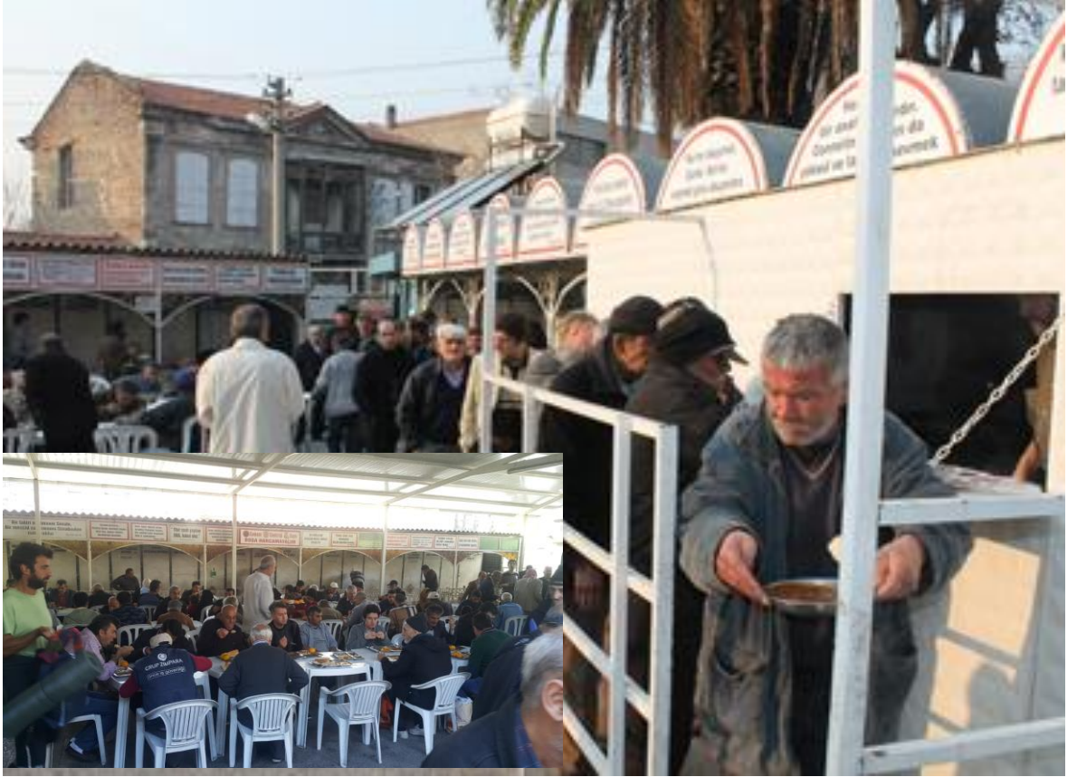
resim 4.2: Hatuniye Camii Derneğinin her akşam caminin avlusunda verdiği yemek