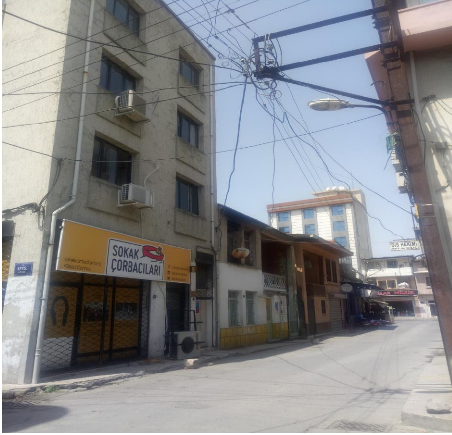
Resim1.6: Kapıların 'ütopya' sokağı. Yan yana gelmiş kapılar inisiyatifi, sokak çorbacıları, deri ve kundura işçileri, konak mülteci merkezi.

Kapılar mahallesinin kendinde var olan sosyo-kültürel çeşitlilik, inisiyatifin bu çeşitliliği dayanışma içerisinde bir araya getirme çabalarına zemin oluşturmuş diyebiliriz.