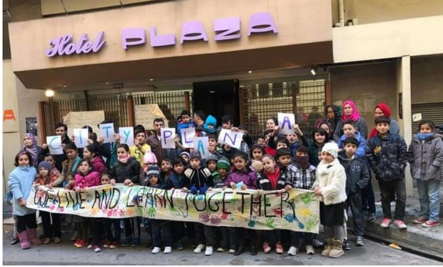
Resim 7.1: City Plaza mülteci dayanışma ve barınma merkezi

arasında kurduđu türdeş çokluk nedeniyle; ‘aynı’ zeminde buluşulan hakikatler etiğinin yaşama geçmesini sağlamaktadır. City Plaza örneğinde işgal mekanının, mültecileri karşılama pratikleriyle beraber konukseverlik ve hakikatler etiğinin reel politik içerisinde birbirini tamamlayan bir bağlamı olduğunu betimlemek mümkün olabilmektedir.