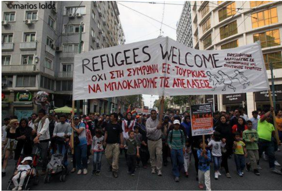
Resim 7.3: 1 Mayıs 2018. Plaza insanların yürüyüşü

kaldırılmasına yönelik pratiklere dönüşebilmektedir. City Plaza’da bir araya gelen özneler, herkes için geçerli bir hakikatin ortak taşıyıcıları olarak aynı yaşam alanının inşasında görev almaktadırlar. Bu hakikat; mülteci krizi bağlamını da kapsayacak bir zeminde, içerisi ve dışarısı arasında eşitsizlik üreten her türlü sınırın ortadan kaldırılması gerektiğine dair bakış açısı ile beraber inşa edilmektedir. Ancak Lukas’ın kendi toplumsal konumuna atıfla işaret ettiği verili hakikat, yani toplumsal yaşamın eşitsizlik örüntüleriyle yapılaştığı gerçeği, bir hakikatin inşası etrafında bir araya gelen özneler arası etkileşimin denklik mantığında gerçekleşmediğinin somut temsili olarak görülmelidir. Bir hakikatin inşası etrafında bir araya gelen özneler arası denklik mantığını tahsis edecek olan, verili hakikatin ortaya çıkarttığı ayrıcalıklı öznelerin konukseverlik etiğine dayalı pratikleri olduğunu söyleyebiliriz.