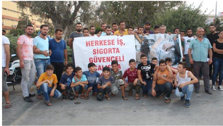
Resim 6.3: 2017 mültecilerle ortak basın açıklamasından. İzmir Ayakkabıcılar sitesi