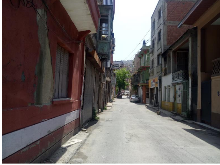
Resim 1.3: Kapılar mahallesinin Aziz Vukolos kilisesine çıkan ara sokağı. Sağda sırasıyla; Kapılar kolektifi, üst katı Deri ve Kundura işçileri derneği, bitişiğinde Sokak Çorbacıları Derneği ve üstündeki üç katta Konak Kent Konseyi Mülteci Merkezi.

olan kapılar inisiyatifi, sokak çorbacılar derneği ve kent konseyi mülteci meclisine bir sokak mesafede olmasıdır.