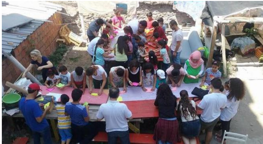
Resim 4.1: Kapılar iç mekan. Çocuklarla yapılan origami atölyesi.