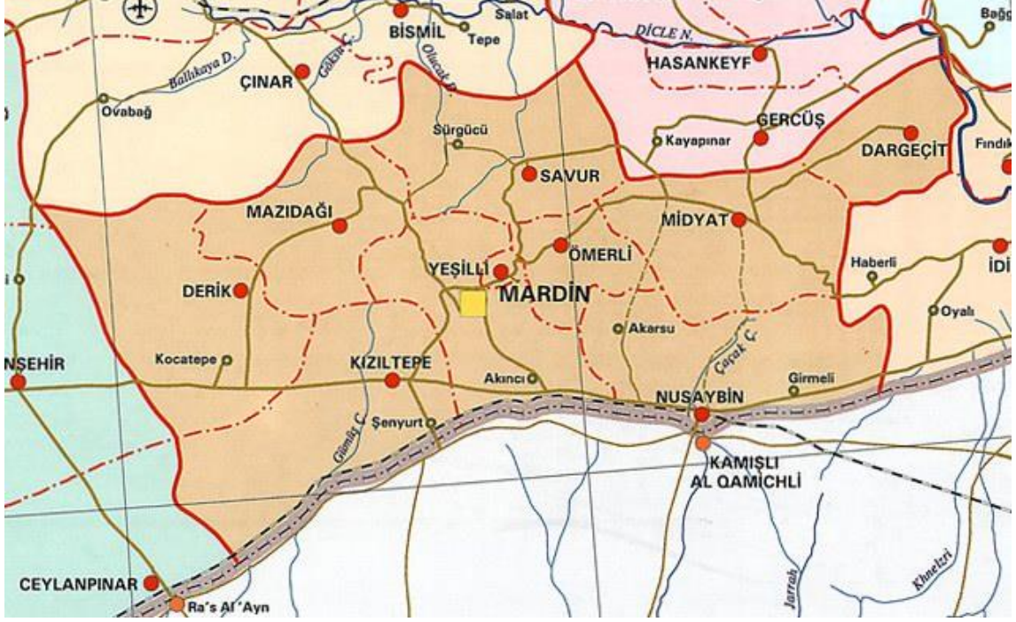
Harita 2: Mardin ili ve Kızıltepe İlçesinin Coğrafi Konumu ve Sınır Hattı

Suriye’de yaşanan Arap Baharı sonrası çıkan iç savaş ve karışıklıktan kaçan insanların bir kısmı Mardin’e sığınmıştır. Göç idaresi Genel Müdürlüğü’nden 10.10.2019 tarihi itibarıyla elde edilen verilere göre Mardin genelinde kayıt altına alınan göçmen sayısı 87.752’dir. Bu sayının 33,345’i Kızıltepe ilçesinde yaşamaktadır bu da Mardin’e göç eden Suriyelilerin yaklaşık %38’ine denk gelmektedir. Bu da gösteriyor ki Mardin’e göç eden nüfusun büyük çoğunluğu Kızıltepe ilçesinde yaşamaktadır.