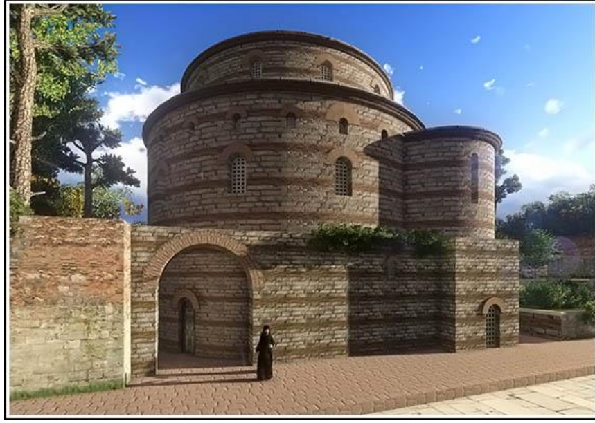
Görsel 4.2. Azizler Karpos ve Papylos Kilisesi. ( www.byzantium1200.com)

Kampusta bir kortej hazırlanmaktadır. İmparator önünden haçlar ile asalar taşındığı bir arabayla yola çıkar. Patrikios unvanı taşıyan kişiler ya da imparator yanında kimi istemişse onlar imparatora eşlik ederler. Bu kortej Konstantinos forumuna vardığında, imparator arabadan iner ve eparkhos ile senato mensuplarını kabul eder. Burada ona bir taç takdim edilir. 680 İmparator buradan arabaya binerek senatörler ve archonlarla beraber horologion'un karşısındaki augustationdan 681 geçerek Ayasofya kilisesine girer. Büyük kapıdan içeri girdiler, narteks kısmına yine bir moutatorion kurulur. İmparatorun tacı, praipositos tarafından altara konur ve altın dağıtılır. Bunun ardından kendi locasına geçerek incil dinler. Piskopos, imparatorun başına tacı yerleştirir, sonra kilise törenlerinde olağan olduğu üzere, imparator ruhbana ödeme yapar ve saraya döner. 682