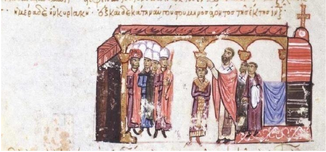
Görsel 4.10. II.Nikephoros Phokas'ın taç giyme töreni ( Skyl. fol 145v.)

Skylitzes kroniğinde imparator II. Nikephoros Phokas (963-969)'ın taç giyme törenini tasvir eden bir minyatür bulunmaktadır.