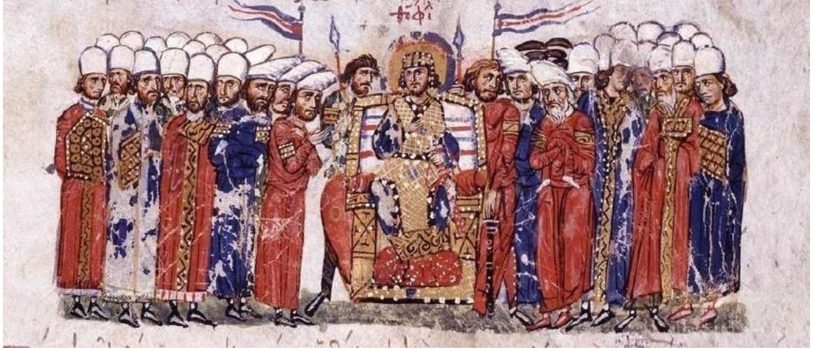
Görsel 4.8. İmparator Theophilos'un taç giyme töreni (Skyl. fol 42v.)

İmparator Theophilosun halefi ve oğlu olan III. Mikhael (842-867) taç giydiğinde, üç yaşındaydı ve Onun adına annesi Theodora naibe olarak yönetimi üstlendi. 740 Skylitzes kroniğinde onun tahta çıkışıyla da ilgili bir minyatür bulunmaktadır. “ο βα[σιλευς] μ[α]χ[αηλ] (tr. Basileus, Mikhael)” başlığı altında, sağ işaret parmağını havaya kaldırmış şekilde, muhtemelen konuşurken tahtta oturmakta olan küçük bir çocuk görülmektedir. Bu duruş onun tasvir edildiğini düşündürür. Diğer tahta çıkma sahnelerinden farklı olarak ilk kez bir tahta çıkma töreni kapalı bir mekân içerisinde resmedilmiştir. Arka planda bir salon görülmektedir. Salonun çatısı görünürken imparatorun salonun tam ortasında olduğu izlenimi verilmiştir. Sağında ve solunda yine, kıyafetlerinden saray erkânı oldukları anlaşılan bir grup resmedilmiştir. İmparatorun sol tarafındaki grubun üzerinde halk, kitle anlamına gelen 741 “ο λα[ο]ς (tl. ho laos) kelimesi yer almaktadır.