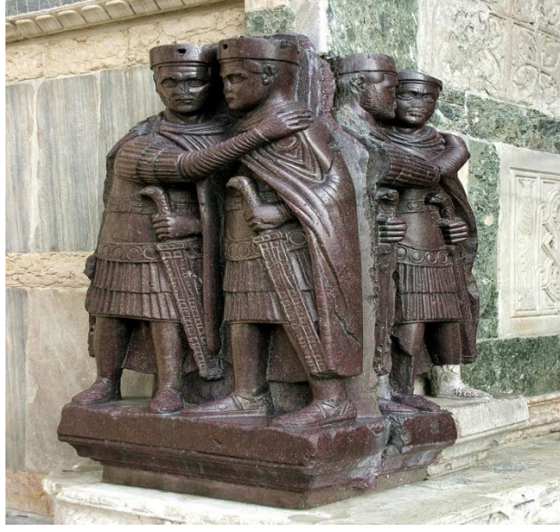
Görsel 1.2 Dört Tetrark Heykeli

tek başına augustus ilan edildi. 53 Ancak, Stephenson'a göre Konstantinus, askerlerin değil augustusların aday göstermesiyle, meşru bir biçimde hükümdar olmak istediği için augustus Galeriusla görüşerek kaesar olmak istedi. 54 Hükümdarlık için girişilen iç savaşların sonunda kazandığı galibiyetler sayesinde, Konstantinus, augustus ilan edildikten yedi yıl sonra tetrarşi dönemini sonlandırarak imparatorluğun tek hükümdarı oldu. 55