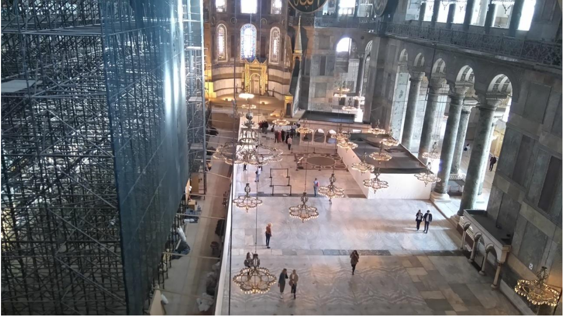
Görsel 2.6. Ayasofya'da bulunan imparatoriçe locasından omphalion ile altın görünümlü

edinilmiş bir kişi olan müstakbel hükümdara verecekleri destek de önemliydi. 109 Bu destek, dul kalan imparatoriçenin evleneceği kişinin hükümdar olabilmesini sağlayan bir geleneğe dayanıyordu. Dul imparatoriçe imparatorluğu yönetecek yeni bir eş seçme hakkına sahipti. 110 Halk arasına nadiren çıkan imparatoriçeler, düzenli olarak kiliseye giderler ve kilisede kendilerine ait özel bir yerde ayinlere katılırlardı. 111