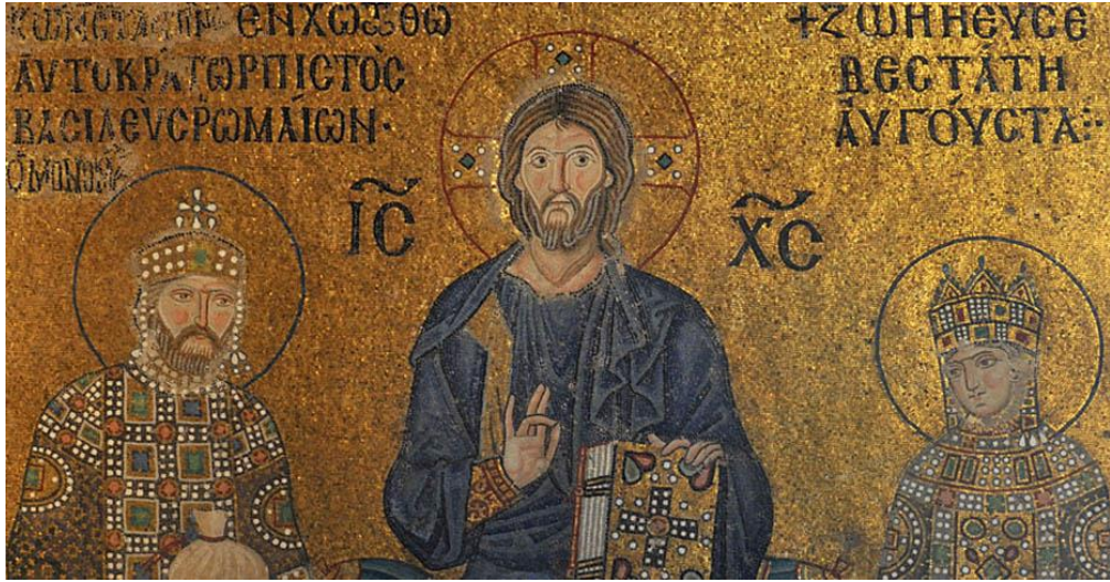
Görsel 2.2. Zoe Mozaiği ( https://ayasofyamuzesi.gov.tr/tr/mozzoe-mozai%C4%9Fi )

uyguladığı despotik yetkinin genişliğini ifade etmek şeklinde tanımlamakta ve onu Roma cumhuriyetindeki imparator unvanının karşılığı kabul etmektedir. Basileus unvanını ise Roma imparatorluğundaki augustus unvanının karşılığı olarak görür. İlerleyen yüzyıllarda ise basileus'un hükümdarı tamamen karşılayan bir unvan olmaktan uzaklaşıp, autokrator'un daha uygun bir hükümdarlık unvanı haline geldiğini düşünmektedir. 74