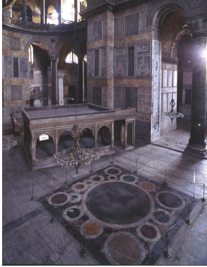
Görsel 4.13. Omphalion. ( https://ayasofyamuzesi.gov.tr/tr/i%C3%A7momphalion )

Sonuç olarak kaynaklarda, detayları ile yer edinmiş hemen hemen bütün taç giyme törenleri incelendiğinde, çok hızlı olmayan ancak çok büyük dönüşümlerin gerçekleştiği bir süreç ortaya çıkmaktadır. Ordu artık, eskisi gibi ön planda değildir. Kalkan üzerine çıkarılıp havaya yükseltme, bilindiği kadarıyla en son III. Andronikos'un taç giyme töreninde görülmüştür. Daha önce de bahsedildiği gibi kalkan üzerine çıkarılıp havaya yükseltme oldukça içerdiği mesaj güçlü olan bir harekettir. Bunun kesin bir biçimde terk edilmemiş olması ama aynı zamanda törensel geleneğin ayrılmaz bir parçası olma durumunu da koruyamamış olması ilginç bir ayrıntıdır. Taç giyme törenine sahne olan mekan olarak Ayasofya ön plandadır. Ayasofyada bulunan ve imparatorların taç giyme törenlerinde taçlarını giydikleri yer olan omphalionun büyük dairesi, imparatorların üzerine çıkartıldığı kalkanları anımsatmaktadır. Saray ve Ayasofya arasında bir hat çizmek mümkündür. Hatırlanacağı üzere erken dönem ve orta dönemin ilk yüzyıllarında taç giyme töreninin gerçekleştiği mekan ve mntıklar çok