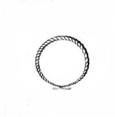
Görsel 4.1. Torques. (DRGA, 1890)

başına takılmış ve bu konu da böylece çözüme kavuşturulmuştur. 633 Teitler, Julianus'un kalkan üstüne çıkartılarak havaya yükseltelen ilk Bizans imparatoru olduğunu yazmaktadır. 634 Ayrıca, seçilmiş kişinin başına, hükümdarlığı işaret eden bir nesnenin takılmasının gelenek olduğu vurgusu da dikkat çekmektedir. Ammianus Marcellinus'un anlatıklarına bakılırsa, Julianus'un askerleri tarafından başına bir torques takılarak imparator seçilmesi, bir çeşit ilk aşama gibi görünmektedir. Ammianus Marcellinus, metnin devamında, Julianus'un askerlerine olası bir kargaşayı bertaraf etmek için beşer altın 635 para ve birer pound gümüş para dağıtmayı vaat ettiğini aktarmaktadır. Bir süre sonra Vienne'de quinquennial oyunları sırasında Julianus, parıltılı taşlarla süslü görkemli bir diadem ile ucuz bir taç takarak ve paludamentum giyerek augustus oluşunu kutlamıştır. 636