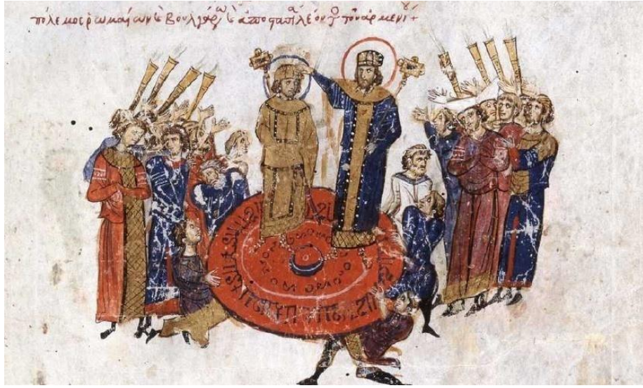
Görsel 4.6. I.Mikhael'in kalkan üzerinde havaya kaldırılması (Skyl. fol.10v)

yükseltilmiş görülmektedir. Bir önceki minyatürdeki gibi giyinmiş bir figür, imparatorun sol tarafında dikilmekte ve onu taçlandırmaktadır. Theophanes Kroniğinde I.Michael'e tacı takan kişinin patrik Nikeforos olduğunu yazmaktadır 727 dolayısıyla bu figürün bizzat patriğin kendisi olduğu düşünülebilir. Kalkanın etrafındaki kalabalığın arka tarafında trampet çalan bir grup bulunmaktadır. Havaya kaldırılmış imparatoru alkışlayan çok sayıda el çizilmiştir. 728 Ancak metnin içeriğinde kalkan üzerinde yükseltirme geleneği ile ilgili bir anlatı bulunmamaktadır. 729