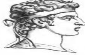
Görsel 2.4. Diadem (DRGA, 1890)

laurea ) 80 kabul ederdi. İmparatorluk otoritesinin sembolü olan bu tacın, VI. yüzyılda küçük bir kalkan benzeri, alnı çepeçevre saracak şekilde takılan çift inci sıralı olduğu düşünülür. İmparatorluk tacının en erken biçimi, şeref ve asaletinin başlıca simgesi 81 olan bu taca diadem 82 denirdi. 83