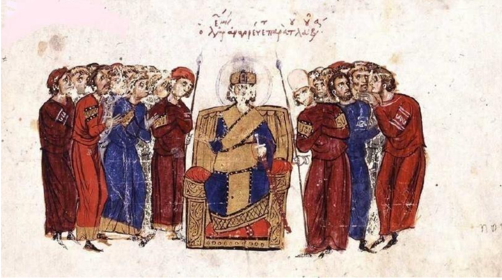
Görsel 4.7. V.Leon'un tahta çıkışı (Skyl. fol. 12v)

V.Leon olarak tahta çıkan imparator Ermeni Leon, tahta çıkmadan önce anatolikon themasının strategosuydu 732 . Bu olay, Theophanes tarafından şu şekilde anlatılmaktadır;