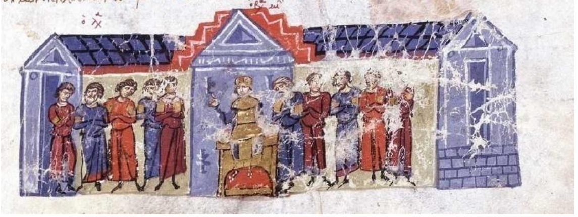
Görsel 4.9. III.Mikhael'in taç giyme töreni (Skyl. fol.62r.)

Törenler Kitabı'nın 1. Cildinin 38. Bölümünde, bir imparatorun taç giyme töreni anlatılmaktadır. Törenler Kitabının X. yüzyıla ait bir metin olması dolayısıyla bu anlatım için dönemin taç giyme törenini yansıttığı düşünülebilir. Eserde aktarıldığına göre;