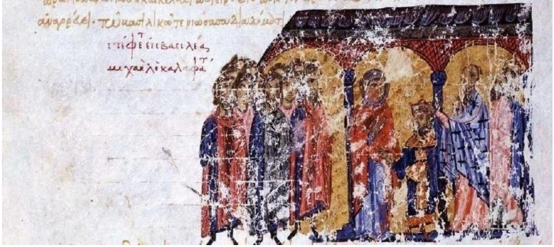
Görsel 4.12. V.Mikhael'in taç giyme töreni (Skyl. fol.218v.)

Skylitzes kroniğinde taç giyme töreni ile ilgili minyatür bulunan bir diğer imparator, V.Mikhael (1041-1042)dir.