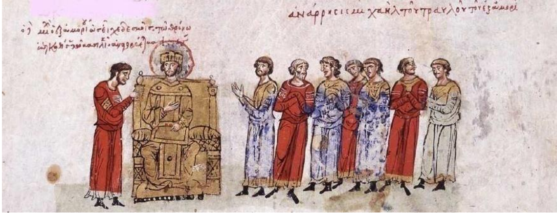
Görsel 4.8. II.Mikhael Travlos'un tahta çıkışı (Skyl. fol.26v)

Minyatürde, tahtta oturmakta olan imparatorun başının üzerinde “Çiçek işlemeli şeritler tutan Amoriondan (gelme) Mikhael, krallığa ait tahta oturmuş olarak basileus ilan edilmektedir.” 737 İfadesinin olduğu bir yazıt vardır. Sol tarafında sıraya girmiş halde resmedilmiş olan ve sivil memurlara özgü kıyafet giymiş bir grubun üzerinde “Amoriondan (gelme) Mikhael Traulos’un halka açık ilanı” 738 yazmaktadır. II.Mikhael, zindandan çıkarılarak ve “elleri hala yıkanmamış halde” Ayasofya’ya giderek piskoposun elinden tacı kabul etti ve halk tarafından alkışlandı. 739