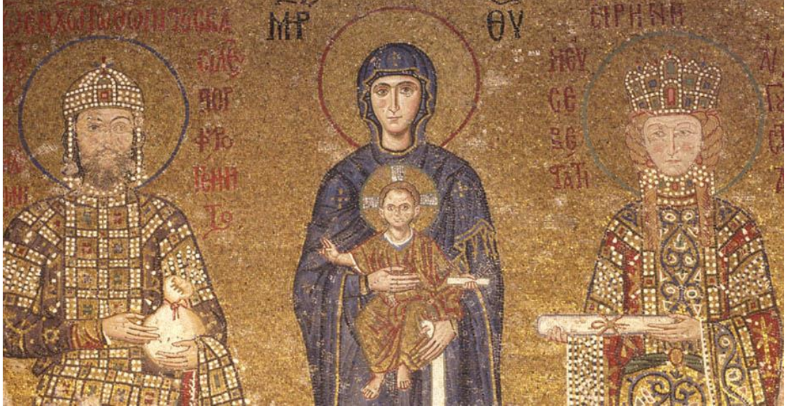
Görsel 2.3. Komnenoslar Mozaïği ( https://ayasofyamuzesi.gov.tr/tr/mozkomnenoslar-mozai%C4%9Fi )

Roma'dan miras alınan bir diğer şey de hükümdarın atanma şekliydi. Hükümdar seçimle iş başına geliyordu ve Bizans imparatorluğu ile birlikte Hıristiyanlaşan yapı içerisinde bu seçimin Tanrı'nın emri ile yapıldığına ve seçilen kişinin tanrının lütfü ile bu makama geldiğine inanılıyordu. 75 Bir İmparator, piskpos tarafından taçlandırılırken aslında Tanrı tarafından o makama atanıyordu, tacı takanlar sadece aracıydılar. 76 Roma imparatorluğu'nda askeri başarılar kişinin hükümdarlık makamına yükselmesinde büyük önem teşkil ediyordu. Hükümdarın iş başına geldiği seçim yetkisi ordu ve senatoya aitti, ordu veya senato bir kişiyi öne çıkarıyor onu alkışlıyordu. Alkışlanmak o kişinin senato ve ordu nezdinde hükümdar ilan edildiği anlamına geliyordu. Ancak hükümdarın göreve başlaması için halkın da alkışa dâhil olması gerekiyordu. 77 Tahta çıkacak imparatorun seçiminde, ordu, halk ve senatonun dünyevi alkışlama hareketi, en önemli faktör olarak kaldı. Bury, halkın alkışmalasını Roma'daki populus romanus 'un yaptığı alkışlamanın bir devamı olarak görmekte ve bunu bu geleneğin sürdürülmesine yönelik bir istek olarak yorumlamaktadır. 78 Bir kere alkışlanan imparator, büyük kudretin, imparatorluk otoritesinin sahibiydi. 79 Erken dönemlerde, askerler, zafer kazanmış liderlerini kalkanın üstüne kaldırırđı. Sonra ona, muvaffakiyet bahşedilir ve O da muzaffer olarak muzaffer tacı (lat. corona aurea ), ya da defne tacını (lat. corona