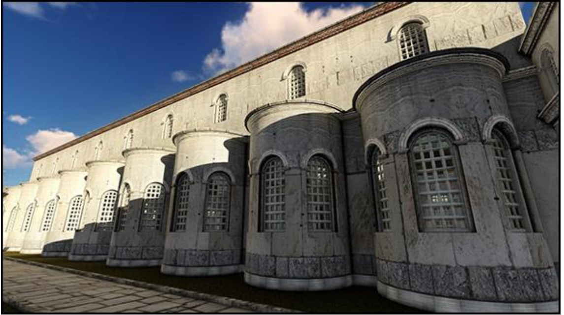
Görsel 4.4. On dokuz akkubita salonunun yan cepheden görünüşü.