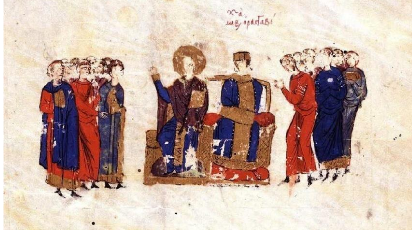
Görsel 4.5. I.Mikhael'in tahta çıkışı (Skyl. Fol.10r.)

oturmakta olduğu tahtın yanında bulunan bir başka tahtta, başında bir hale ile resmedilmiş olarak, stikharion 720 , phelonion 721 ve epitrahilion 722 giymiş halde bir figür bulunmaktadır.