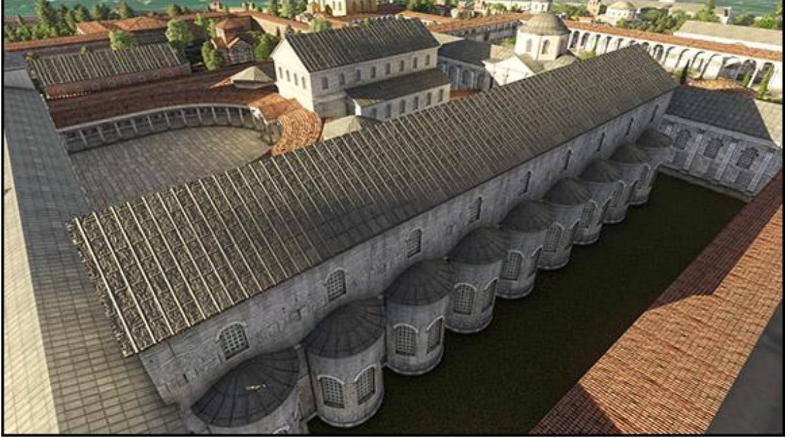
Görsel 4.3. On dokuz akkubita salonunun dış cepheden görünüşü.

beslemeyeceğine ve soğukkanlılıkla devleti yöneteceğine dair yemin etmesini istediler. Bu yemin edilir edilmez, hipodroma geçti. Araba yarışlarında senatörlerin imparatorun önünde eğildiği yer olan salona geçildi. Altın renk bir clavi ile bir sticharion, diveteson ve kemer kuşandı. Tozluk ve sandallarını giydi. Başı açık şekilde kathismaya gitti. 696