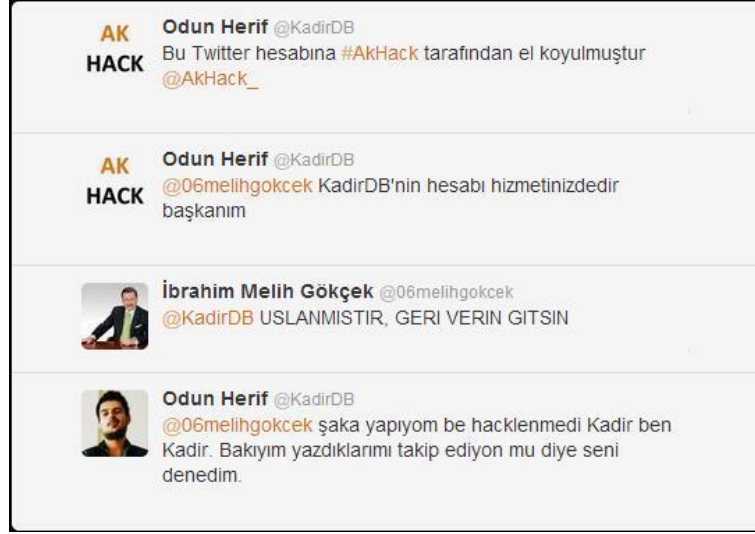
Görsel 2.1: @KadirDB ve @06melihgokcek arasındaki diyalog (http-13).