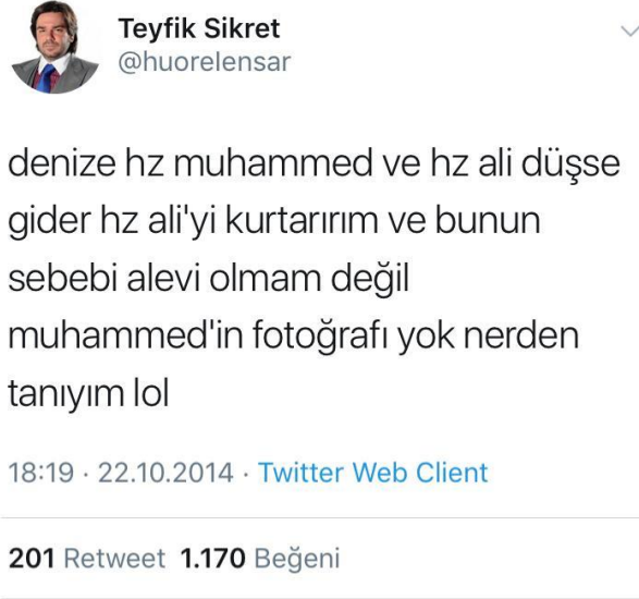
Görsel 2.8: Hz Muhammed'e yönelik saldırgan mizah içeriği ( http-25 ).

Örnek olarak verilen bu içerikler hem İslam dinine hem de Hz. Muhammed'e yönelik nefret söylemi içermektedir. Müslümanlar tarafından kutsal sayılan değerlere hakaret, aşağılama, alay içeren bu Tweetler “mizah” kisvesi altında üretilmekte, toplumsal anlamda büyük tepkilere yol açmaktadır.