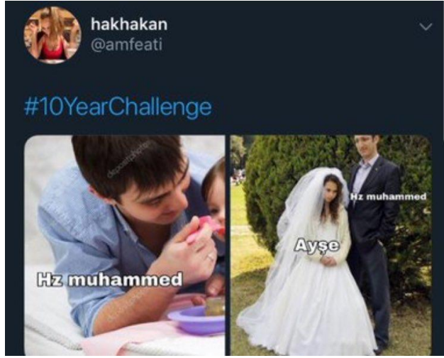
Görsel 2.5: Hz. Muhammed ve Hz Aişe'ye yönelik saldırgan mizah içeriği ( http-22 ).