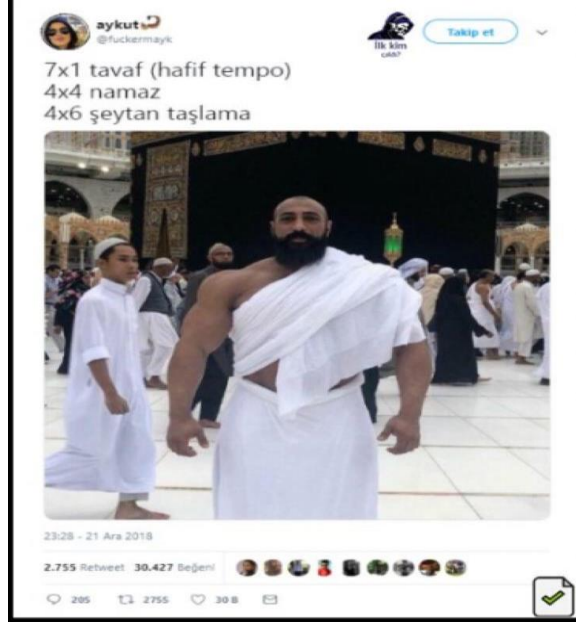
Görsel 2.7: Hac ibadetine yönelik saldırgan mizah içeriği ( http-24 ).