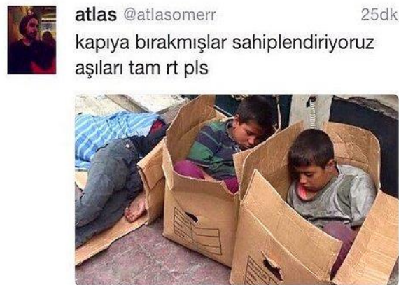
Görsel 2.26: Yoksulluk üzerine yapılan saldırgan mizah 3 (http-45).