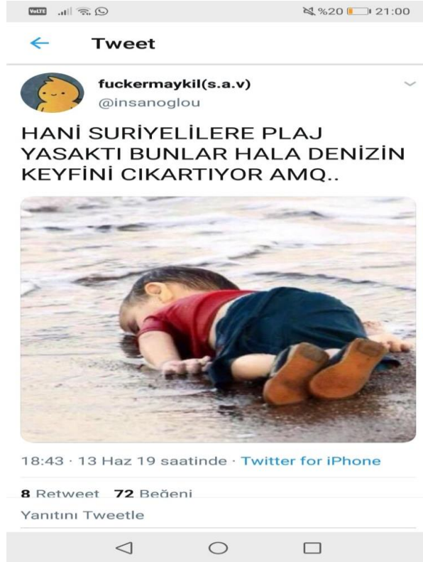
Görsel 2.18: Savaş mağduru Suriyeli çocuğa yapılan saldırgan mizah içeriği 21 ( http-36 ).