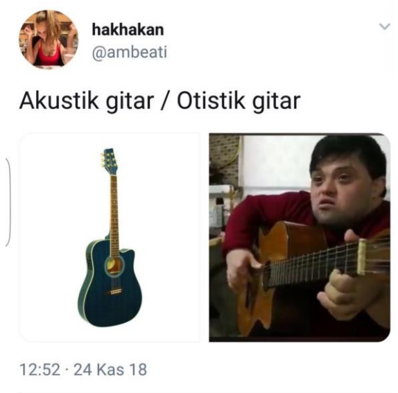
Görsel 2.22: Down Sendromlu gence yapılan saldırgan mizah içeriği (http-41).