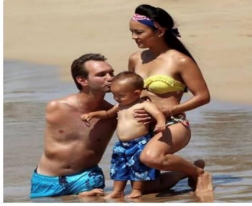
Görsel 2.23: Engelli bireye ilişkin saldırgan mizah içeriği (http-42).

ÇOK GÜZEL BİR AİLE TABLOSU ANNE, ÇOCUK, BA..