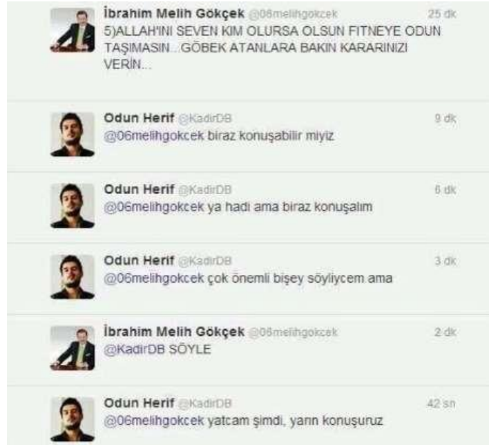
Görsel 2.2: @KadirDB ve @06melihgokcek arasındaki diyalog2 (http-14).

Burada @kadir06 isimli kullanıcı Melih Gökçek'i saldırı, hakaret unsurları içerisinde barındırmadan eğlence amacıyla ( lolz ) trollemektedir. @kadir06, Melih Gökçek ile girdiği bu diyaloglar sayesinde Twitter mecrasında takipçi sayısını arttırmış ve mikro bir şöhrete ulaşmıştır. @kadir06'nın 2019 yılı itibariyle 2,8 milyon takipçisi bulunmaktadır (Bağrıyanık, 2018, s. 51-52).