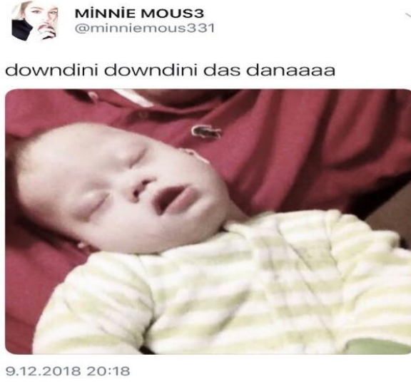
Görsel 2.19: Down Sendromlu bebeğe yapılan saldırgan mizah içeriği (http-38).