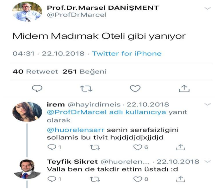
Görsel 2.9: Madımak Oteli olayına ilişkin saldırgan mizah içeriği (http-26).

Troller genel olarak mezhepsel bağlamda Aleviliği hedef alarak saldırgan mizah yapmaktadır ve Aleviliğin değerlerine yönelik alay ve aşağılama ile mizah vurgusunu ön plana çıkarılarak Tweetler atılmaktadır. Hz. Ali, Madımak Olayı, Alevi katliamlarında yer alan “X” işareti gibi aleviler için hassas fenomenler üzerinden genellikle mizah üretilmeye çalışılmaktadır. Diğer mezheplere yönelik de saldırgan mizah Tweetleri mevcut olsa da en çok Alevilik üzerine yapıldığı gözlemlenmiştir. @mevzualevileree isimli hesap sadece Alevilere yönelik saldırgan mizah üretmektedir.