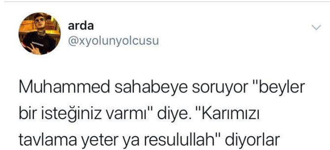
Görsel 2.6: Hz Muhammed'e yönelik saldırgan mizah içeriği ( http-23 ).