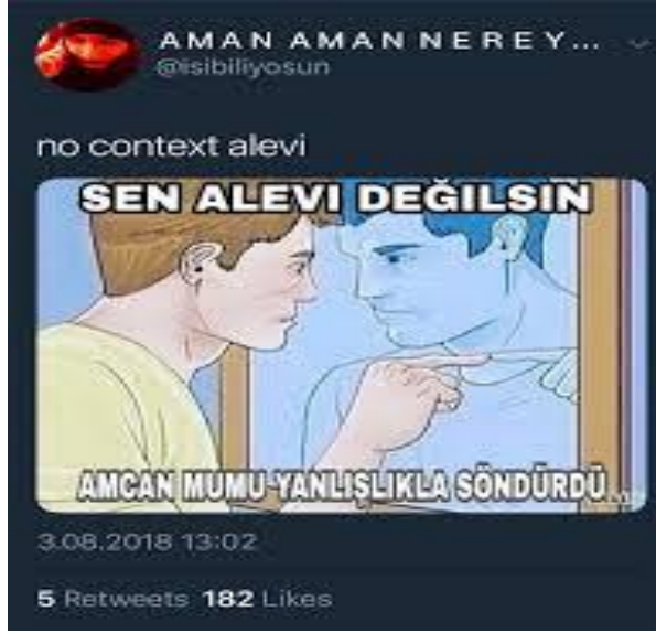
Görsel 2.10: Alevilere yönelik saldırgan mizah içeriği ( http-27 ).