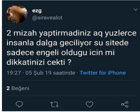
Görsel 2.21: Engelli bireye ilişkin saldırgan mizah içeriğinin devamında trolün verdiği cevap (http-40).