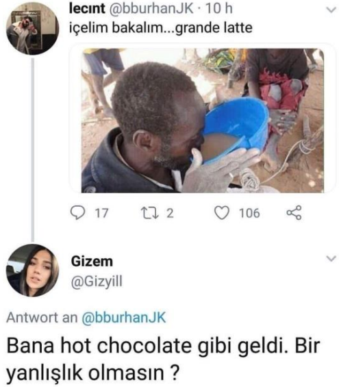
Görsel 2.24: Yoksulluk üzerine yapılan saldırgan mizah 1 (http-43).