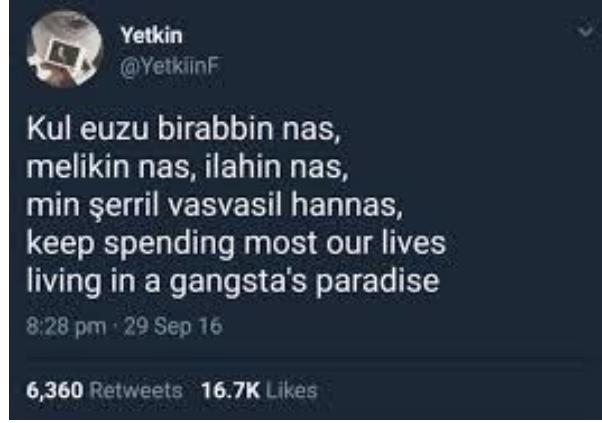
Görsel 2.4: Kur'an ayetlerine ilişkin saldırgan mizah içeriği ( http-21 ).