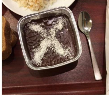
Görsel 2.12: Alevilerin evlerinin kırmızı boya ile işaretlendiği simgeye ilişkin saldırgan mizah içeriği (http-29).

Alevilere ve diğer mezheplere yönelik üretilen saldırgan mizah içerikleri genel olarak Alevi olmanın “kötü/olumsuz” bir şeymiş gibi lanse edilmesi üzerinden yapılmamaktadır. Aleviler için önemli sembollerin ve değerlerin güldürü konusu edilmesi üzerinden yapılmaktadır. Bu saldırılar genel olarak Alevilerin kimliklerini ve hafızalarını oluşturdukları konulara yöneliktir.