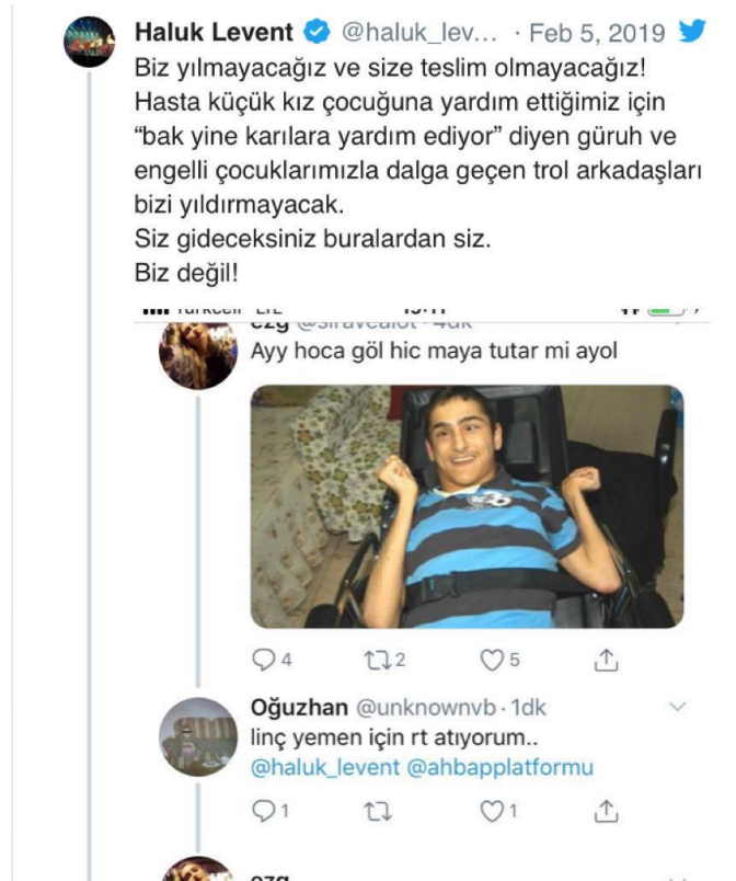
Görsel 2.20: Engelli bireye ilişkin saldırgan mizah içeriği (http-39).