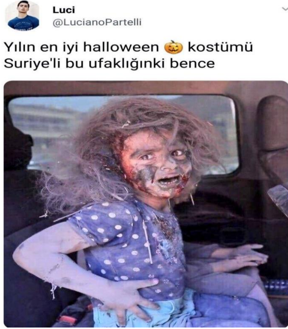
Görsel 2.17: Savaş mağduru Suriyeli çocuğa yapılan saldırgan mizah içeriği ( http-35 ).