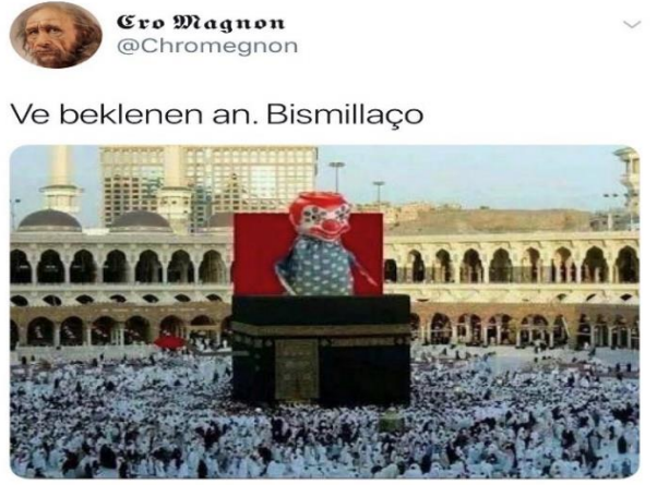
Görsel 2.4: @Chromegnon isimli kullanıcının lulz içeriği (http-15).

@Chromegnon kod adlı trol, İslam dininin en büyük değerlerinden biri olan Kâbe ile alay etmek için photoshop programına başvurmuştur. Bismillah kelimesinin başını, palyaço kelimesinin sonunu alıp iki kelimeyi birbirine harmanlayarak ortaya “bismillaço” kelimesini çıkarmıştır. Bishop’ın ‘put kırıcı’ ( Iconoclast ) sınıfı içerisinde değerlendirebileceğimiz bu trolleme biçimi İslam değerlerini benimsemiş olan kullanıcıları şok etmek için yapılmış olduğu söylenebilir.