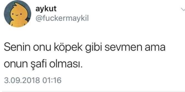
Görsel 2.11: Şafilik mezhebine ilişkin saldırgan mizah içeriği ( http-28 ).