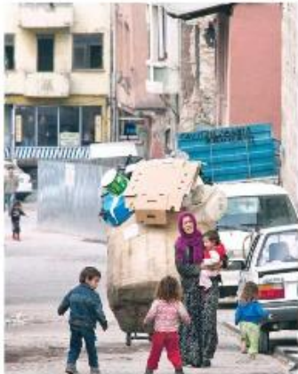
Yıkık binalarda yaşam savaşı veren sığınmacı kadınlar ve çocuklar. (VEDAT ARIK)

Yoksa tarihe adımız ortak olarak yazılacaktır.