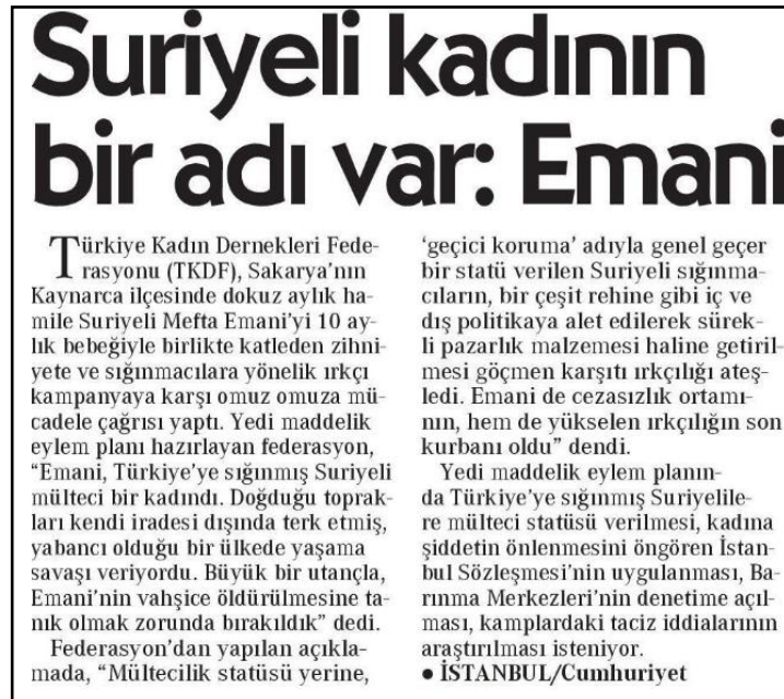
Görsel 4.11. Cumhuriyet Gazetesi'nin ideolojik duruşunun habere hükümeti eleştirel anlamda etki etmesine bir örnek (14.07.2017)

Gazetelerin ideolojik duruşlarının haber içeriklerinde kendini nasıl gösterdiği tek tek inceledikten sonra aynı konunun 2 farklı ideolojik duruşa sahip gazetelerde nasıl ele alındığı araştırılmıştır. Bunun için nitel analiz örneklemini dışındaki bir Cumhuriyet Gazetesi haberi ve aşağıda verilen ve örnekleme dahilinde olan bir Sabah Gazetesi haberi tercih edilmiştir.