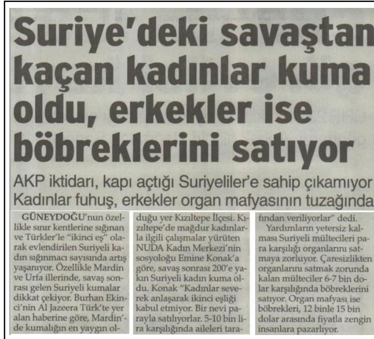
Görsel 4.6. Sözcü Gazetesi'nin Suriyeli sığınmacı kadınlar konusunda hükümeti eleştirmesi (31.07.2014)

için de aynı durum geçerlidir. Kaldı ki kumalıkla ilgili sadece 1 haber yayımlamıştır. İkinci nokta gazetenin ideolojik duruşu konuya olan bakış açısını belirlemiştir. Gazete hangi konuda haber yapacağına karar verdikten sonra haberi nasıl çerçeveleyeceğine karar vermiştir. Şöyle ki eğer hükümeti destekleyen bir gazeteysse sığınmacılar konusunda haber dili içeriği ve pozitif olup (olayın iyi, sorunsuz yanları ve sonuçları) zaman zaman hükümete övgüde bulunmuştur. Hükümet karşıtı bir gazeteysse durum tam tersidir. Yani gazetenin haber dili eleştirel, içeriği olumsuz (olayın problemlili tarafları) olup kimi zaman hükümeti eleştirmiştir. Kısacası ideolojilerin farklı olmasına bağlı olarak aynı haber konusu farklı biçimlerde işlenmiştir. Örneğin, hükümete karşıt bir siyasi pozisyonu olan Sözcü Gazetesi'nin sığınmacı kadınlara karşı olumsuz (ayrımcı ve ırkçı) bir bakış açısına sahip olduğu ve hükümeti eleştirdiği görülmektedir. Bu yüzden yaşanan tüm olumsuzluklarda sığınmacı kadınları itham etmekte ve farklı yaftalamalarla itham etmektedir. Fakat diğer yandan sığınmacı kadınlara sahip çıkmadığı gerekçesiyle hükümeti de suçlamaktadır. Bununla ilgili örnek aşağıdadır.