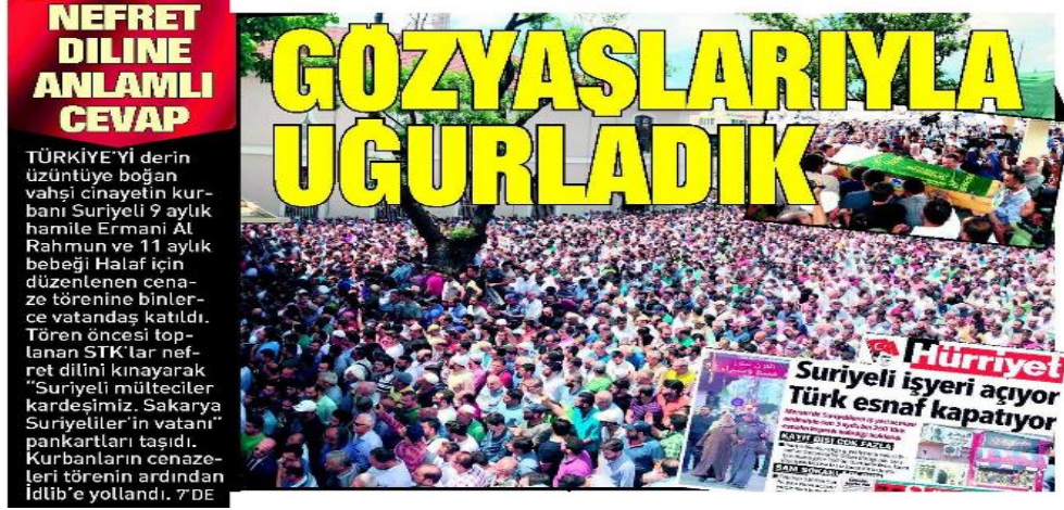
Görsel 4.2. Sabah Gazetesi'nin din vurgusu yaptığı haberin ilk sayfa görüntüsü.

yazılarla halkın nefret diline en güzel cevabı verdiği belirtilmiştir. Ayrıca manşette, Hürriyet Gazetesi'nin “Suriyeli iş yeri açıyor Türk esnaf kapatıyor” manşetli haberinden bir fotoğraf yer almıştır. Bu yolla Suriyeli sığınmacılara yönelik olumsuz yorumda bulunan Hürriyet Gazetesi ve tüm kişi ve/veya kuruluşlar eleştirilmiştir