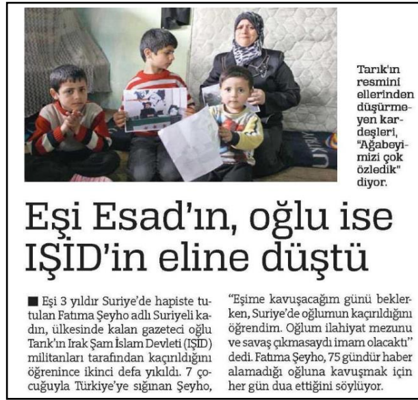
Görsel 4.5. Hürriyet Gazetesi'nin Suriyeli sığınmacı kadın haberlerini annelik imgesi üzerinden işlemesine bir örnek (19.03.2014)

Bu kategorideki sığınmacı kadın haberleri geleneksel rollerden biri olan “annelik” imgesi üzerinden işlenmiştir. Özellikle Suriye iç savaşında çocukları ölen veya hala savaşta olan sığınmacı kadınların çektikleri acılar, üzüntüler ön plana çıkarılarak aktarılmıştır. Bu haberlerden biri, Hürriyet Gazetesi’nde “Kızım öldü oğullarım ÖSO safında” başlığıyla yayımlanmıştır. Haberde kızı hastalık sebebiyle ölen ve oğullarından biri hasta, diğer ikisi ise Suriye’de savaşta olan sığınmacı kadının yaşadıkları anlatılmıştır. Başka bir haberde ise 7 oğluyla birlikte Suriye’deki savaştan kaçıp Türkiye’ye gelen sığınmacı kadının, 3 yıldır hapiste tutulan eşinin ardından bir oğlunun da IŞİD’in eline düşmesi üzerine yaşadığı üzüntü anlatılmıştır. 49