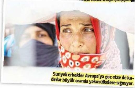
Suriyeli erkekler Avrupa'ya göç etse de kadınlar büyük oranda yakın ülkelere sığınıyor.

Görsel 4.9. Suriyeli sığınmacı kadınların zor durumda oldukları yönündeki Hürriyet Gazetesi haberi (12.01.2016)