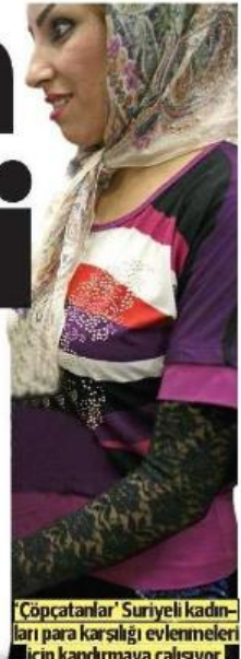
'Çöpçatanlar' Suriyeli kadınları para karşılığı evlenmeleri için kandırmaya çalışıyor.

kızların niyetleri olmasa da evlenmek zorunda kalmasına neden olduğunu ve çeşitli evliliklerin arttığını söyledi. Hudson'a göre bu durum 'dini hassasiyetleri yatıştırmak için evlilik cilası sürülen seks ticaretine' yol açıyor.