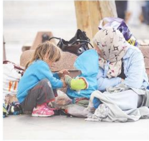
İç savaştan kaçarak Türkiye'ye sığınan Suriyeli kadınların pek çoğu Eminönü civarında sokakta yaşıyorlar.

Sığınmacı kadınlarla erkekler arasında aralık yapan "kadın pazarlama" çeteleri olmuştur.