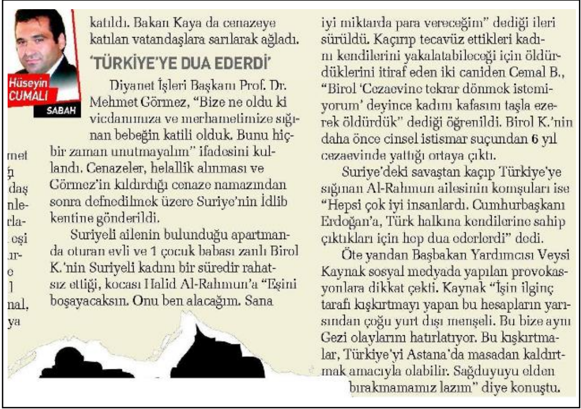
Görsel 4.12. Sabah Gazetesi'nin ideolojik duruşunun habere hükümete destek olması anlamında etki etmesine bir örnek (09.07.2017)