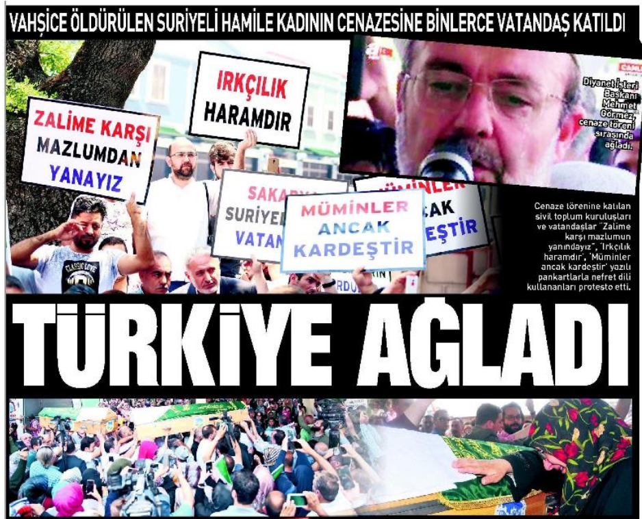
Görsel 4.3. Bir önceki görselde yer alan haberin iç sayfadaki devamı (09.07.2017)

Haberin iç sayfadaki devamında ilk olarak “IRKÇILIK HARAMDIR”, “ZALİME KARŞI MAZLUMDAN YANAYIZ”, “MÜMİNLER ANCAK KARDEŞTİR” yazılı