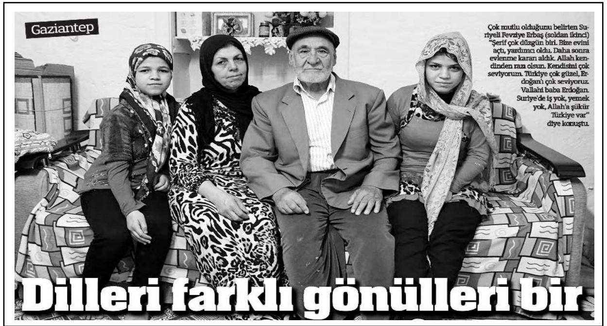
Görsel 4.7. Türkiye Gazetesi'nin ideolojik duruşunun hükümete övgüde bulanarak kendini göstermesine bir örnek (21.06.2017)

Hükümeti destekleyen bir ideolojik duruşu olan Türkiye Gazetesi ise Cumhuriyet Gazetesi'nin tam tersine sığınmacı kadınları sevgi dolu bir eşe, huzurlu, mutlu bir yuvaya ve iyi bir işe sahip insanlar olarak işlemiştir. Bunun için de hükümete övgülerde bulunmuştur. Dolayısıyla gazetenin ideolojik duruşu sığınmacı kadınları iyi ve mutlu yansıtmak ve hükümete övgülerde bulunmak şeklinde yansımıştır.