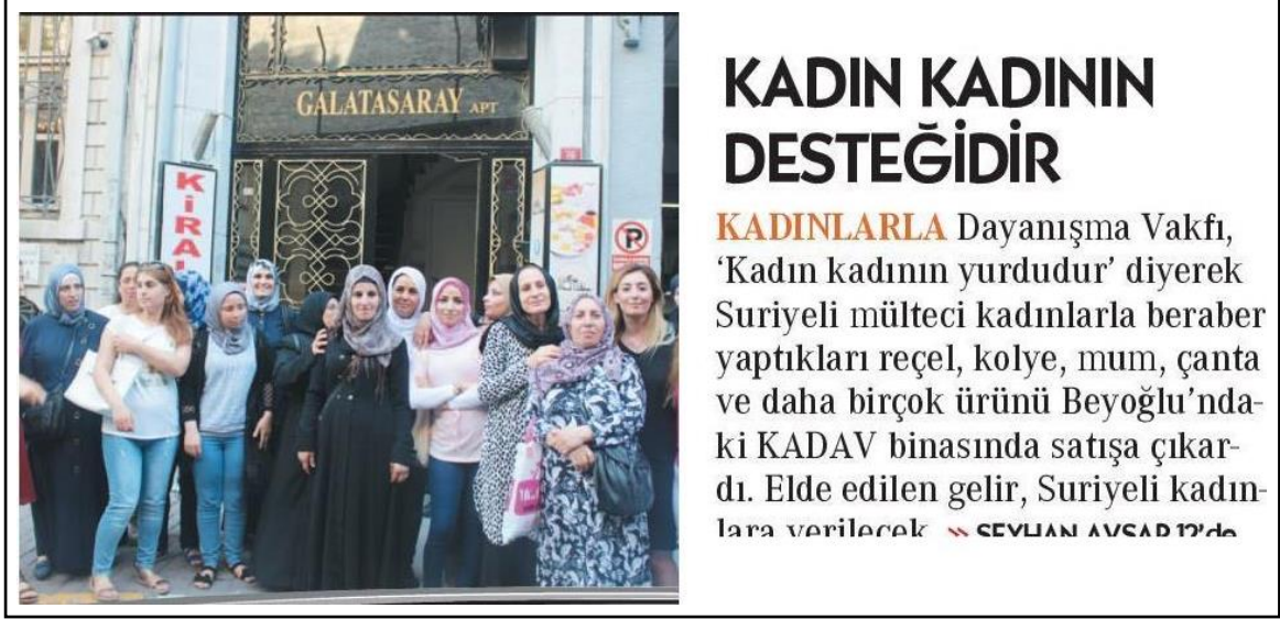
Görsel 4.4. Cumhuriyet Gazetesi'nde Suriyeli sığınmacı kadınların entegrasyonunu konu eden haber (20.08.2017)

“YURDUDUR” kelimesinin tüm harflerinin büyük olmasının bile olumlu bir anlamı vardır. Dolayısıyla haber dilinin çok pozitif olduğu söylenebilir.