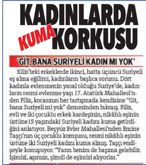
Görsel 4.10. Suriyeli sığınmacı kadınların kumalık konusunda suçlu bulunduğu Hürriyet Gazetesi haberinin bir bölümü (16.02.2016)

Gazetelerin ideolojik duruşlarının haber içeriklerinde kendini nasıl gösterdiği tek tek inceledikten sonra aynı konunun 2 farklı ideolojik duruşa sahip gazetelerde nasıl ele alındığı araştırılmıştır. Bunun için nitel analiz örneklemini dışındaki bir Cumhuriyet Gazetesi haberi ve aşağıda verilen ve örnekleme dahilinde olan bir Sabah Gazetesi haberi tercih edilmiştir.