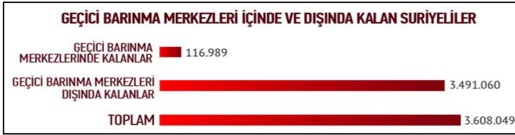
Tablo 2.2. Suriyeli Sığınmacıların Geçici Barınma Merkezlerine Göre Dağılımı 17