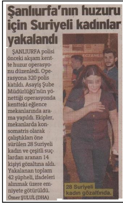
Görsel 4.1. Sözcü Gazetesi'nin Suriyeli sığınmacı kadınları huzur bozduğu yönünde işlemesine bir örnek (26.09.2016)

kadınlar sorumlu tutulmuştur. Oysa ortada bir suç varsa sorumlusu suç fiilini gerçekleştiren kişi ya da kişilerdir. Dolayısıyla suç işlemeyen kişilere sorumluluk yüklenemez, genelleme yapılamaz. Bunun yanı sıra başlıkta ve haber içeriğinde “Suriyeli” kelimesi kullanılarak “etnisiteye” vurgu yapılmıştır. Fakat burada etnisiteye değil “suça” vurgu yapılmalıdır. Çünkü etnisiteye vurgu yapmak ve bir suçtan fail dışındaki diğer kişi/kişileri sorumlu tutmak habercilik/gazetecilik etiğine uymamaktadır. Sözcü Gazetesi bu söylemle sığınmacı kadınlar için olumsuz bir algı yaratarak onları hedef göstermektedir.