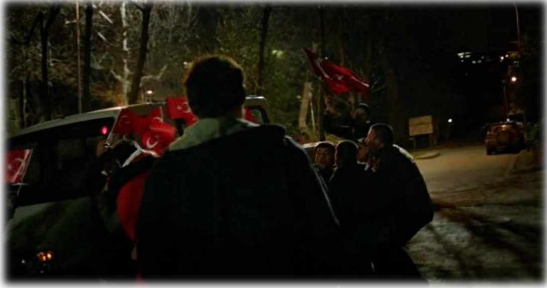
Resim 52. Asker vedası.