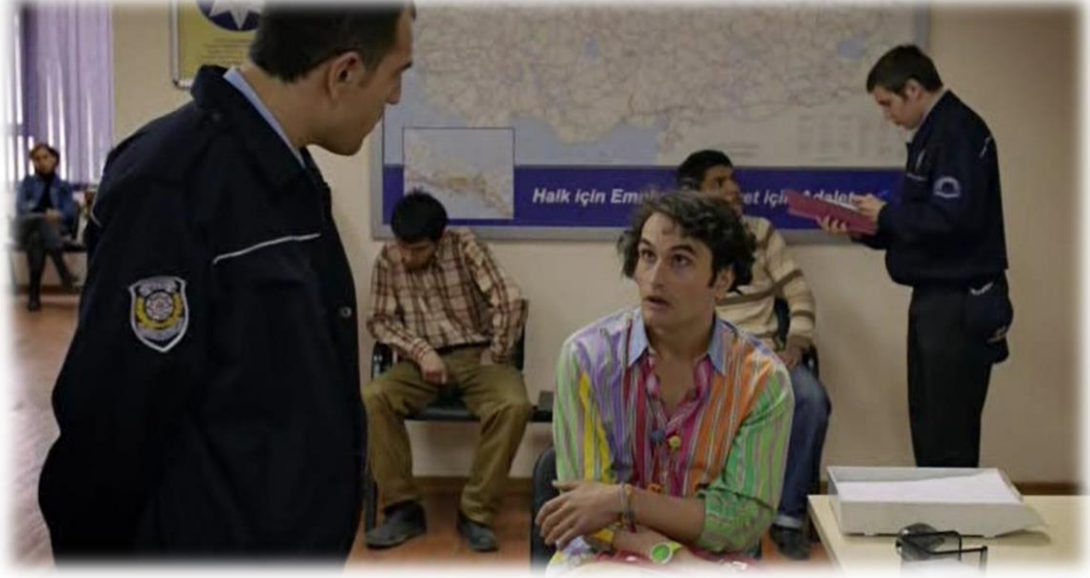
Resim 55. Can'ın devletin güvenlik kurumlarıyla ilk "dans"ı.