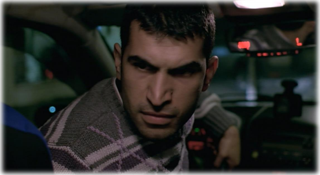
Resim 43. Kızgın taksi şoförü.

tümcelerinde vurgulanan “güzel ahlak”, “helal, haram, hak, hukuk” kavramları ile “rüşvet” verme eylemi arasındaki “milliyetçi muhafazakar eril ikiyüzlülük”ün oluşturduğu zıtlık dikkat çekicidir.