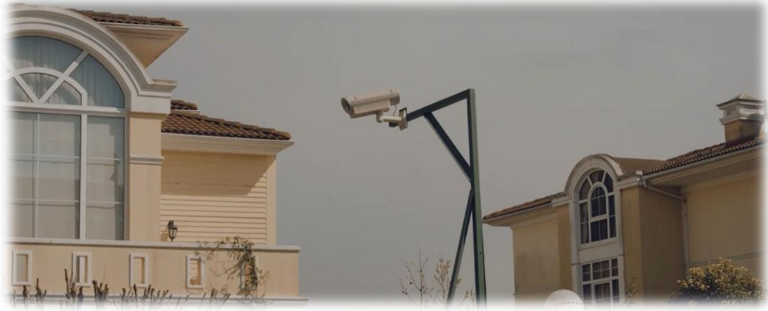
Resim 4. Mobese kameralar ve kent güvenliği.