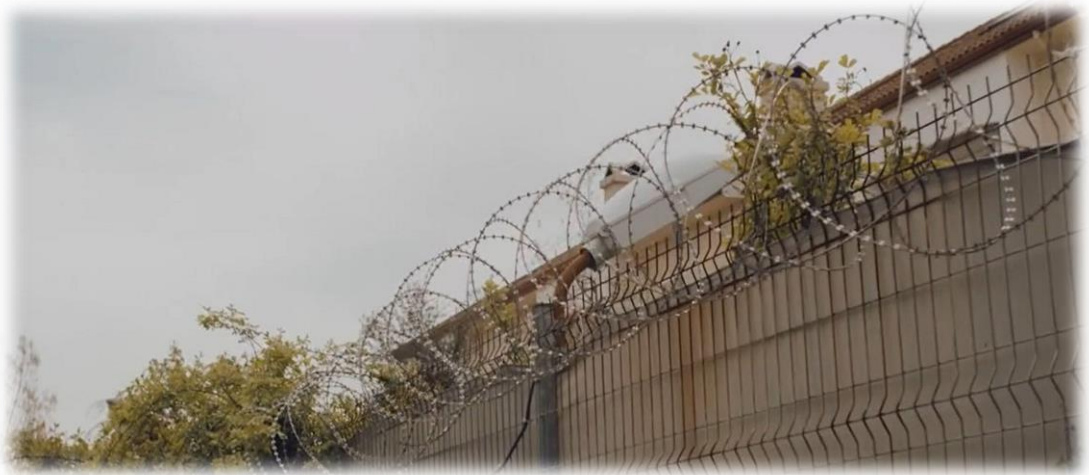
Resim 3. Lüks sitelerde yaşayanlar için güvenlik önlemler: dikenli tel örgüler.