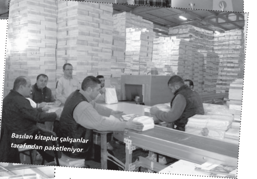
Basılan kitaplar çalışanlar tarafından paketleniyor

İlk aşamada ders kitabı tasarım grubu, alan editörüyle birlikte ders kitabının kimliğini belirler. Ders kitabının belirlenmesi, öğretim programı içinde bu dersin nerede yer aldığı, ders kapsamındaki konuların nasıl ele alınacağı, hangi öğretim ortamlarının nasıl kullanılacağı saptanması gibi bir dizi kararın alınmasını ve bu kararlar doğrultusunda örnek materyallerin üretimini içeren bir süreçtir. Diğer bir aşamada ise konu yazarları tarafından kaleme alınan ünite metinleri ve görsel malzemeler oluşturur. Yazarlar ham ünite metinlerini örnek üniteye uygun olarak işler ve editör aracılığıyla dizgi birimine ulaştırılmasını sağlar. Artık dizgi biriminde hem çok yoğun, hem çok zevkli bir süreç başlamış