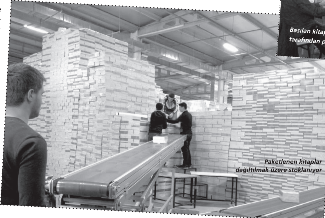
Paketlenen kitaplar dağıtılmak üzere stoklanıyor