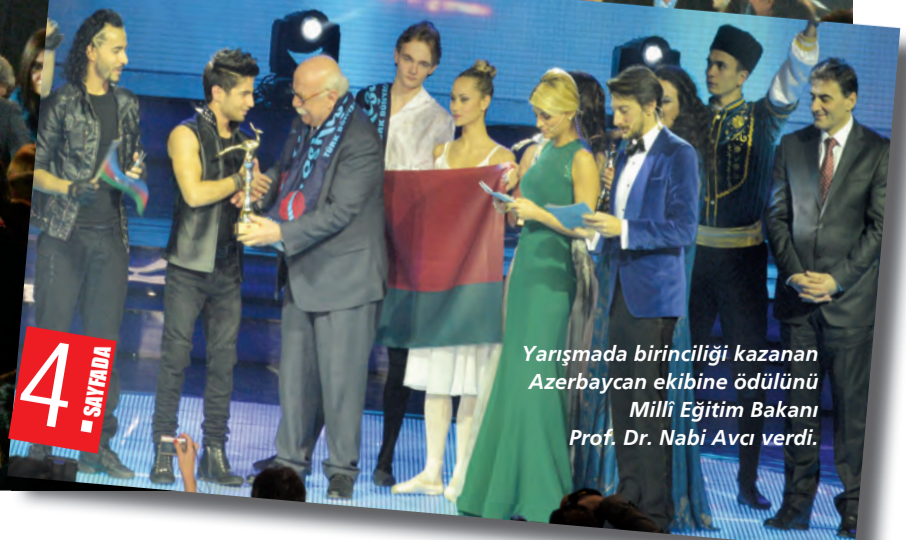
Yarışmada birinciliği kazanan Azerbaycan ekibine ödülünü Millî Eğitim Bakanı Prof. Dr. Nabi Avcı verdi.

■ Pek çok ülkede canlı yayımlanan yarışmada Azerbaycan birinci oldu. Yarışmanın finalini Millî Eğitim Bakanı Prof. Dr. Nabi Avcı ile Kosova Kamu Yönetimi Bakanı Mahir Yağcılar da yerinde izledi.