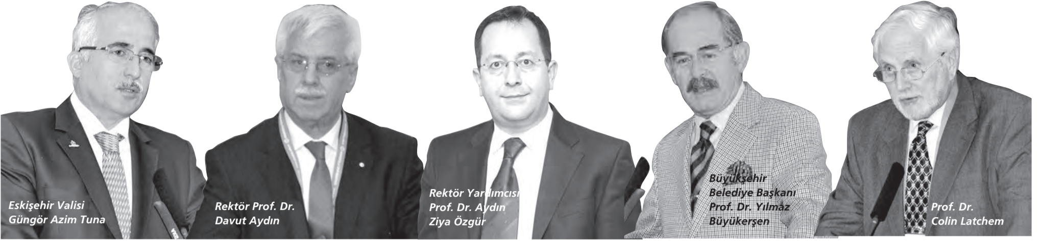
Eskişehir Valisi Güngör Azim Tuna