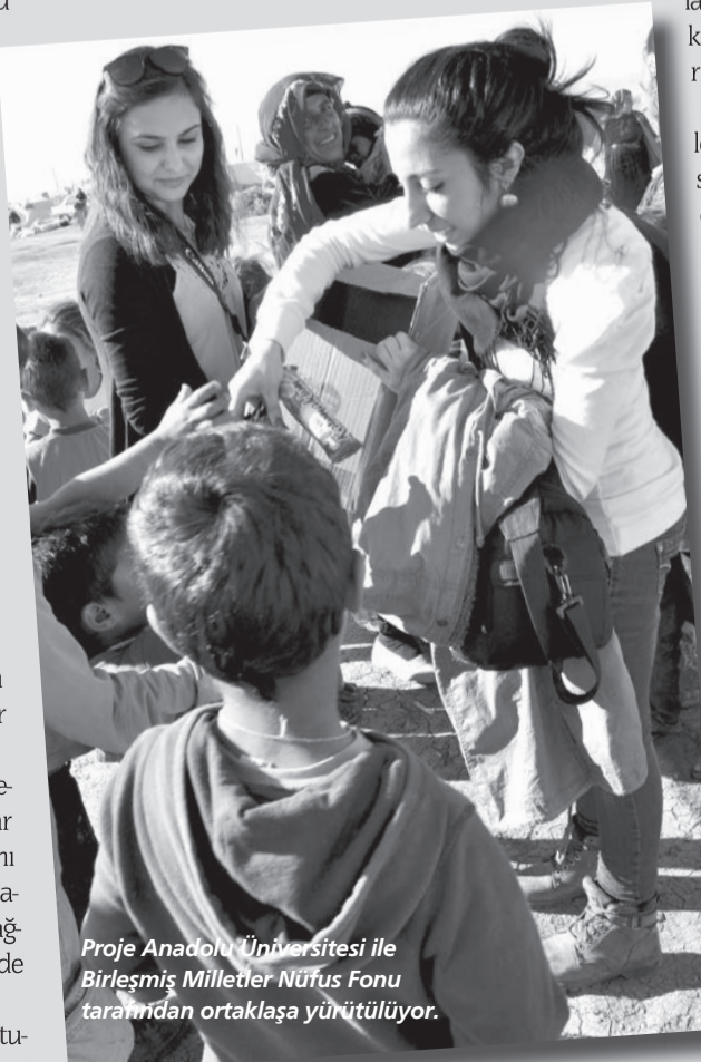
Proje Anadolu Üniversitesi ile Birleşmiş Milletler Nüfus Fonu tarafından ortaklaşa yürütülüyor.

Çalışma kapsamında önümüzdeki günlerde kurulacak Göç Okulu Ofisiyle birlikte üniversite ile göçer ailelerin çocuklarının kaynaşması hedefleniyor.