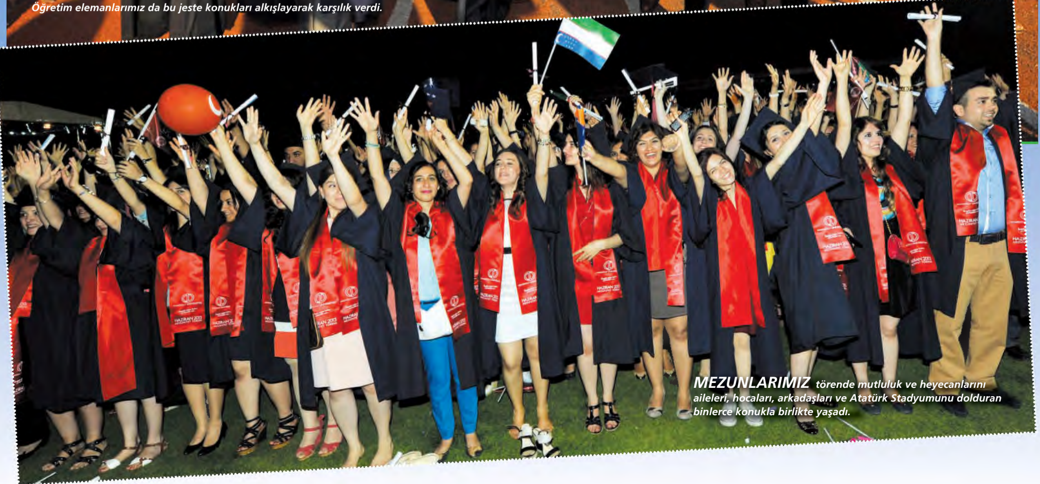
MEZUNLARIMIZ törende mutluluk ve heyecanlarını aileleri, hocaları, arkadaşları ve Atatürk Stadyumunu dolduran binlerce konukla birlikte yaşadılar.