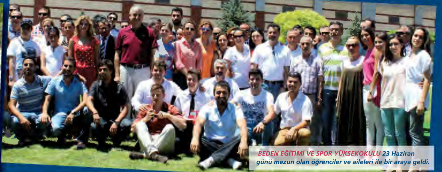
BEDEN EĞİTİMİ VE SPOR YÜKSEKOKULU 23 Haziran günü mezun olan öğrenciler ve aileleri ile bir araya geldi.