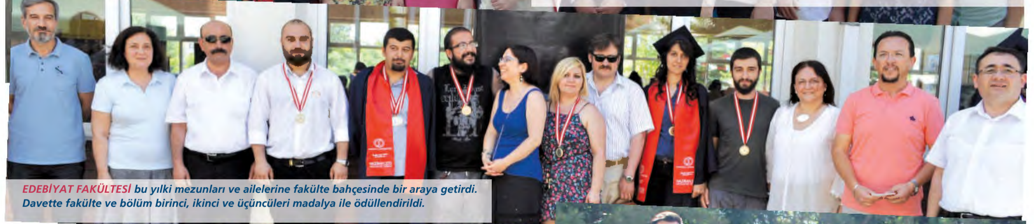
EDEBİYAT FAKÜLTESİ bu yılki mezunları ve ailelerine fakülte bahçesinde bir araya getirdi. Davette fakülte ve bölüm birinci, ikinci ve üçüncüleri madalya ile ödüllendirildi.