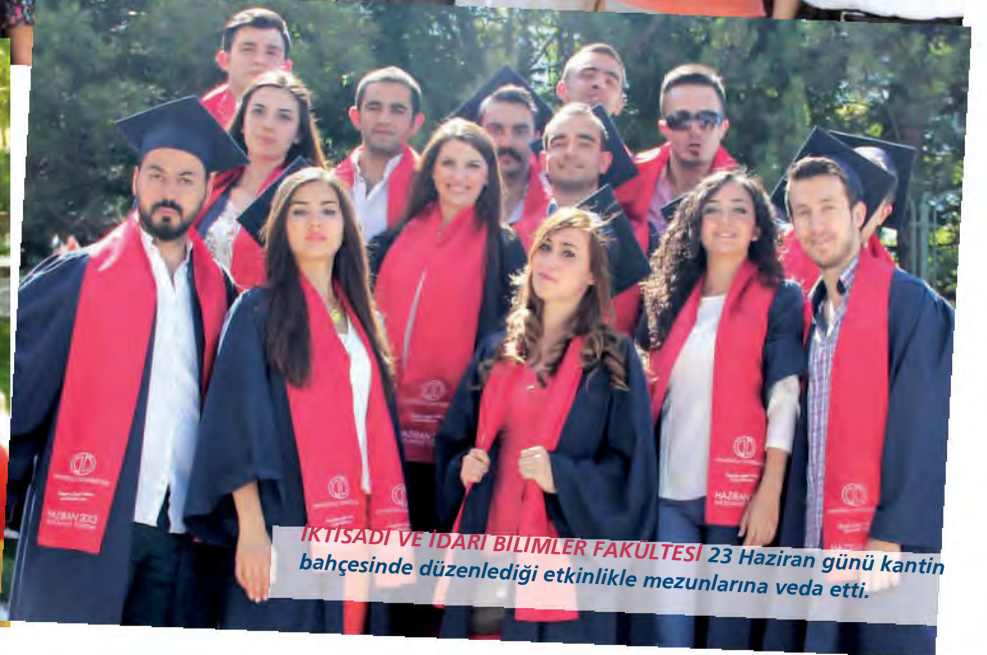
İKTİSADİ VE İDARİ BİLİMLER FAKÜLTESİ 23 Haziran günü kantin bahçesinde düzenlediği etkinlikle mezunlarına veda etti.