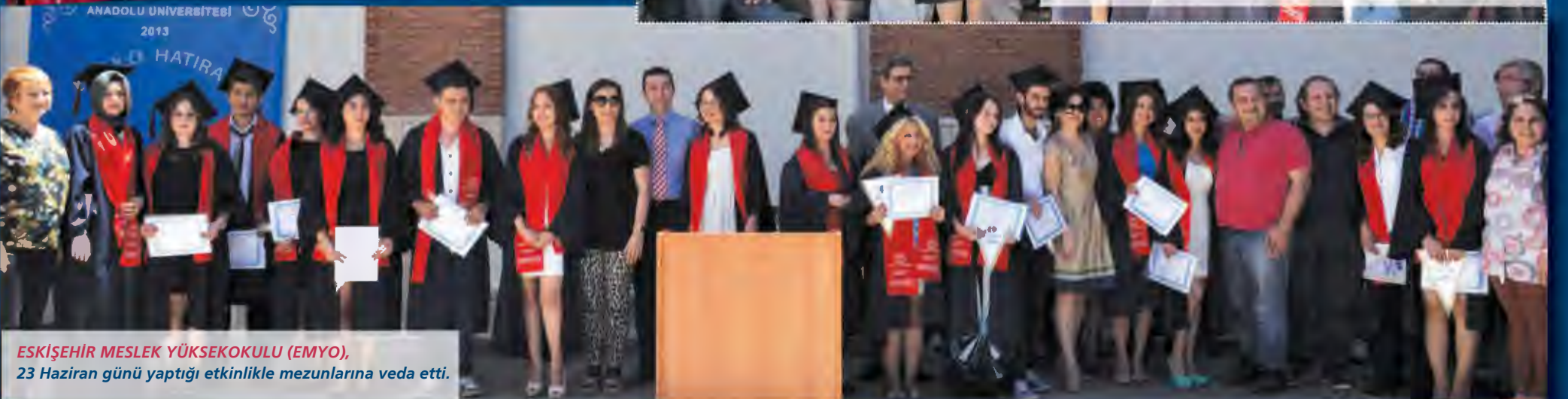
ESKİŞEHİR MESLEK YÜKSEKOKULU (EMYO) , 23 Haziran günü yaptığı etkinlikte mezunlarına veda etti.