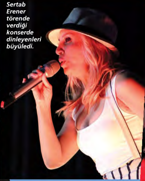
Sertab Erener törende verdiği konserde dinleyenleri büyüledi.