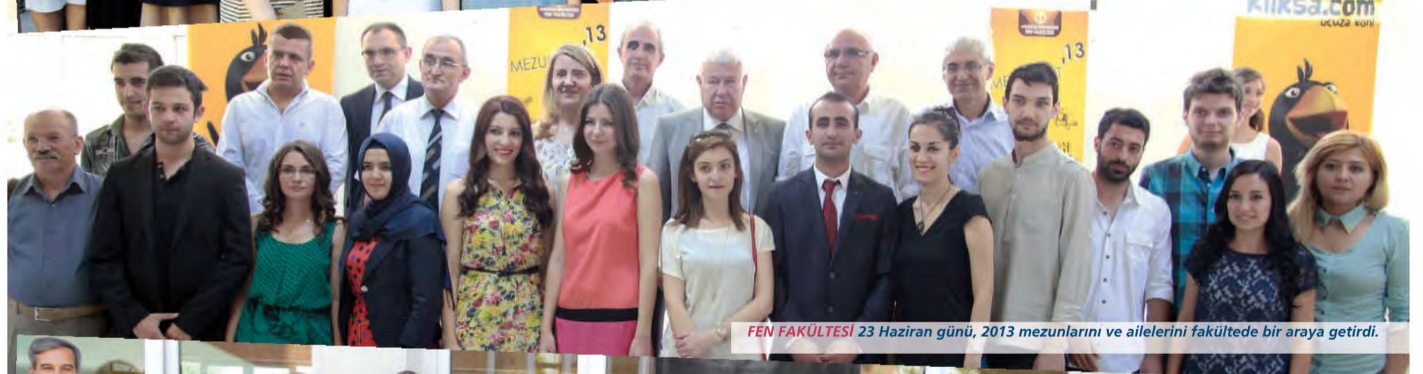
FEN FAKÜLTESİ 23 Haziran günü, 2013 mezunlarını ve ailelerini fakültede bir araya getirdi.