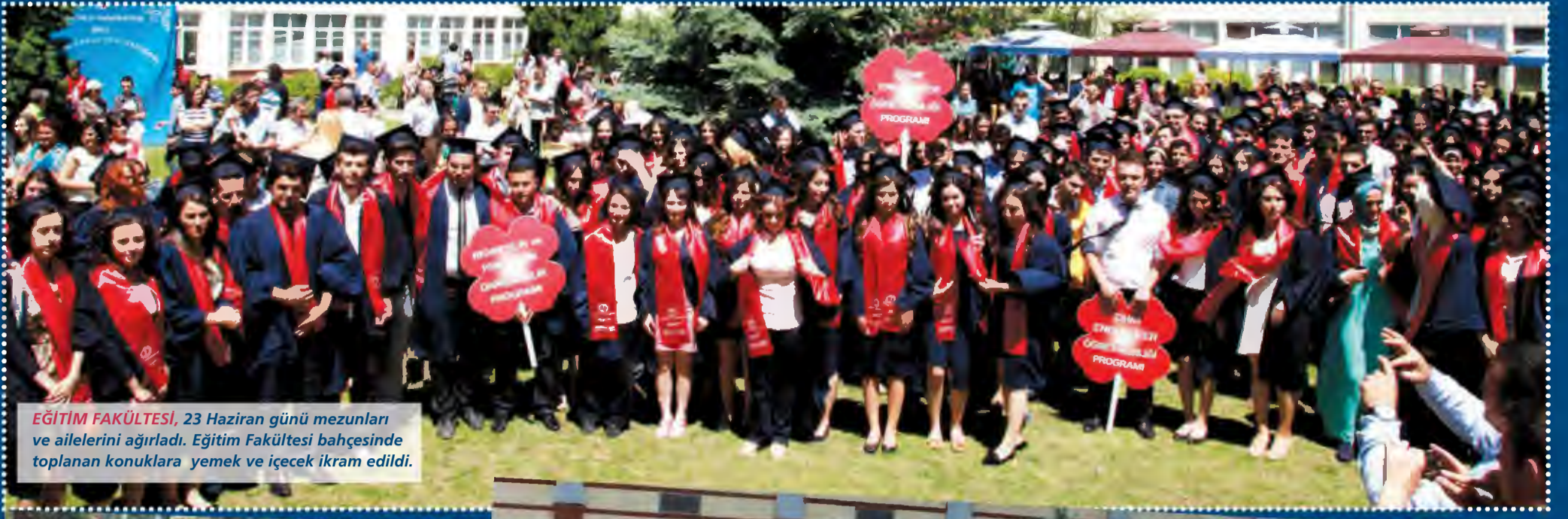
EĞİTİM FAKÜLTESİ , 23 Haziran günü mezunları ve ailelerini ağırladı. Eğitim Fakültesi bahçesinde toplanan konuklara yemek ve içecek ikram edildi.