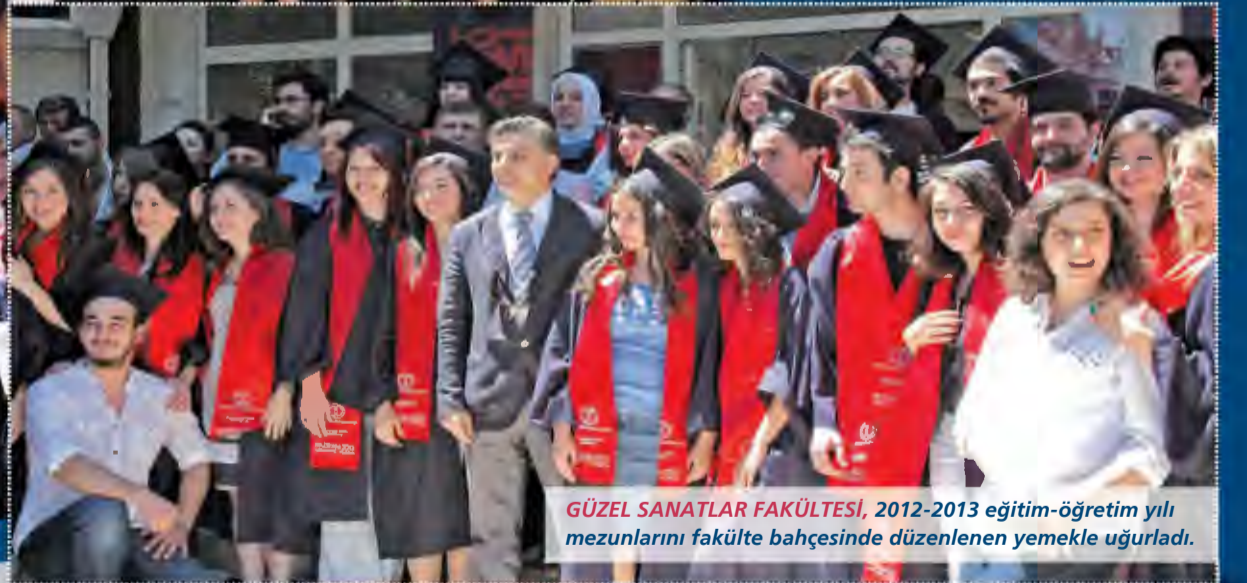
GÜZEL SANATLAR FAKÜLTESİ , 2012-2013 eğitim-öğretim yılı mezunlarını fakülte bahçesinde düzenlenen yemekle uğurladı.