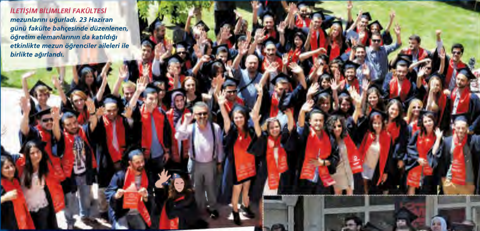
İLETİŞİM BİLİMLERİ FAKÜLTESİ mezunlarını uğurladı. 23 Haziran günü fakülte bahçesinde düzenlenen, öğretim elemanlarının da katıldığı etkinlikte mezun öğrenciler aileleri ile birlikte ağırlandı.

2013 mezunlarımız, Mezuniyet Töreni öncesinde aileleri ve öğretim elemanlarımızla kendi okullarının bahçesinde bir araya geldi.