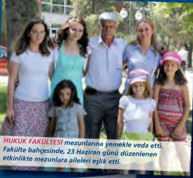
HUKUK FAKÜLTESİ mezunlarına yemekle veda etti. Fakülte bahçesinde, 23 Haziran günü düzenlenen etkinlikte mezunlara aileleri eşlik etti.