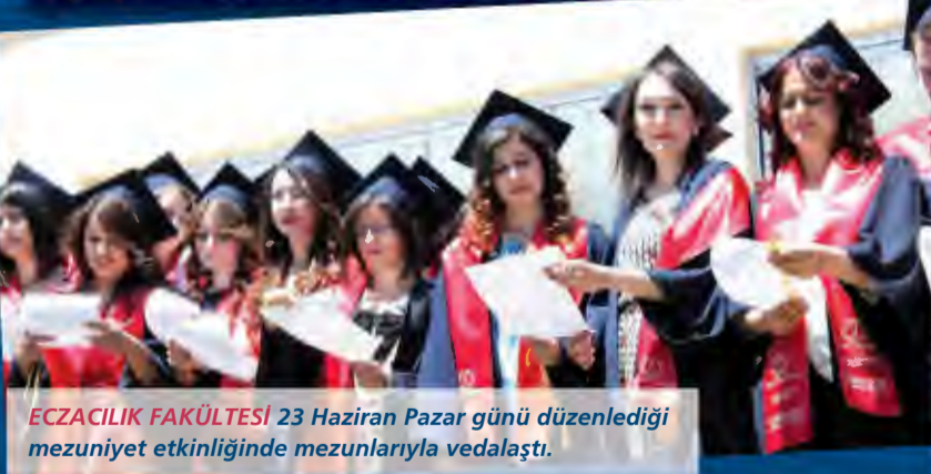
ECZACILIK FAKÜLTESİ 23 Haziran Pazar günü düzenlediği mezuniyet etkinliğinde mezunlarıyla vedalaştı.

Tüm fotoğraflar için... ⇨ http://www.anadolu.edu.tr