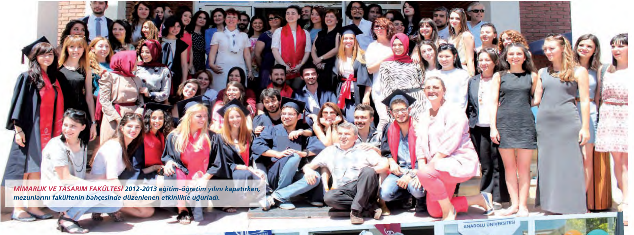
MİMARLIK VE TASARIM FAKÜLTESİ 2012-2013 eğitim-öğretim yılını kapatırken, mezunlarını fakültenin bahçesinde düzenlenen etkinlikle uğurladı.