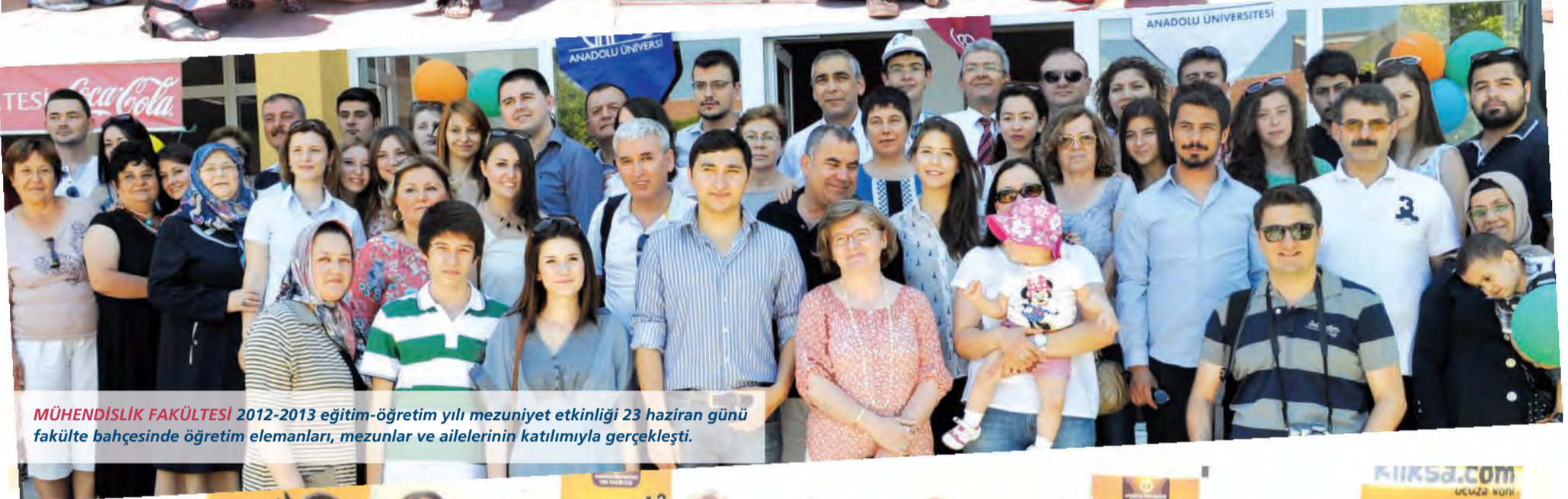
MÜHENDİSLİK FAKÜLTESİ 2012-2013 eğitim-öğretim yılı mezuniyet etkinliği 23 Haziran günü fakülte bahçesinde öğretim elemanları, mezunlar ve ailelerinin katılımıyla gerçekleşti.