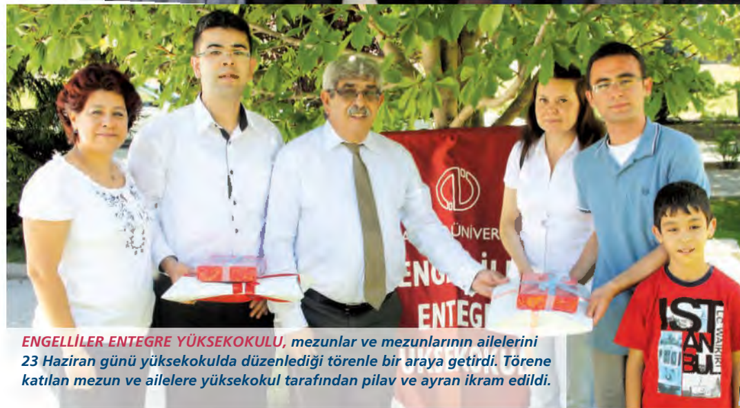
ENGELLİLER ENTEGRE YÜKSEKOKULU , mezunlar ve mezunlarının ailelerini 23 Haziran günü yüksekokulda düzenlediği törenle bir araya getirdi. Törene katılan mezun ve ailelere yüksekokul tarafından pilav ve ayran ikram edildi.