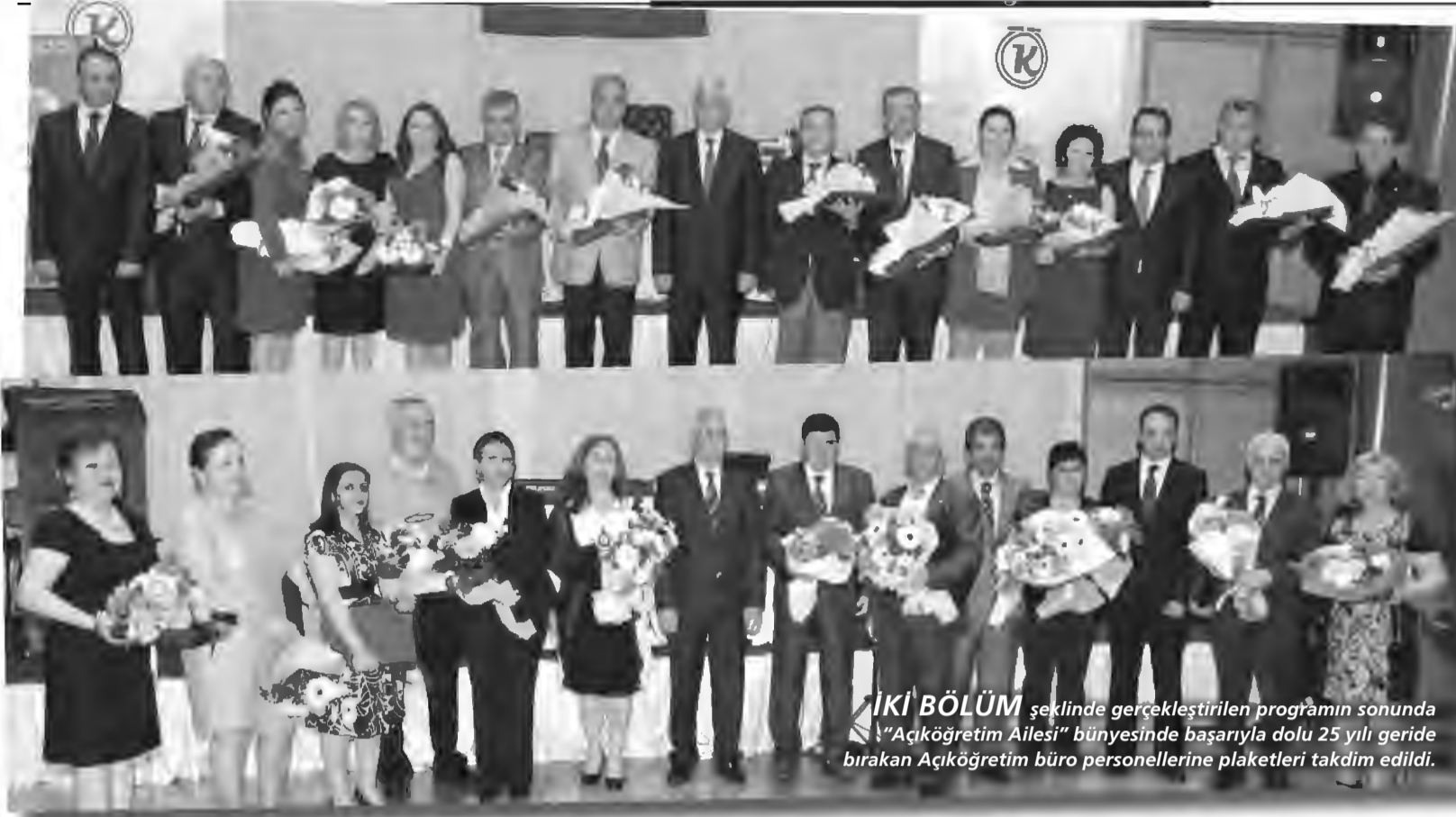
İKİ BÖLÜM şeklinde gerçekleştirilen programın sonunda "Açıköğretim Ailesi" bünyesinde başarıyla dolu 25 yılı geride bırakan Açıköğretim büro personellerine plaketleri takdim edildi.