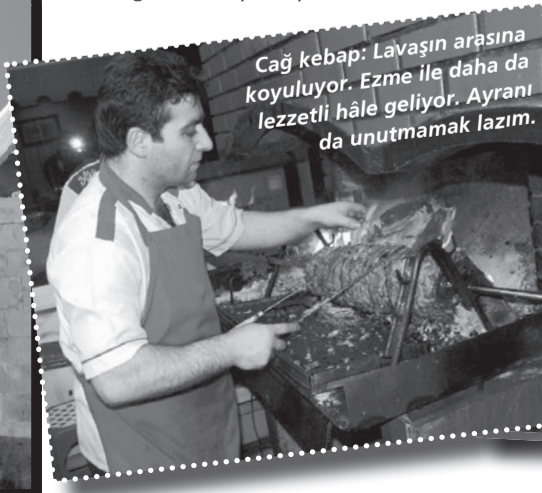
Çağ kebabı: Lavaşın arasına koyuluyor. Ezme ile daha da lezzetli hâle geliyor. Ayrıntı da unutmamak lazım.