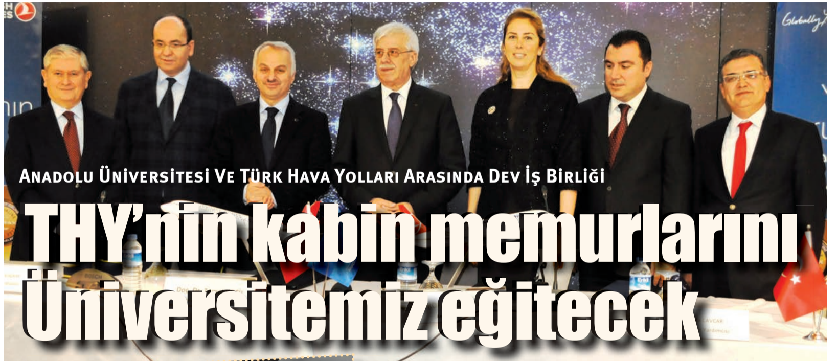
ANADOLU ÜNİVERSİTESİ VE TÜRK HAVA YOLLARI ARASINDA DEV İŞ BİRLİĞİ

■ Üniversitemiz tarafından gerçekleştirilen Karacahisar Kalesi Kazısında çekilen fotoğraflar Eskişehir halkıyla buluştu. ▶ 6. SAYFADA