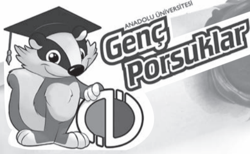
Genç Porsuklar projesi ile Mezunlar Birliğinin bir logosu oldu.

Mezunlar Birliği 2012'de kendi hedeflerine ulaşmaya başladı. İstanbul'da Mezunlar Birliği ofisi açtık ve yıllarca önce Anadolu Üniversitesi'nden mezun olmuş, hatta emekli olmuş mezunlarımız gönüllü olarak ofiste duruyorlar. Anadolu Üniversitesinden mezun olan her öğrencinin Mezunlar Birliğine kaydını yaptık. 2012 yılında 4876 mezunun kaydını yaptık. Tüm mezun etkinliklerine katıldık. Haber, fotoğraf ve röportajlar hazırladık. Diğer üniversitelerde de sorun olan mezunların izlenmesi, bizim üniversitemizde de bir sorundu. Bu düşünceden yola çıkarak bizden mezun olan öğrenci şu an ne yapıyor, bölümüyle ilgili bir alanda mı çalışıyor yoksa kendine başka bir meslek mi buldu düşüncesiyle istatistik birimiyle beraber bir mezun izleme anketi hazırladık. Bu ankette 10 tane soru bulunuyor. Öğrencilerimize gönderdik. Şu ana kadar 7 binin üzerinde geri dönüş aldık. Oradan da dedikim gibi şunu elde edeceğiz. "Mezunlar ne yaptı? Nerede çalışıyor? Kaç yıldan beri çalışıyor? Okuldan aldığı bilgilerden yararlandı mı?" gibi sorulara cevap bulacağız. Gerçekleştirdiğimiz her etkinliği web portalından mezunlara duyurduk. Çeşitli sektörlerden gelen iş duyurularını ilgili alanlardaki mezunlarımıza e-posta ve web sitesinden ilettik. Mezunlarımıza bayram ve özel günlerde e-kart gönderdik. Çalışma yaşamındaki mezunların kariyer gelişimlerini izledik.