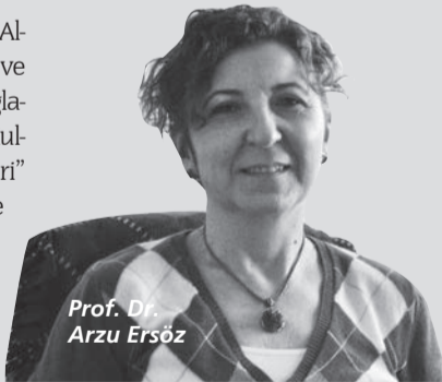
Prof. Dr. Arzu Ersöz

üzerine sayısız uygulama ve patent bulunmakla birlikte altın bağlayan proteinlerin kullanılması üzerine birkaç yayın ve bir patent bulunmaktadır. Bu çalışmalarda temel problem, altın bağlayan proteinlerin kararsızlıkları ve tekrar kullanılabilir olmayışlarıdır. Bu olumsuzluğun bizim patentlediğimiz yaklaşımla aşılabilirliğini 6 ay kadar önce test ettik ve altın bağlayan proteinlerle yaptığımız ayırma kolonları ile altını, gümüşü de içeren çözeltilerden spesifik olarak tekrar tekrar ayırabildiğimizi keşfettik."