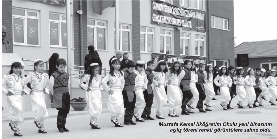
Mustafa Kemal İlköğretim Okulu yeni binasının açılış töreni renkli görüntülere sahne oldu.

Konuşmaların ardından kurdele kesilerek okulun açılışı gerçekleştirildi.