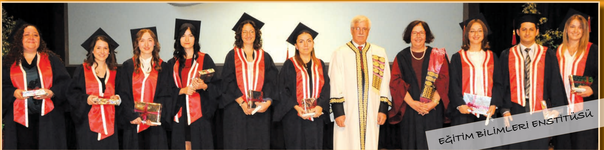
EĞİTİM BİLİMLERİ ENSTİTÜSÜ