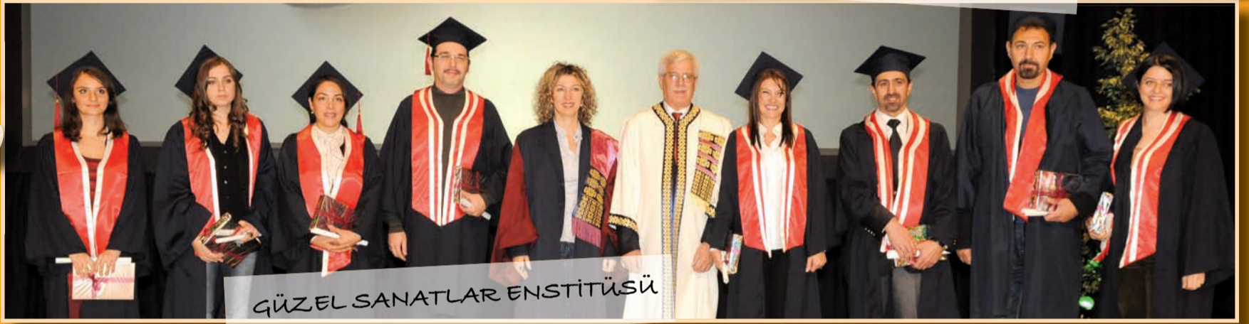
GÜZEL SANATLAR ENSTİTÜSÜ

2011 -2012 öğretim yılı lisansüstü mezunlarımız, törenle diplomalarını aldılar.