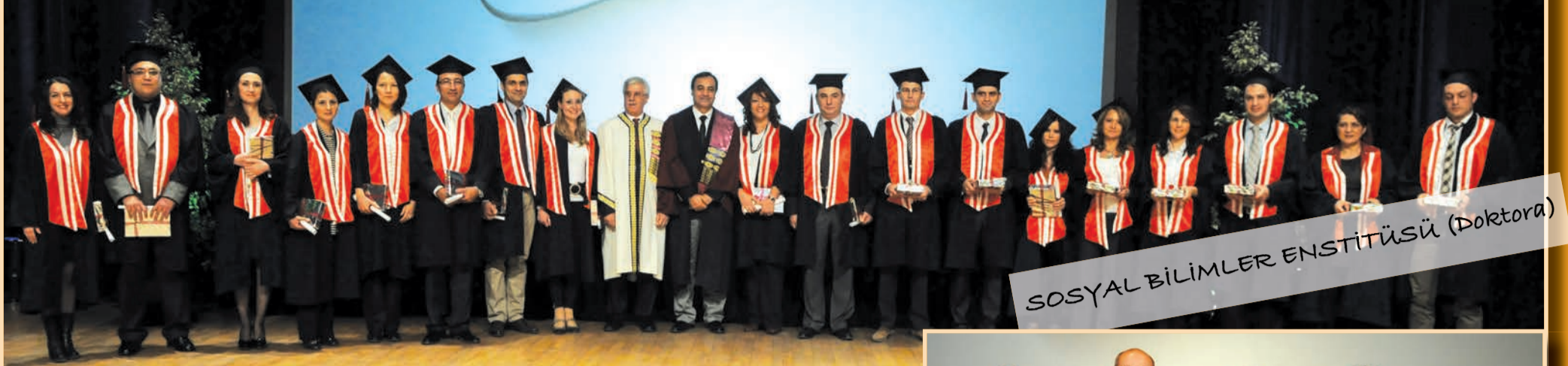
SOSYAL BİLİMLER ENSTİTÜSÜ (Doktora)

■ Üniversitemiz enstitülerindeki lisansüstü eğitimlerini başarıyla tamamlayan öğrenciler, 16 Kasım günü törenle diplomalarını aldı.