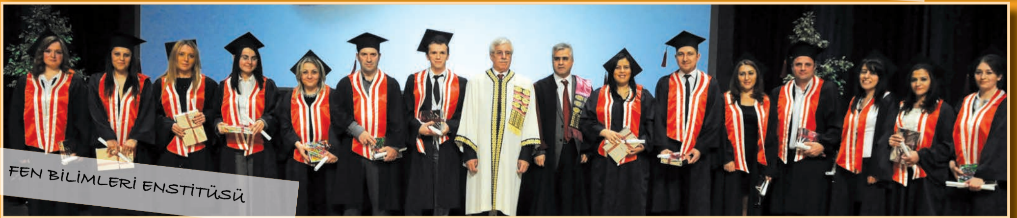
FEN BİLİMLERİ ENSTİTÜSÜ