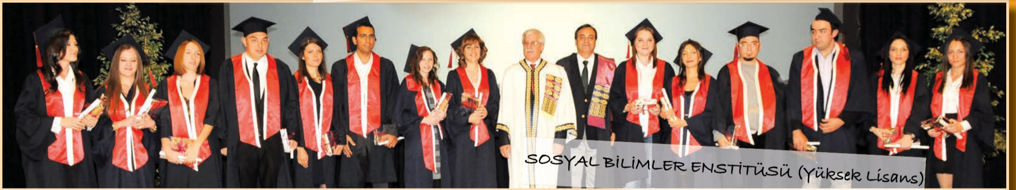
SOSYAL BİLİMLER ENSTİTÜSÜ (Yüksek Lisans)