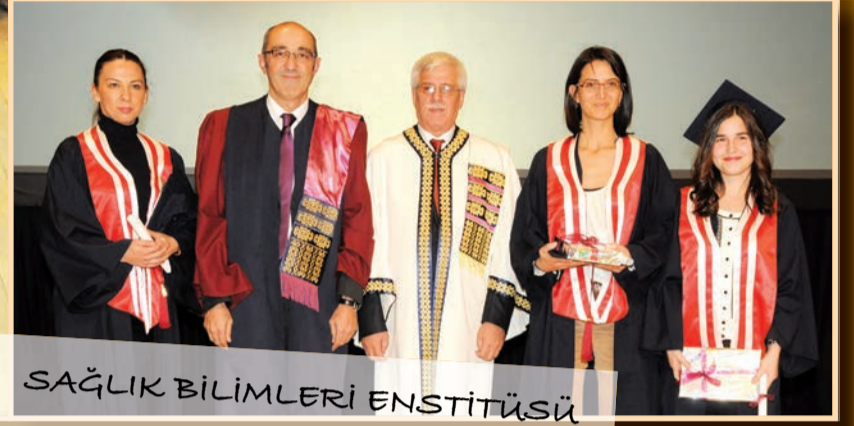
SAĞLIK BİLİMLERİ ENSTİTÜSÜ