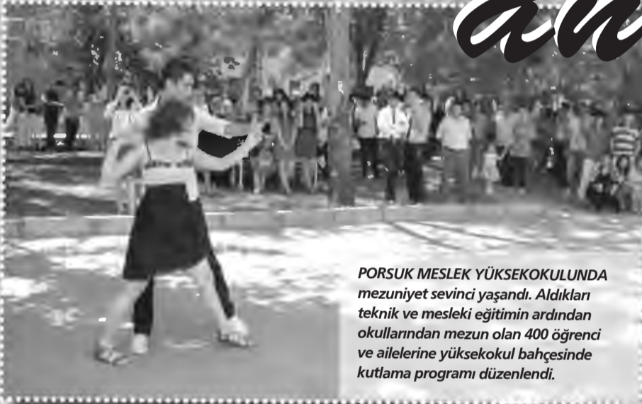
PORSUK MESLEK YÜKSEKOKULUNDA mezuniyet sevinci yaşandı. Aldıkları teknik ve mesleki eğitimin ardından okullarından mezun olan 400 öğrenci ve ailelerine yüksekokul bahçesinde kutlama programı düzenlendi.