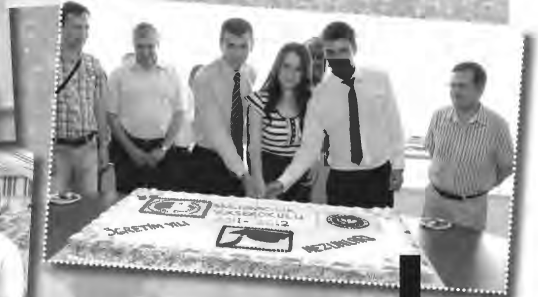
SİVİL HAVACILIK YÜKSEKOKULU, mezunlarını göklere uğurladı. Törende ailelere, okulu ve bölümü tanıtan bir tanıtım videosu gösterildi. Dereceye giren öğrenciler tören sonrası yapılan kokteyl için hazırlanan mezuniyet pastasını alkışlar eşliğinde kesti.