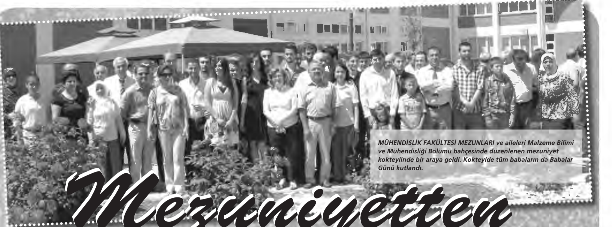
MÜHENDİSLİK FAKÜLTESİ MEZUNLARI ve aileleri Malzeme Bilimi ve Mühendisliği Bölümü bahçesinde düzenlenen mezuniyet kokteylinde bir araya geldi. Kokteyilde tüm babaların da Babalar Günü kutlandı.