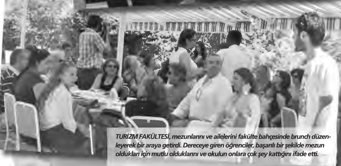
TURİZM FAKÜLTESİ, mezunlarını ve ailelerini fakülte bahçesinde brunch düzenleyerek bir araya getirdi. Dereceye giren öğrenciler, başarılı bir şekilde mezun oldukları için mutlu olduklarını ve okulun onlara çok şey kattığını ifade etti.