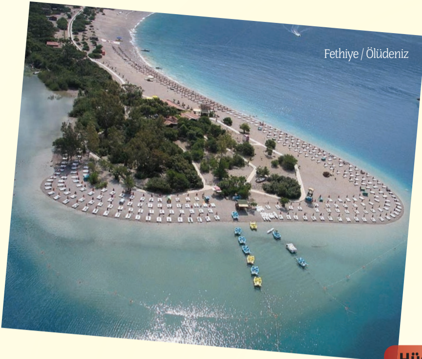
Fethiye / Ölüdeniz