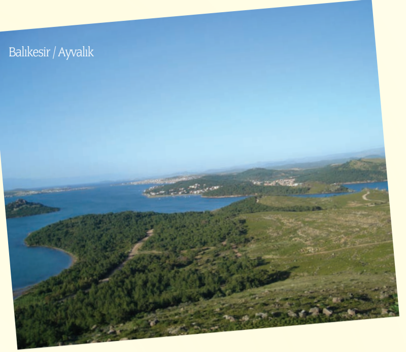
Balıkesir / Ayvalık