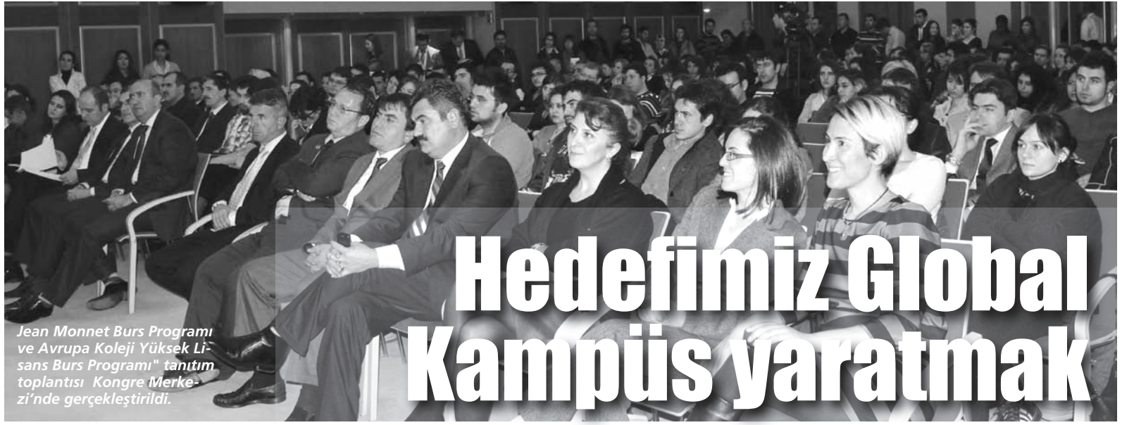
Jean Monnet Burs Programı ve Avrupa Koleji Yüksek Lisans Burs Programı tanıtım toplantısı Kongre Merkezi'nde gerçekleştirildi.