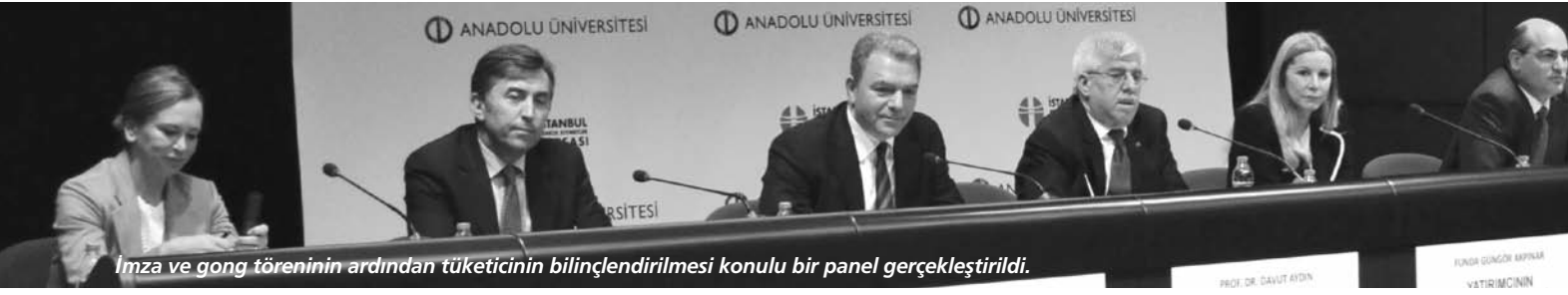
İmza ve gong töreninin ardından tüketicinin bilinçlendirilmesi konulu bir panel gerçekleştirildi.