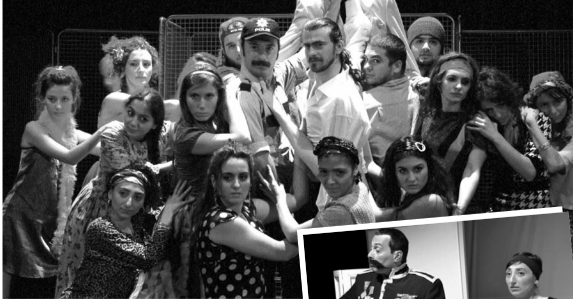
Tiyatro Anadolu, haftada dört kez seyircisi ile buluşuyor