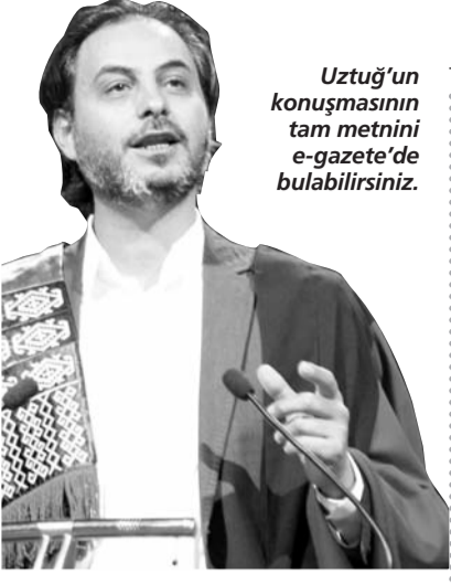
Uztuğ'un konuşmasının tam metnini e-gazete'de bulabilirsiniz.