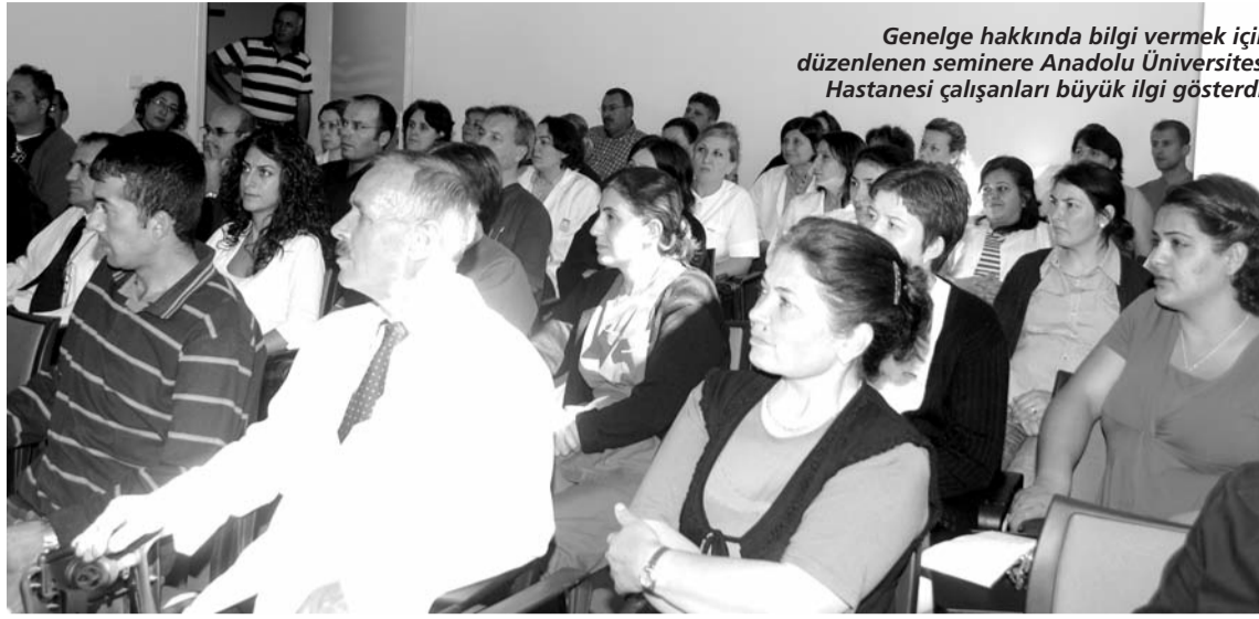
Genelge hakkında bilgi vermek için düzenlenen seminare Anadolu Üniversitesi Hastanesi çalışanları büyük ilgi gösterdi.

Anadolu Üniversitesi ve TEGV, 29 Mart 2011 tarihinde imzaladığı protokolle işbirliğini etkin hale getirdi. TEGV eğitim parklarından Eskişehir Atatürk Eğitim Parkı Ali Numan Kıracı Etkinlik Merkezi'nde her yıl yaklaşık 3500 çocuğu faaliyetleriyle geleceğe hazırlıyor.