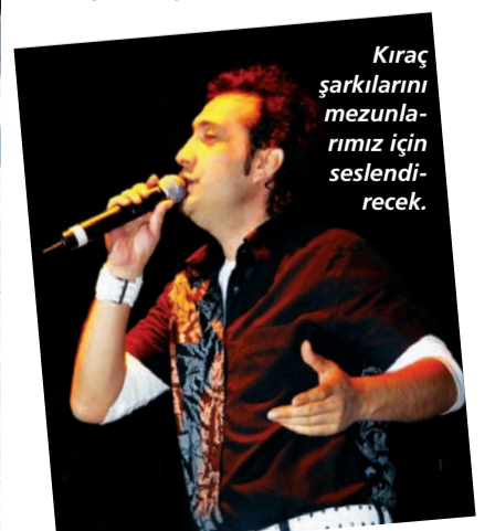
Kıracı şarkılarını mezunlarımız için seslendirecek.

Anadolu Üniversitesi 2010-2011 Eğitim - Öğretim Yılı Mezuniyet Töreni, Eskişehir Atatürk Stadyumu'nda verilecek konserin ardından düzenlenecek havai fişek gösterisiyle sona erecek.