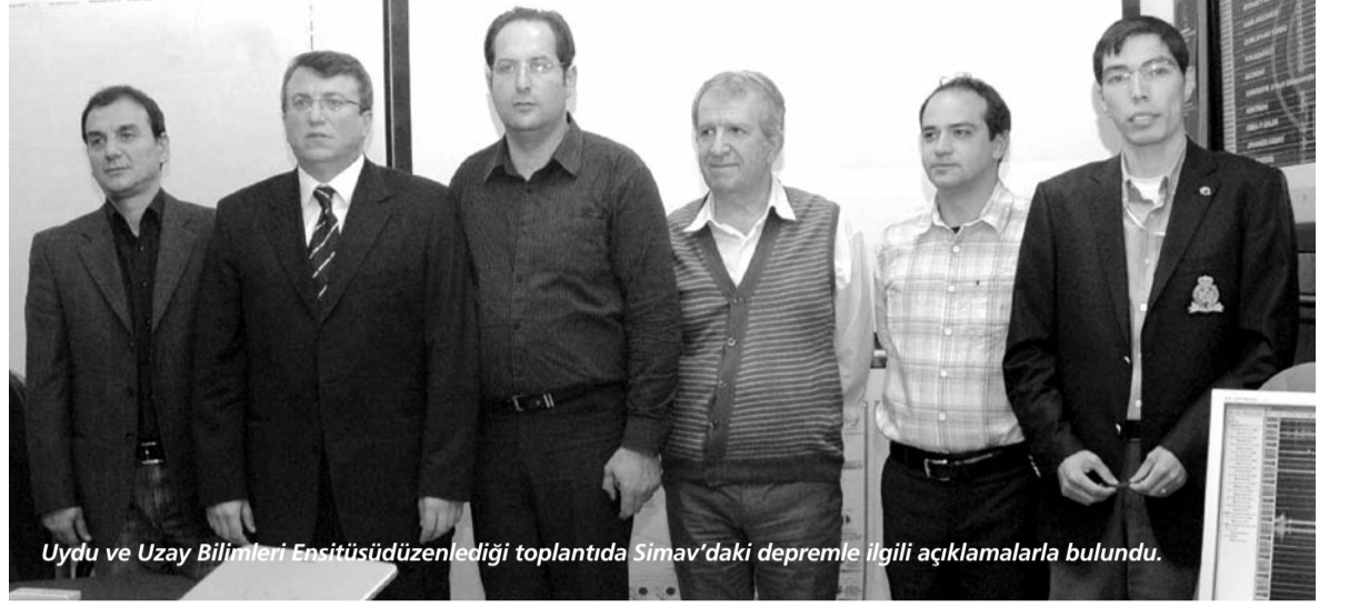
Uydü ve Uzay Bilimleri Enstitüsünde düzenlenen toplantıda Simav'daki depremle ilgili açıklamalarla bulundu.

Kütahya-Simav fay hattında oluşan ve "genişleme rejimi" denilen olayların meydana gelmesiyle bu depremin oluştuğunu belirten Ecevitöğlü "Simav'da meydana gelen bu deprem ilk değildir. Tarihin çeşitli dönemlerinde birçok deprem yaşanan bu bölgede 28 Mart 1970 saat 23:05'de 7.2 büyüklüğünde deprem olmuş, 1086 kişi hayatını kaybetmiş, 1260 kişi yaralanmıştır. 17 Şubat 2009 saat 07:28'de 5 büyüklüğünde bir deprem daha olmuştur.