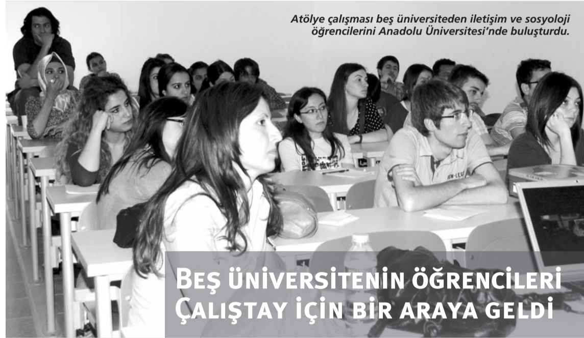
Atölye çalışması beş üniversiteden iletişim ve sosyoloji öğrencilerini Anadolu Üniversitesi'nde buluşturdu.

Turizm çalışma alanının bir disiplin olduğunu savunanlar, çalışma anlayışı ve bilgi üretme anlayışı açısından turizm alanının bir disiplin olmak açısından yeterli birikime sahip olduğunu, ancak bağımsız bir bilim alanı olmak açısından görece olgunlaşmış bir bilim olduğunu söylediler.