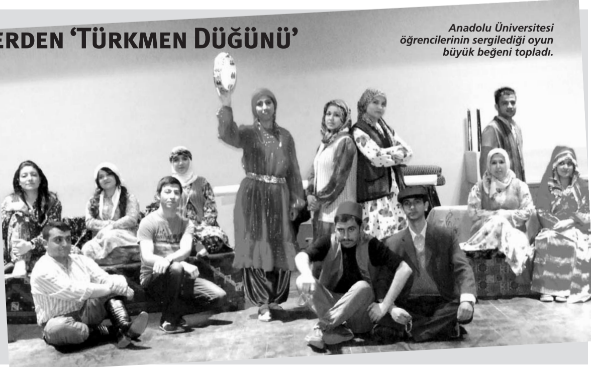
Anadolu Üniversitesi öğrencilerinin sergilediği oyun büyük beğeni topladı.