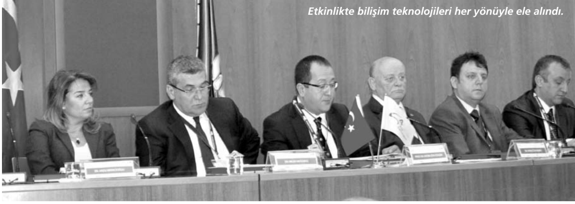
Etkinlikte bilişim teknolojileri her yönüyle ele alındı.