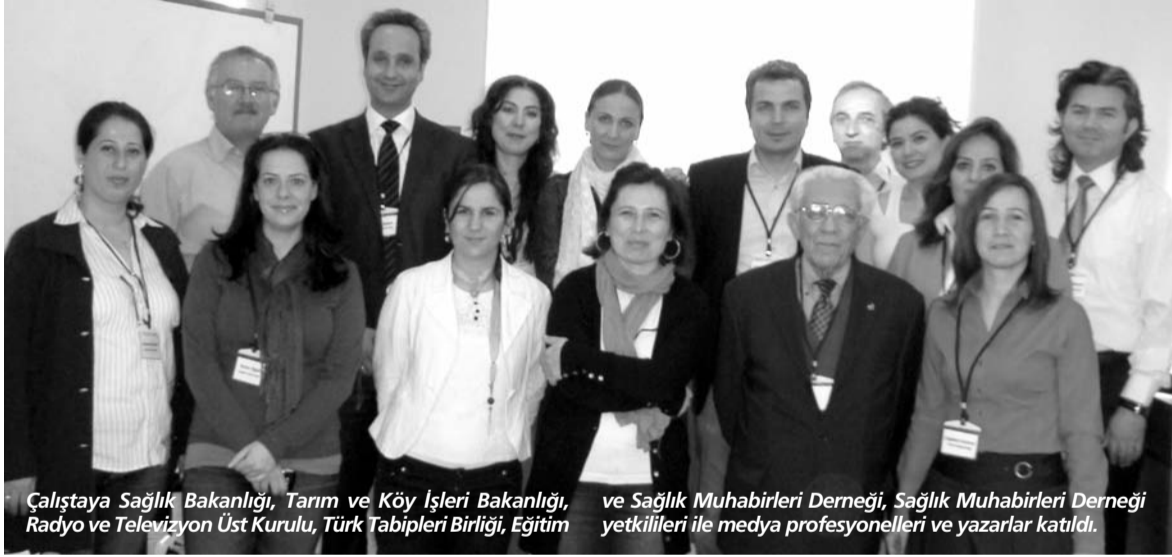
Çalıştaya Sağlık Bakanlığı, Tarım ve Köy İşleri Bakanlığı, Radyo ve Televizyon Üst Kurulu, Türk Tabipleri Birliği, Eğitim ve Sağlık Muhabirleri Derneği, Sağlık Muhabirleri Derneği yetkilileri ile medya profesyonelleri ve yazarlar katıldı.

2.Sağlık konulu yayınlar karşısında halkın savunmasız konumunda olduğuna