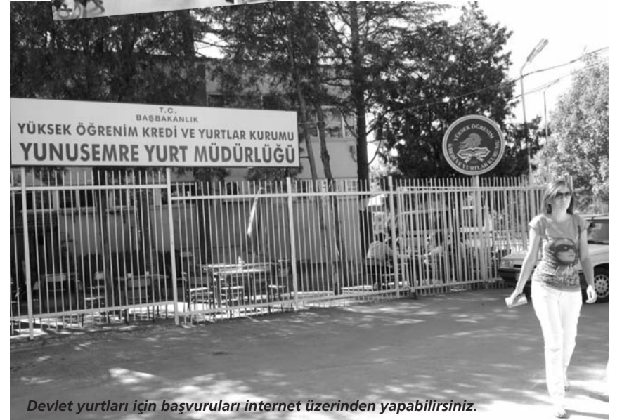
Devlet yurtları için başvuruları internet üzerinden yapabilirsiniz.