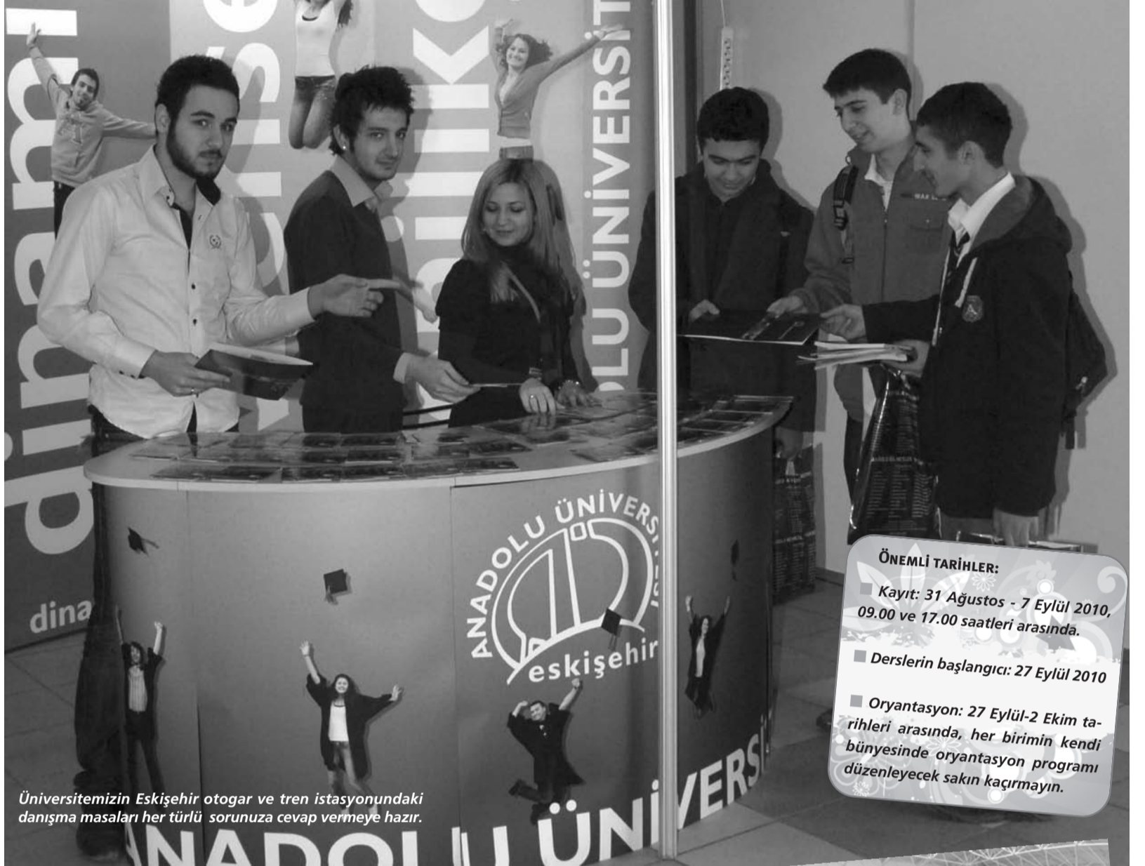
Üniversitemizin Eskişehir otagar ve tren istasyonundaki danışma masaları her türlü sorunuza cevap vermeye hazır.

Uzun yollardan geldiniz, kayıt işlemlerinizi tamamladınız, karnınız acıkmaya başlamış olmalı! Yunussemre Kampüsü içerisinde bulunan Pino'da, Anadolu Üniversitesi Yemekhanesi'nin yakınında bulunan Motta ve Keyif'te, tenis kortlarının yanındaki Volkan Pastanesi'nde yemek yiyebilirsiniz. Hijyenik şartlarda lezzetli yemekler yapan yemekhaneden yararlanmak için ise http://yemekhane.anadolu.edu.tr/yemekhane/index.x.html adresi üzerinden daha önceden rezervasyon yaptırmanız gerekiyor. Daha fazla bilgiyi internet sitesi