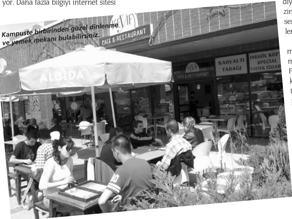
Kampüste birbirinden güzel dinlenme ve yemek mekânı bulabilirsiniz.