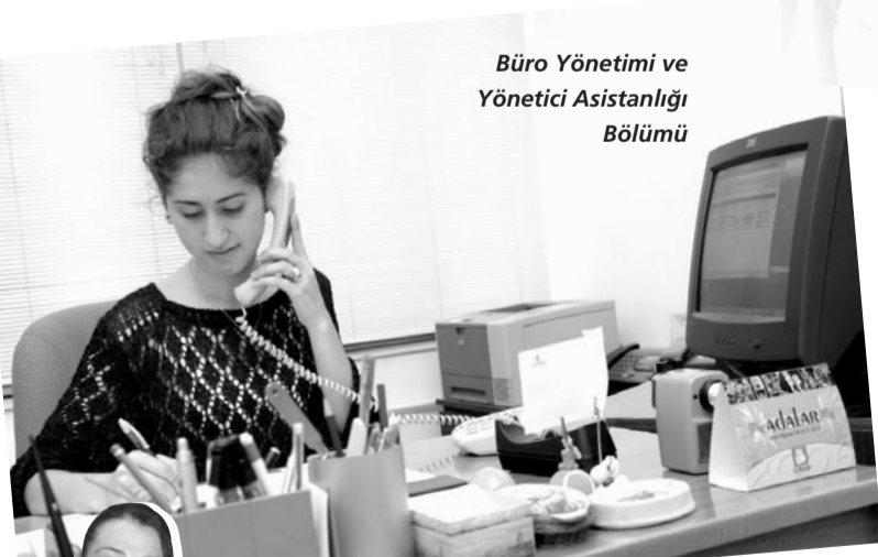
Büro Yönetimi ve Yönetici Asistanlığı Bölümü

her yıl sekreterler haftasında yapmış olduğumuz ve bu sene onuncusunu gerçekleştirdiğimiz çok büyük çapta bir kongre düzenledik. Bunların yanında sektöre ilgili bu konunun duayenlerini okulumuza davet edip seminerler düzenliyoruz. Sektör ve özellikle de Eskişehir bizden bu konuda çok yararlanıyor." diye konuştu.