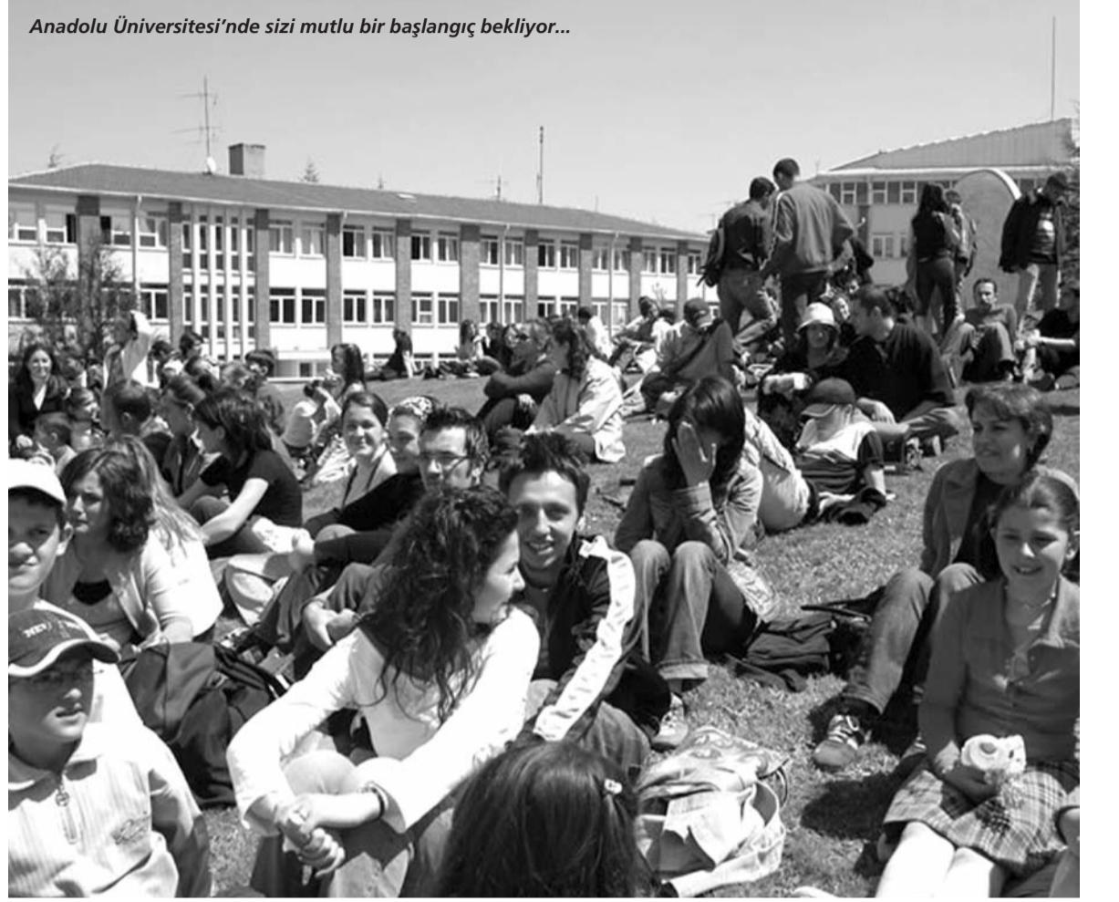
Anadolu Üniversitesi'nde sizi mutlu bir başlangıç bekliyor...