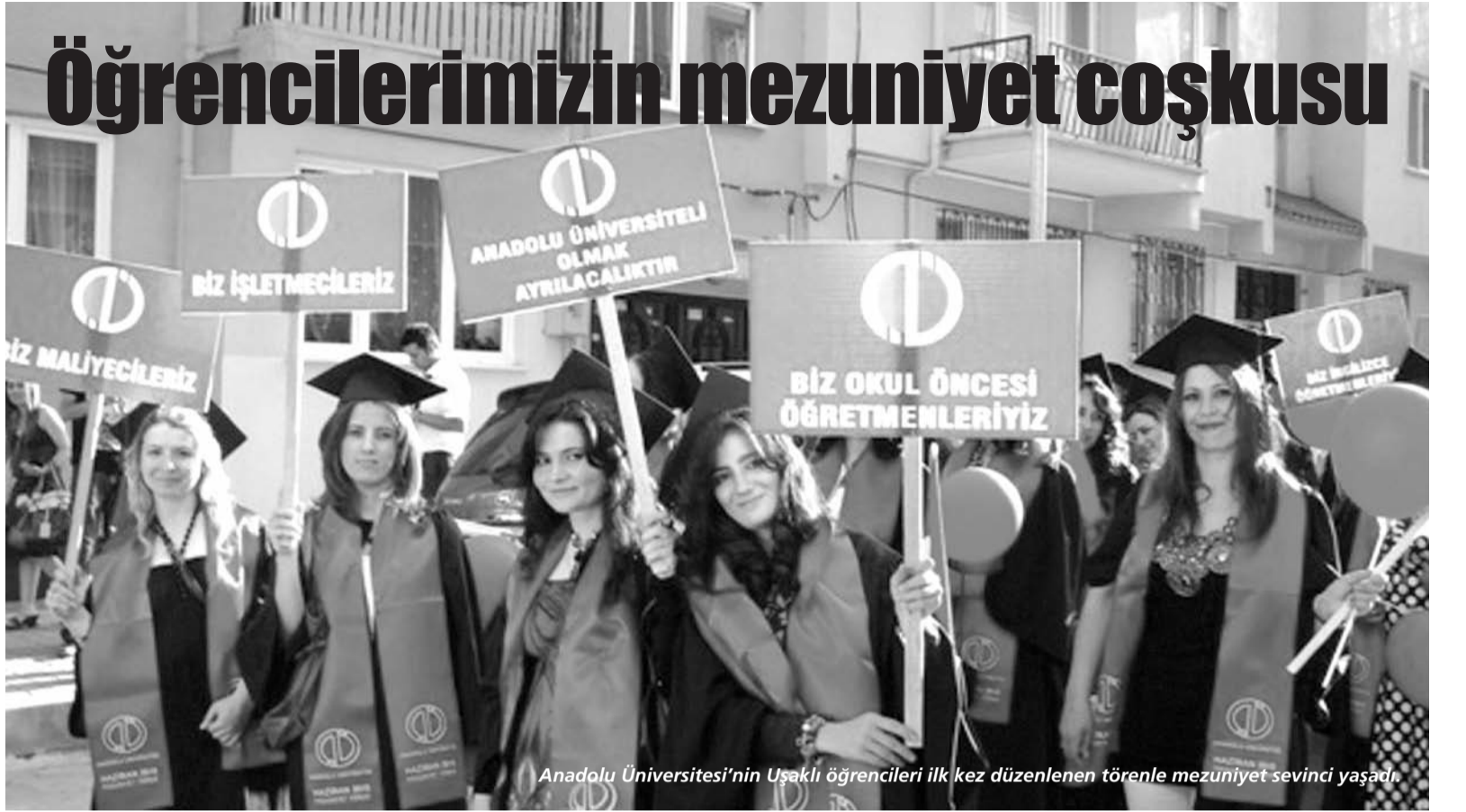
Anadolu Üniversitesi'nin Uşaklı öğrencileri ilk kez düzenlenen törenle mezuniyet sevinci yaşadı.

■ Çinli bir mucit, depremde "tam koruma" sağlayan yatak icat etti. China Daily gazetesi, 66 yaşındaki Vang Vinşi'nin patentini aldığı yatağın dört bir yanının, içme suyu, konserve yiyecek, megafon ve çekek konulabilen dolaplarla çevrili olduğunu, yatağın depremden sonra göçük altında kalan kişinin günlerce dayanabilmesini sağlayabildiğini yazdı. Gazetenin haberinde, sarsıntı sırasında sert bir tahtanın yatağın üzerine kaplayarak, molozun yataktaki kişinin üzerine düşmesini engellediği belirtildi.