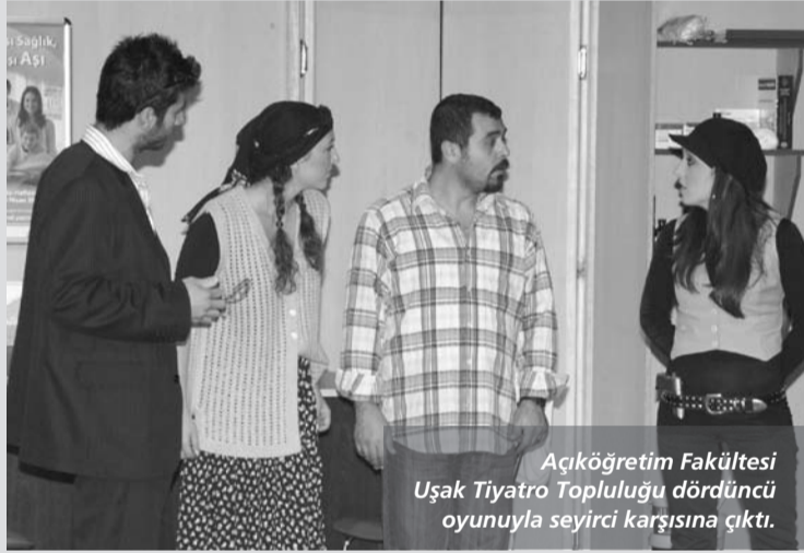
Açıköğretim Fakültesi Uşak Tiyatro Topluluğu dördüncü oyunuyla seyirci karşısına çıktı.

Açıköğretim Fakültesi Uşak Tiyatro Topluluğu, Tuncer Cücenolu'nun Boyacı adlı oyununu 13-14-15 Kasım günlerinde sanatseverlerle buluşturdu. Atatürk Kültür Merkezi'nde sahnelenen ve Bayram Turgut'un yönettiği oyuna seyirciler büyük ilgi gösterdi. 2009-2010 öğretim Yılı Sosyal ve Kültürel etkinlikleri ve 10 Kasım Atatürk Haftası kutlamaları kapsamında izleyici ile buluşan iki perdelik komedide rol alan öğrenciler, profesyonel tiyatroculara taş çıkartacak bir performans sergiledi.